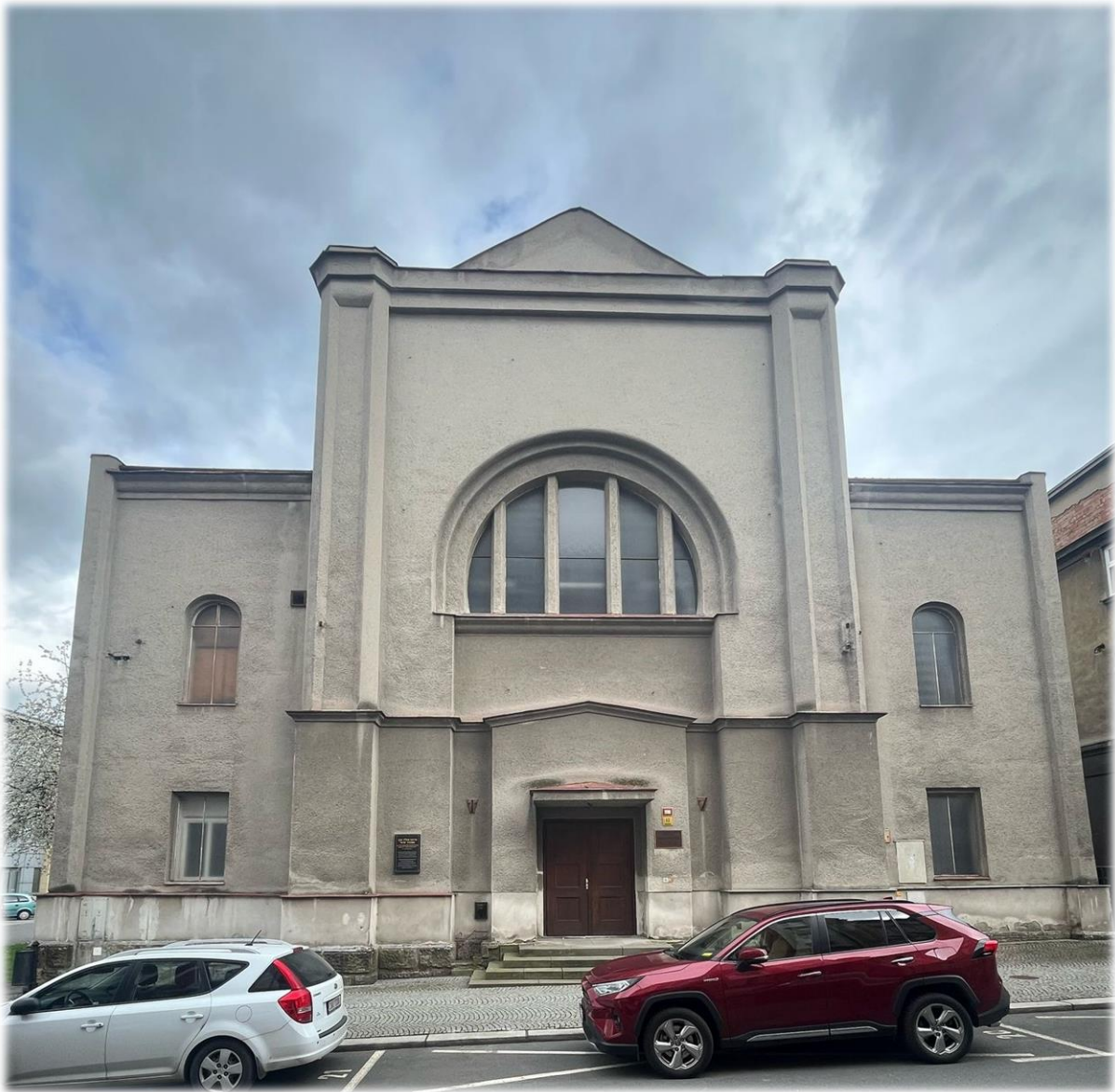
Současný pohled na novojičínskou synagogu (Archiv autora, 2024)