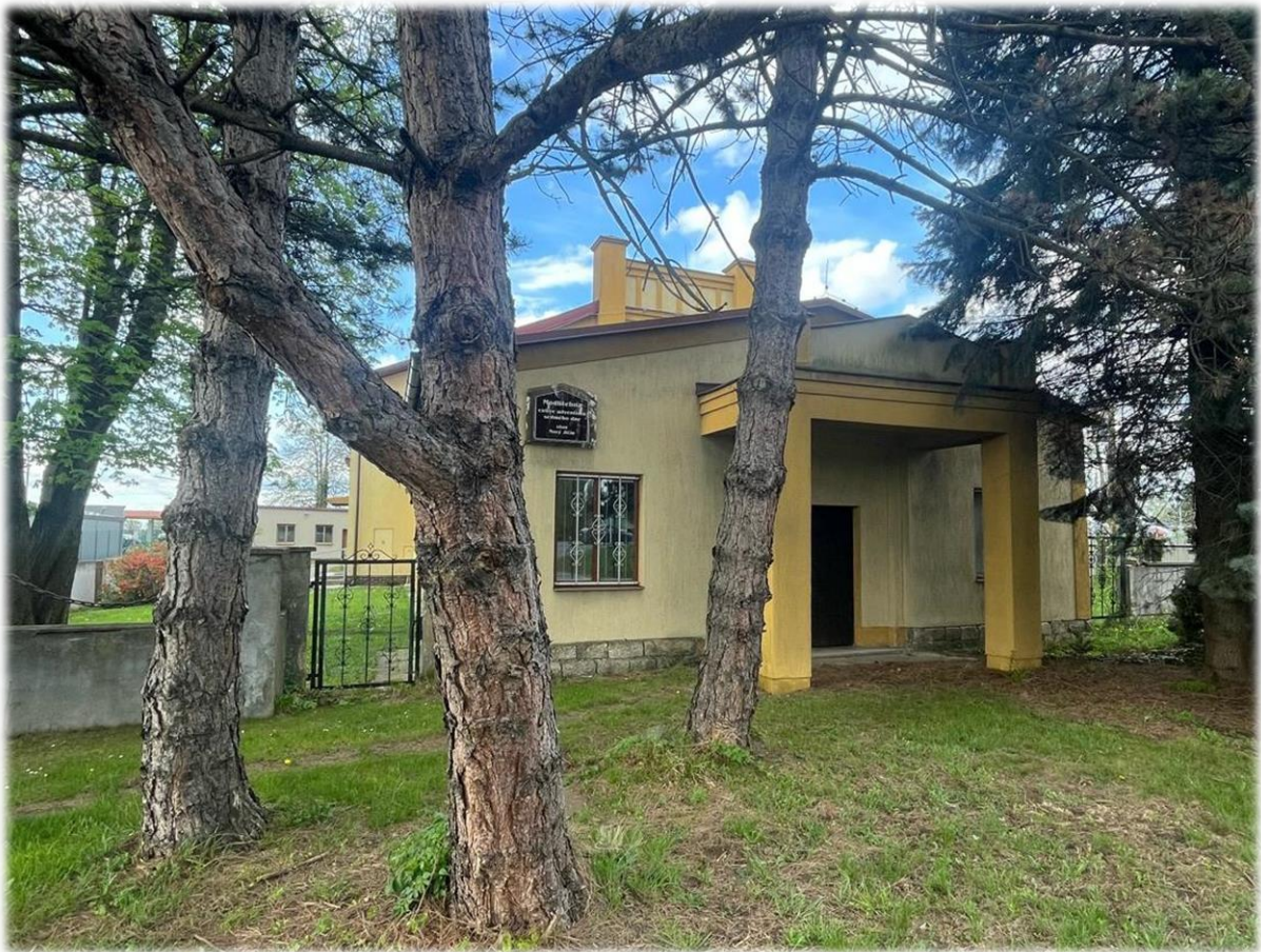
Současný pohled na průčelí obřadní budovy umístěné na bývalém židovském hřbitově