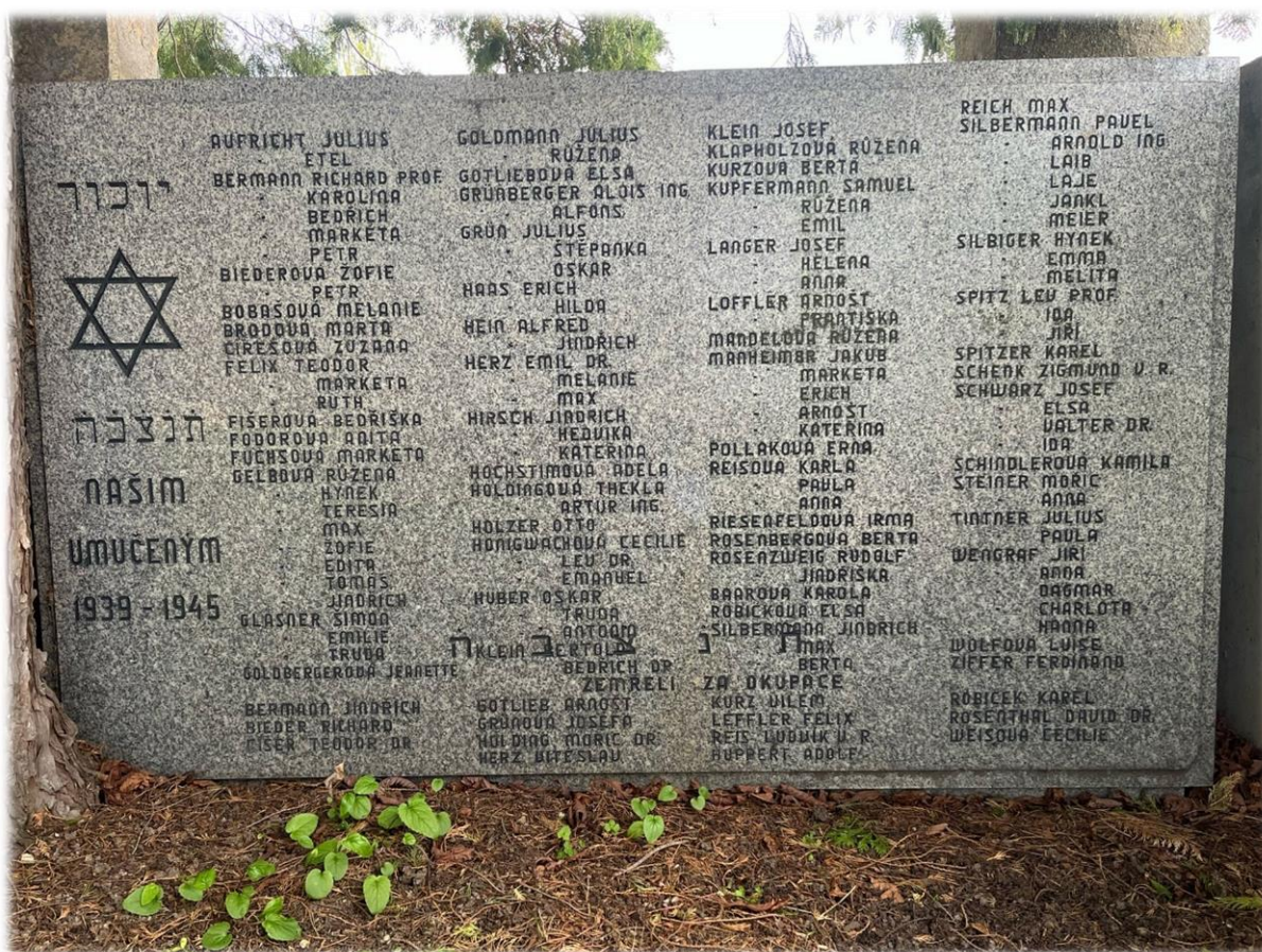
Současný pohled na pamětní desku umístěnou na bývalém židovském hřbitově