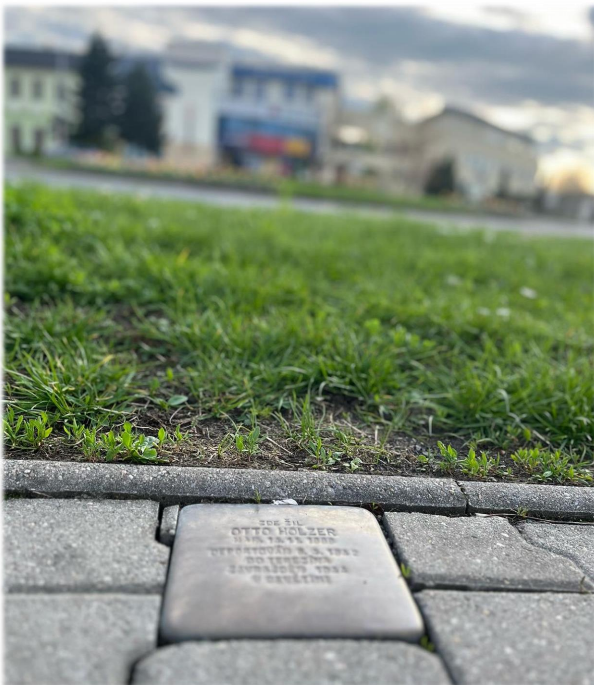
Současný pohled na Stolpersteine umístěný v centru města (Archiv autora, 2024)