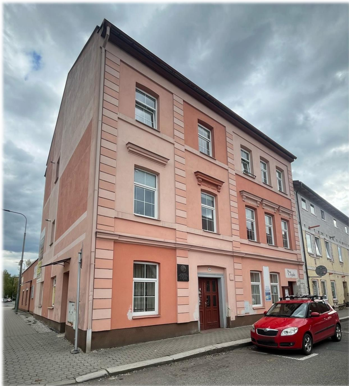
Současný pohled na dům, ve kterém žil Max Mannheimer