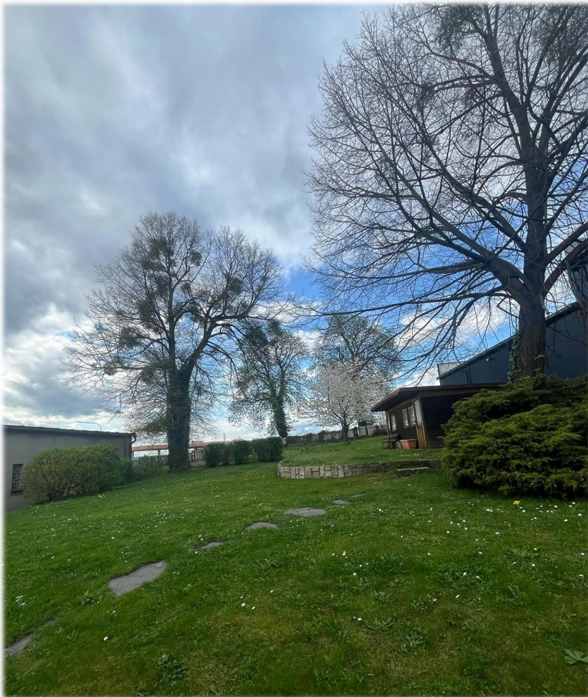
Současný pohled na plochu bývalého židovského hřbitova