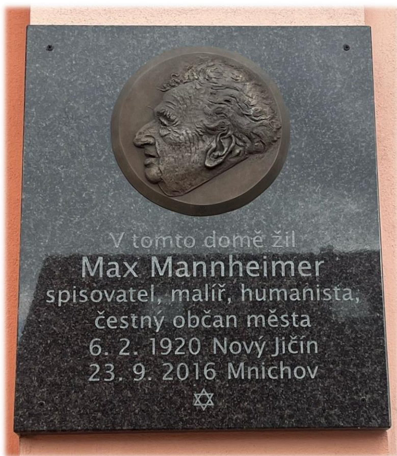
Současný pohled na pamětní desku Maxe Mannheimera