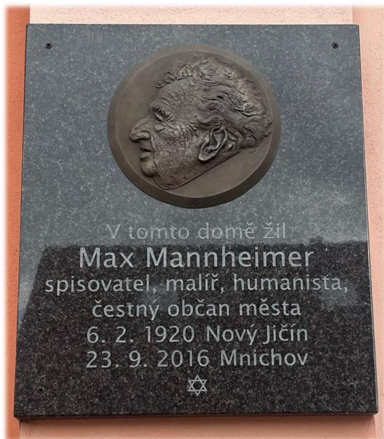
Současný pohled na pamětní desku Maxe Mannheimera