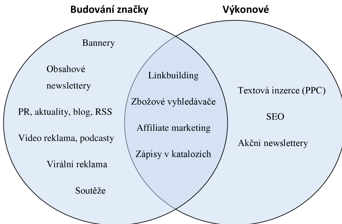
Obrázek 1 - Dvě skupiny nástrojů on-line marketingu: výkonové a budující značku (3)

Marketingových nástrojů, které lze využít ke zvyšování úspěšnosti internetového obchodu, existuje celá řada. Základní nástroje on-line marketingu lze rozdělit do dvou kategorií – výkonově zaměřené a orientované na budování značky. Výkonové nástroje jsou obecně, na rozdíl od brandových, zaměřeny na plnění kvantitativně snadno měřitelných ukazatelů. Za typický výkonový cíl je považováno například zvýšení počtu uskutečněných objednávek. Některé nástroje mohou spadat do obou skupin – v závislosti na charakteru dané kampaně. Uvedené rozdělení je, spolu s typickými zástupci obou skupin, shrnuto v následujícím schématu. (3)