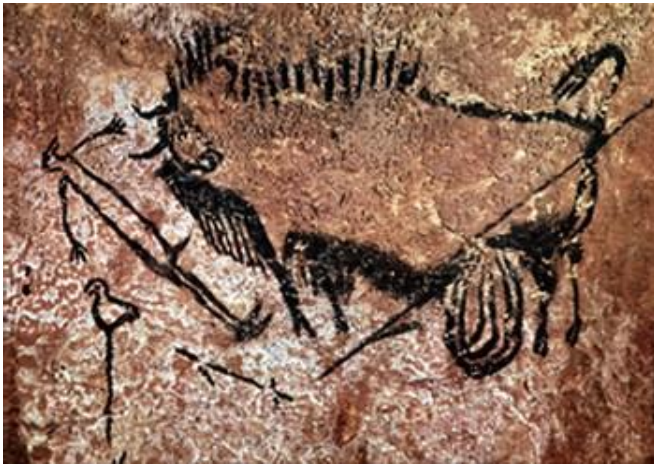
Jedna z mála scén, která zahrnuje i člověka.