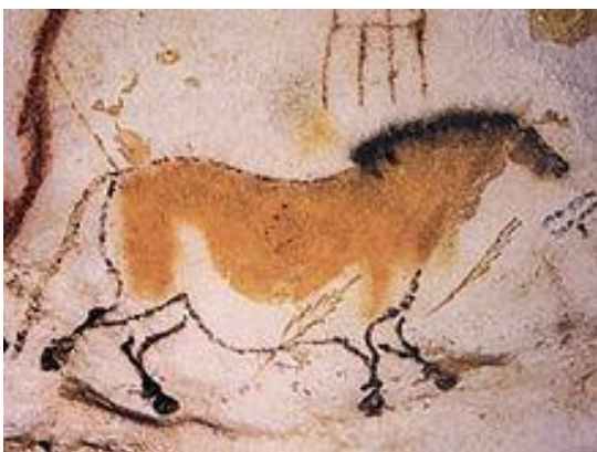
Jeskynní malba koně.