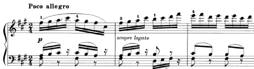
Obrázek 43 - Poco allegro č. 40

Nejrychlejší skladbou sbírky je Poco allegro č. 40 s šestnáctinovými pasážemi s dvouhlasou technikou připomínající Bachovy dvouhlasé invence. Střední díl je v paralelní tónině A dur. Hlavní téma se navrácí v téměř nezměněné podobě a závěr skladby je zakončen melodií, kterou si přebírají ruce mezi sebou. Z hlediska harmonie Franck zůstává dlouho v jedné tónině a příliš často nemoduluje. Poco allegro je z této trojice i z celého výběru nejvirtuóznější skladbou.