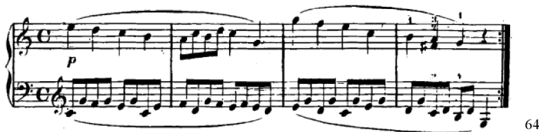
Obrázek 29 - R. Schumann, Album pro mládež, Melodie č. 1

Ve Franckových skladbách nalezneme mnoho paralel k ostatním skladatelům či obdobím. V podkapitole o skladbách s varhanní sazbou převažoval Bachův vliv na Francka. V následujících skladbách spatřujeme vliv Roberta Schumanna 62 . Inspirace Schumannovými skladbami je zřejmá výhradně v Andantinu quasi allegretto č. 5 a Air from Bearn (II) č. 37 . U skladby č. 5 doprovod připomíná figurativní doprovod na způsob, který nalezneme u Roberta Schumanna 63 v první skladbě Melodie v Albu pro mládež . Stejný doprovod se vyskytuje i ve Franckově skladbě Nářek panenky , kdy figurativní spodní linka má melodickou úlohu a k prvnímu hlasu vzniká protihlas.