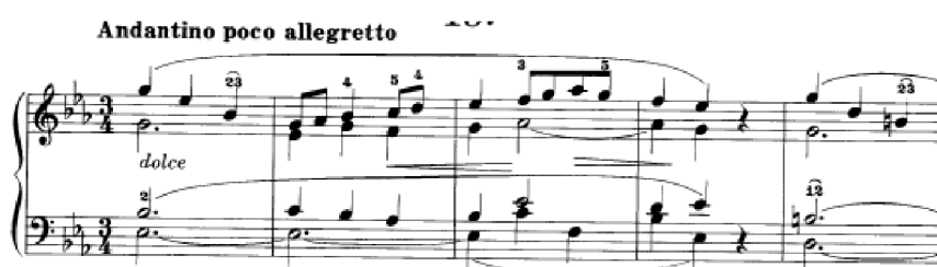
Obrázek 36 - Andantino poco allegretto č. 15

Andantino poco allegretto č. 15 je kantabilní tříhlasá skladba v tónině Es dur. Rytmus je zde jednoduchý. Doprovod má díky ligaturám varhanní strukturu. Franck zde pracuje s tématy, která následně obměňuje. Často využívá chromatiku. Skladba je rozdělena po čtyřtaktích a z Es dur moduluje do G dur, g moll, c moll a končí jednoduše průtahem z dominanty do toniky.