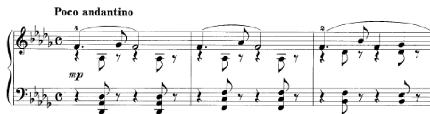
Obrázek 34 - Poco allegretto č. 26

Poco andantino č. 26 má velmi krásnou melodii. Skladba začíná Des dur (T), f moll (III.), b moll (VI) a es moll (II). Tečkovaný rytmus hlavní melodie se v průběhu skladby často objevuje. Part levé ruky doprovází melodii v akordech či dvojhmatech. V první části na konci čtyřtaktí tvoří levá ruka dvojhlas s pravou rukou. Ve střední části je harmonie opět komplikovanější, Franck využívá chromatiku a zmenšené akordy. Stále ale zachovává melodii s tečkovaným rytmem. Doprovod se mění ve dvojhmaty nebo vytváří s pravou rukou dvojhlas. Následuje krátká mezihra a navrácí se hlavní téma, ve kterém jsou přidány střídavé tóny. V celé skladbě musíme volit různé typy úhozu a dynamiky. Hlavní melodii bychom měli hrát znělejším, sytým tónem, kdežto pro doprovodné hlasy bychom měli zvolit spíše jemnější dynamiku.