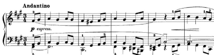
Obrázek 21 - Air from Bearn (I) č. 36

Název skladby Air from Bearn (I) č. 36 přibližuje, ve kterých místech se skladatel inspiroval 60 . Tento Air v tónině fis moll je klidná polyfonní skladba s výraznou melodií s označením tempa Andantino . Vzdálenost hlasů v levé ruce vytváří zvláštní atmosféru. Spodní hlas by mohl varhaník hrát pravděpodobně na pedál. Klavírista se může rozhodnout, zda bude preferovat dynamické zvýraznění vrchního hlasu nebo spodním hlasům dá temnější doprovod. V momentě, kdy dá znělejší dynamiku basovým tónům, zanikne hlas v pravé ruce. Tento úvod má posmutnělou náladu. Nejen harmonizací, ale hlavně změnou poloh – ruce ve větší vzdálenosti od sebe, obě ruce v nízké poloze, obě ruce ve vysoké poloze – proměňují charakter hudby. V místě, kde jsou obě ruce ve vyšší poloze, je nálada oproti pochmurnému úvodu zasněná až kouzelná. Rytmický obrys se zde ostinátně opakuje. Konec Franck ozvláštňuje triolami a rytmem 2:3.