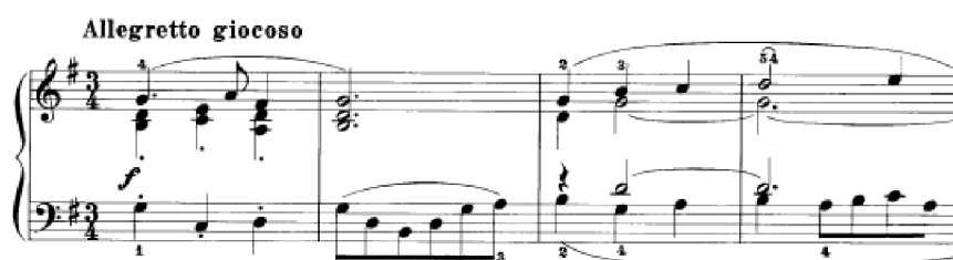
Obrázek 48 - Christmas Carol from Anjou (I) č. 44

Christmas Carol from Anjou (I) č. 44 má tempové označení Allegretto giocoso a je v tónině G dur. Pod melodií se střídá doprovod v různých úhozech a sazbě. Některé úseky mají sborovou sazbu. Koleda není harmonicky komplikovaná – obsahuje základní harmonické funkce. Často se opakuje střídání toniky s dominantou, harmonii obohatí ale i alterované a zmenšené akordy. Franck moduluje i do stejnojmenné mollové tóniny g moll, ale skladba je zakončena s veselým charakterem v tónině G. Koleda svou třídobostí a menuetovým charakterem připomíná skladbu č. 27. Žák může skladbu cvičit po hlasech a jejich kombinacemi.