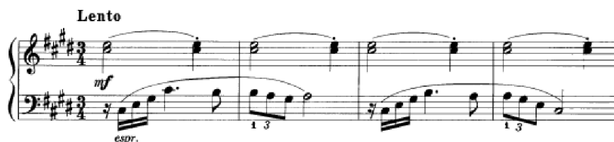
Obrázek 40 - Lento č. 42

Charakter skladby Lento č. 42 v tónině cis moll se v jejím průběhu mění. Začíná smutně v hlavní tónině, následně moduluje do paralelní tóniny E dur. Hlavní téma v levé ruce bychom měli interpretovat s jistou charakterovou závažností. V této části se její dynamika zesiluje na mf . Tato část je zároveň vrcholem skladby. Můžeme ji rozdělit do tří pásem, ve kterých bude třeba zvolit minimálně dva druhy dynamiky. Vrchní pásmo v pravé ruce lze hrát jako jemný doprovod, pro druhé pásmo lze zvolit tišší dynamiku a pro levou ruku forte s pocitem důležitosti. Žák by si měl zahrát jednotlivá pásma zvlášť a následně jejich kombinace. Po této části se dostáváme do závěru, kde se střídá Cis dur a Gis dur a ke konci závěru postupně část