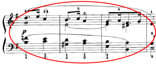
Obrázek 17 - sled mimotonálních dominant

Závěr skladby volí skladatel v tónině C dur, která se vždy na konci taktu přemění do zmenšeného akordu. Následné opakování taktu zní až prosebně a skladba je zakončena v e moll s označením poco rallentando . Pod touto skladbou také lze hledat náboženskou tematiku. V díle L'organiste je tato skladba v es moll a Denes Agay ji pro mladší klavíristy transponoval do interpretačně snadnější tóniny.