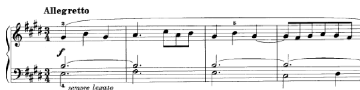
Obrázek 37 - Allegretto č. 24

Allegretto č. 24 začíná základními harmonickými funkcemi – E dur (T) a H dur (D) a následně se téma opakuje s doprovodem obohaceným o melodické tóny. V dalším průběhu