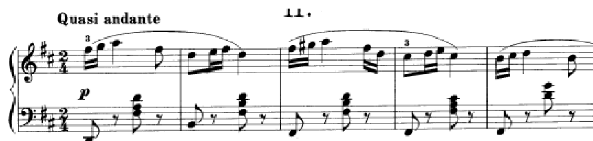
Obrázek 26 - Quasi andante č. 11

Quasi andante č. 11 je v tónině D dur. Ostinátní basové fis vytváří zajímavou harmonii. Motiv v šestnáctinových hodnotách je pomocí chromatiky neustále obměňován, zatímco levá ruka zastává typický příznávkový klavírní doprovod, taktéž doplněný o chromatické postupy. V závěru se v tempu vrací do hlavní tóniny a znovu připomíná úvodní motiv. Ovšem hned druhý takt překvapí alterovaným akordem s korunou. Tato skladba je harmonicky a melodicky velmi pestrá, barevná až okouzlující.