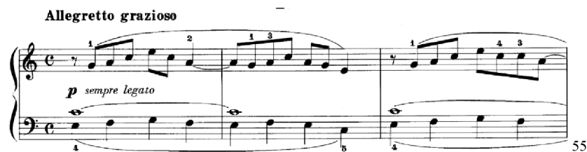
Obrázek 2 - Allegretto grazioso č. 1

První skladba Allegretto grazioso č. 1 je ve varhanním stylu s kantabilní melodií. V průběhu skladby se pomocí terciové příbuznosti dostáváme do paralelní tóniny a moll aiolské . V úvodu a v závěru skladby se Franck vyhýbá citlivému tónu. První osmitaktová část se skládá z dvoutaktových frází, které uvádí hlavní téma, vždy v obměně. To by mohlo být při prvním čtení komplikací. Jako základní doporučení pro nácvik je tedy při prvním pročtení textu důkladná intervalová analýza analogogických motivů. Zatímco se pravá ruka obměňuje, doprovod levé ruky se ve čtvrtových hodnotách ostinálně opakuje. Druhá část začíná v paralelní mollové tónině a moll a tempo , opět v rámci osmi taktů, které Franck i ve střední a závěrečné části. Následný průběh začíná septakordem a dvě dvoutaktí jsou zakončena korunou, jako by se zde Franck zastavoval, zamýšlel. Dva takty před návratem hlavního tématu se poprvé objeví tříhlasá faktura. Doposud byl pouze dvojhlas s prodlevovým tónem. Závěrečné hlavní téma v pravé ruce se obohatilo o další hlas, který se v úvodu nacházel v levé ruce. První čtyři takty jsou harmonicky totožné, drobné změny nastávají až v samotném závěru skladby. Skladba působí velmi průzračně a kantabilně, ovšem problém by mohl nastat v místech, kde se kombinují držené tóny, vícehlas a nástup na lehké době. Skladba má více pásem. Je vhodné jednotlivé hlasy zahrát zvlášť nebo může učitel hrát doprovod, žák melodii a naopak.