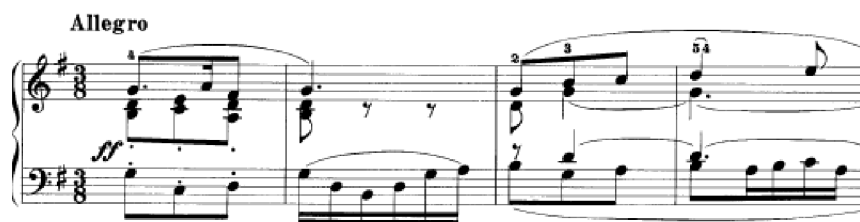
Obrázek 24 - Postlude č. 46