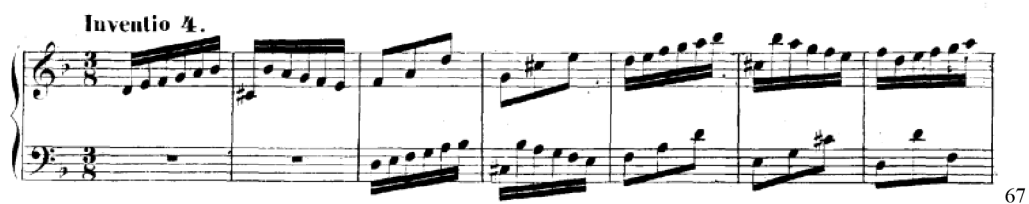
Obrázek 44 – J. S. Bach, Invence d moll č. 4