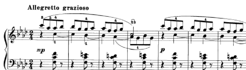
Obrázek 35 - Andantino poco allegretto č. 32

Allegretto grazioso č. 32 v tónině f moll začíná v mp . Téma, které se prolíná celou skladbou, je utvořeno ze sekvencovitě postupujících motivů. Podruhé se opakuje v tišší dynamice. Následně hustota pohybu řídne a pomocí dvojhlasu se navrátíme znovu k hlavnímu tématu, které je tentokrát ve větším forte . Obměnu hlavní melodie přebírá i levá ruka, poté ji