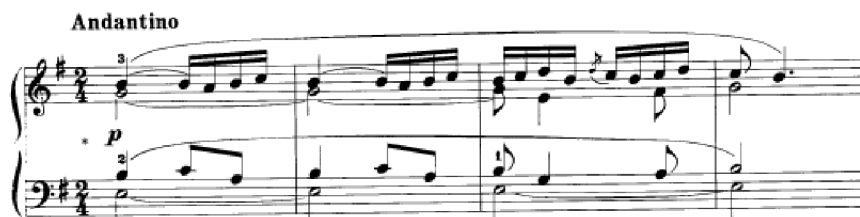
Obrázek 16 - Andantino č. 28

Andantino č. 28 e moll začíná smutným tématem, kde se střídá tónika se subdominantou, další fráze se opakuje, ale tentokrát se v paralelní tónině G dur střídá s druhým stupněm a moll. Následný průběh by se mohl nazvat rozhovorem mezi pravou a levou rukou, kde se mezi nimi melodie prolíná. To, co je v romantismu časté, ale v této sbírce se objevuje poprvé, je sled mimotonálních dominant. Na tomto příkladu bychom mohli žákovi tuto problematiku vysvětlit.