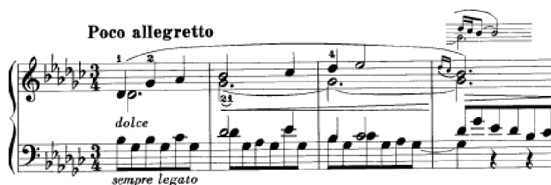
Obrázek 30 - Poco allegretto č. 37

Podobný doprovod se objeví ve skladbě č. 37 Air from Béarn . Skladba je v tónině Ges dur. Je klidná a v tišší dynamice. Jednoduché téma je doprovázeno osminovými hodnotami, kdy na těžkých dobách společně tvoří líbezný dvojhlas. Téma se několikrát opakuje a dlouho se drží v hlavní tónině, na chvíli vybočí do tóniny es moll a ges moll a brzy se zase vrací do Ges dur. Harmonie je v této skladbě jednoduchá. V prvním taktu tóny utvářejí dvojhlas na hlavní době v levé ruce a v pravé ruce dvojhlas. Vrchní hlas respektuje rytmus pravé ruky a společně tak tvoří dvojhlas.