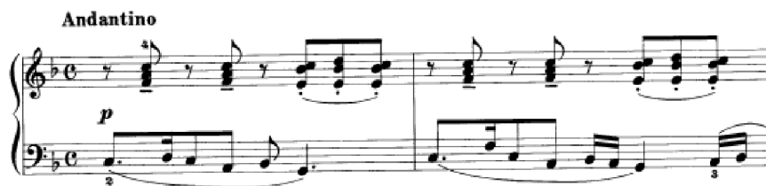
Obrázek 14 - Andantino č. 18

Andantino č. 18 má veselý charakter a hlavní melodie založená na tečkovaném rytmu je uvedena v partu levé ruky. V průběhu skladby se melodie přesouvá i do pravé ruky. Hlavní téma je v F dur, poté moduluje do As dur, Es dur, Des dur, mezihra je v f moll a poté se opět navrátí do hlavní tóniny. Doprovod pravé ruky začíná na lehkou dobu a rytmus se ostinátne opakuje. Poté se promění ve dvojhmaty obohacené o chromatiku. Rytmus této části je v průběhu skladby zachován. Skladba je z důvodu složitějšího rytmu, často synkopického, v kombinaci s chromatikou, náročná. Komplikací by pro žáka mohla být i závěrečná část, kde v partu levé ruky malíček drží prodlevové tóny, nad kterými zní stoupající šestnáctinové hodnoty. Tento druh techniky s dvojhmaty vyžaduje větší technickou zdatnost. Objeví se zde i oktávy a rozložený akord. Skladba je dvojhlasá, místy tříhlasá. Pro úvodní akordy bychom měli zvolit spíše měkčí úhoz. To samé platí v následující skladbě.