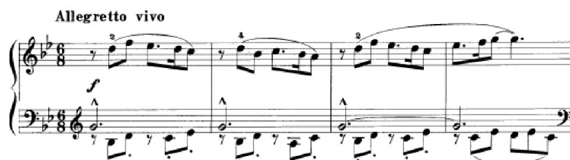
Obrázek 42 - Allegro vivo č. 38

Allegretto vivo č. 38 je skladba vhodná na procvičení samostatnosti rukou, kdy pravá ruka hraje legato a levá ruka staccato. Hlavní tónina je g moll. Franck opět často moduluje a harmonii obohacují i alterované akordy. Nachází se zde podobný princip, kdy zní melodie s doprovodným staccatem , se kterým jsme se setkali ve skladbě č. 6. Hlavní téma se zde několikrát objeví. Nejdřív ve forte , v pp , poté v Es dur nebo Ges dur. Závěr skladby končí codou. Zároveň poslouží k procvičení synkop. Klavírní faktura se během skladby mění.