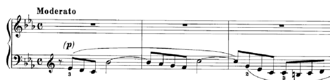
Obrázek 4 - Fugato č. 3

Další typ varhanní sazby s kontrapunktickou technikou je ve Fugatu č. 3 . V celé sbírce je tato hudební forma zastoupena pouze jednou. Tato skladba je částí delšího „Offertoria“ a je kombinací polyfonního a harmonického přístupu. Hlava tématu je převzata z předešlé