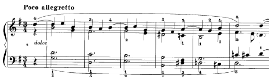
Obrázek 38 - Poco allegretto č. 29

Poco Allegretto č. 29 má veselou náladu s doporučením dolce . Základní harmonie se střídají a v melodii je chromatika, která leckdy zní až svůdně. Skladba je čtyřhlasá. Na první pohled vypadá skladba z hlediska množství posuvek komplikovaně, ale díky chromatice, která vždy vyústí do dalšího akordu, je hra pro ruce velmi pohodlná. I kdyby klavírista nepoužil pedál, dvojhmaty lze mezi sebou snadno provázat. Původně byla složena v tónině Ges dur. Editor této sbírky ji transponoval do G dur.