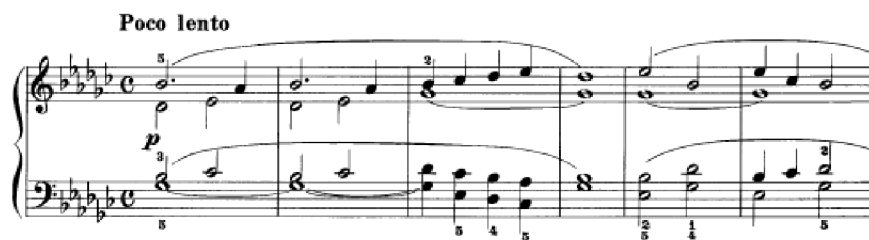
Obrázek 10 - Poco lento č. 13

Třináctá skladba Poco lento č. 13 je v tónině Ges dur. Je dělena do čtyřtaktí, kde je motiv vždy rozveden či obměněn. Oproti předešlé skladbě má pestrou harmonii. Franck v průběhu skladby zajímavě střídá mollový a durový III. stupeň. Objeví se ale i H 7 . Na závěr se netradičně střídá D a T, ale II. stupeň a T. Skladba má chorálovou sazbu složenou převážně z dvojhmatů. Z hlediska techniky skladba není náročná.