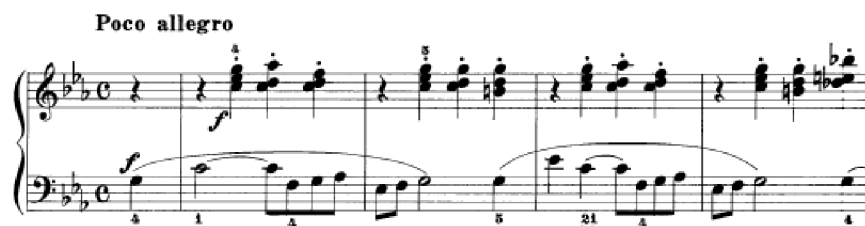
Obrázek 15 - Poco allegro č. 34

Příbuznou skladbou je Poco allegro č. 34, která má taktéž hlavní melodii v partu levé ruky a střídavé akordy ve staccatu , ale v jiných rytmických hodnotách. Počátek skladby je tedy podobný, další průběh se liší. Předchozí Andantino č. 18 je technicky náročnější než Poco allegro č. 34, jelikož obsahuje více dvojhmatů s komplikovanou melodií v kombinaci