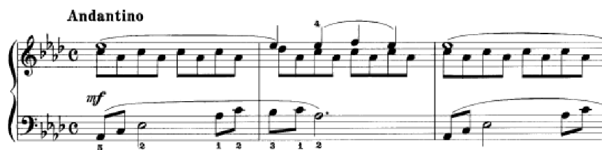
Obrázek 31 - Andantino č. 39

Skladba Andantino č. 39 je v tónině As dur. Je zde očividná Franckova záliba v chromatických postupech, ligaturách a častých harmonických změnách. Nachází se zde alterované akordy a sekvence, obzvláště ve středním díle. Hlavní téma se navrácí v hlavní tónině v nezměněné podobě. Liší se pouze závěr. Ve skladbě můžeme nalézt sekvenční techniku. Z hlediska interpretace musí být střední hlas osminových hodnot v tiché dynamice. Naopak krajní hlasy si vyžadují silnější dynamiku. Žák by si mohl zahrát krajní melodie bez středního hlasu, který je v podobě prodlevového tónu či osminového ostinátního doprovodu. Závěr skladby má polyfonní charakter.