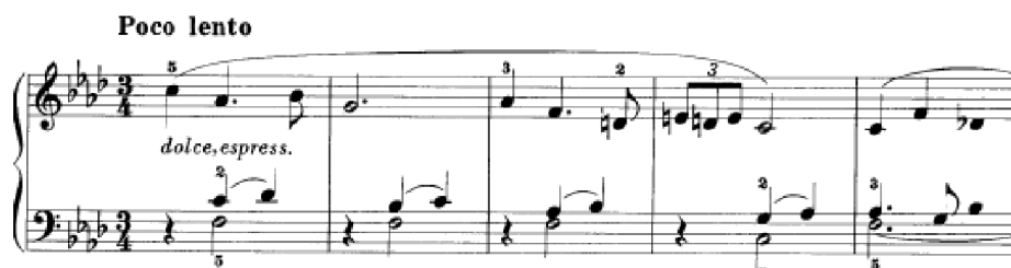
Obrázek 20 - Poco lento č. 35

Poco lento č. 35 je v tónině f moll a skladatel ji doporučil hrát dolce, espressivo . Celá skladba je v tišší dynamice. Tóny se v partu levé ruky do sebe různě přelévají a harmonicky se díky ligaturám doplňují. Hlavní melodii hraje pravá ruka, ale v průběhu skladby jí levá odpovídá a doplňuje. Skladatel zůstává v f moll, nemoduluje do jiných tónin. Jelikož v sedmém taktu začíná čtyřhlas, můžeme žákovi skladbu připodobnit ke smyčcovému kvartetu. Každý hlas má svůj nástroj – první housle, druhé housle, viola, violoncello. Díky zápisu levé ruky dochází ke kombinaci melodicko-harmonického přístupu.