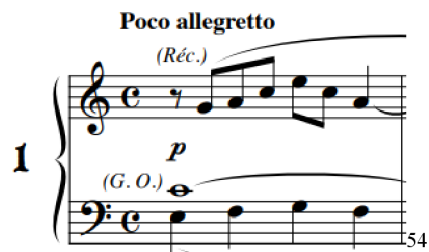
Obrázek 1 - Montréal: Les Éditions Outremontaises, 2009

Suggestions : Récit : Hautbois G. O. : Flûte ou Bourdon Péd. : Bourdon 16'