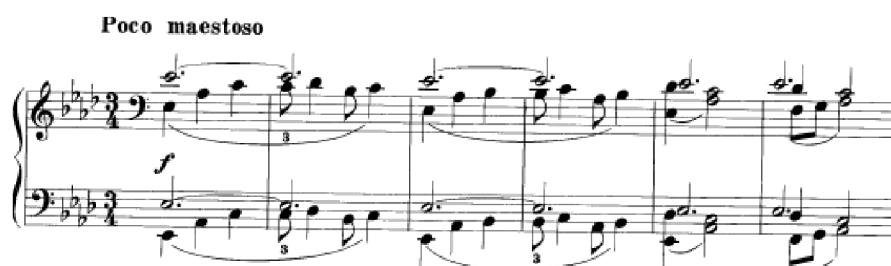
Obrázek 23 - Poco maestoso č. 43

Poco Maestoso č. 43 začíná majestátně rozloženým akordem As dur v oktávách ve forte v unisonu a střídá se s dominantou v různých obměnách. Skladba vyžaduje větší rozpětí ruky. Mladý pianista musí držet v obou rukách oktávy a zároveň vyhrávat další tóny. Následuje část v pp v dominantní tónině (Es dur). Opět se zopakuje hlavní téma v Es dur a moduluje přes ces moll do C dur. Z napínavých sekvencí zmenšených akordů se navrací do tóniny As dur. Skladba je harmonicky velmi pestrá a dynamicky kontrastní – střídá f a pp . Skladba je polyfonní s ligaturami.