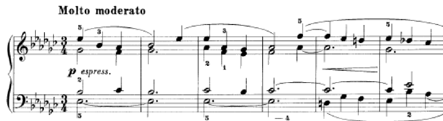
Obrázek 18 - Molto moderato č. 31

Počáteční čtyřhlas skladby Molto moderato č. 31 zní smutně. Je v tónině es moll v tiché dynamice s doporučeným výrazem espressivo . Následuje recitativní sólo levé ruky, které zní zprvu žalostně, a s příchodem zmenšeného akordu vzdorovitě. Hlavní téma se dále objeví v tónině b moll. Střídají se zde sborové části s recitativy levé ruky v sekvencovitém postupu. Když se recitativ objeví podruhé, pravá ruka jej doprovází akordem s průtahem. U sborových částí by měl žák proposlouchat všechny harmonie, které se díky ligaturám pomalu a postupně proměňují. Vrchol skladby je v její finální části – dva takty crescendo , jeden takt f a následuje rychlá změna dynamiky do pp .