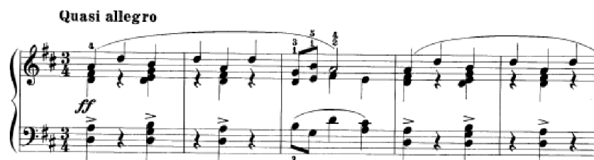
Obrázek 32 - Quasi lento č. 9

Třídobá skladba Quasi allegro č. 9 v tónině D dur má převážně akordickou sazbu s kantabilní melodií. Místy se objeví polyfonie, zároveň se sazba často mění – akordy, dvojhmaty, osminové hodnoty. V hlavním tématu se objevují hemioly 65 . V další části se hlasy často střídají a dochází tak k rozhovoru, kdy hraje takt pravá a další takt hraje levá ruka.