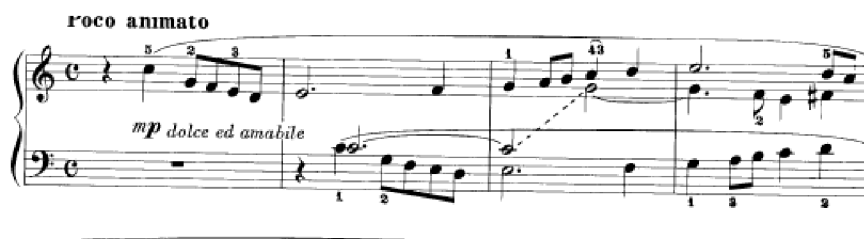
Obrázek 13 - Canon č. 17

Ojedinělým typem skladby této sbírky je sedmnáctá skladba Canon č. 17 . „ Tento Kánon je v díle „L’Organiste“ ve dvou tóninách, E a C dur, je součástí delšího Offertoria “ 59 . Tónina C dur dává skladbě veselou náladu – dolce ed amabile – s tempovým označením Poco animato . Skladba je polyfonní. Kánonicky mezi sebou hovoří první a třetí hlas a tento dvojhlas je doplněn o další hlas, který se nachází ve středním pásmu. Na poslední době osmého taktu začíná druhé téma, které je zpracováno stejně – první a třetí hlas jsou kánonické a jsou doplněny o prodlevy – uprostřed. Po středním díle se mírně téma pozmění (forma aba‘). Kánon má tedy dvě výrazná témata. Harmonie je oproti jiným skladbám, kde Franck často moduluje, jednodušší. První téma je v C dur. V dílu b přichází jiné téma a nový tónorod (d dórská). Volbou církevního módu Kánon připomíná starý typ ricercaru .