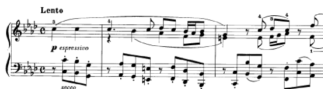
Obrázek 5 - Lento č. 6

Jiným zástupcem polyfonie je v pořadí šestá skladba Lento č. 6 s doprovodnými oktávami secco . Polyfonní sazba převažuje v pravé ruce, která má po celou skladbu dvojhmaty s průchodnými tóny a ligaturami. Podobný způsob se objevil v první skladbě (návrat hlavního tématu). Doprovod je převážně tvořen oktávami, jen ve dvou místech se sazba mění a kopíruje part pravé ruky. V partu pravé ruky musíme aktivně hrát legato a spojovat pečlivě jednotlivé tóny a dvojhmaty, to může být pro některé klavíristy technicky náročné. Pokud to není fyzicky možné provést, musíme spojovat alespoň svojí představou. Až v osmém taktu, kdy mají obě ruce stejnou fakturu a tvoří čtyřhlas, je vhodné použít pedál. Tato část je opět připomenuta v závěru skladby. Franck zde bohatě využívá chromatiky, především v doprovodných oktávách levé ruky, které často nastupují na lehkou dobu. Důležité je dodržovat i artikulaci oktáv – samotné staccato , kombinace staccata s legatem . Žák může skladbu cvičit po hlasech například pouze doprovod s hlavní melodií. Podobný způsob doprovodu ve staccatu se zpěvnou melodií