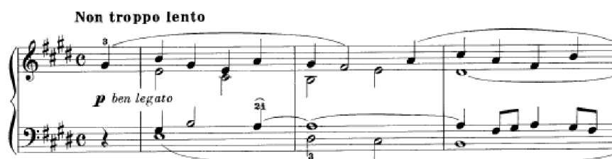
Obrázek 12 - Non troppo lento č. 25

Chorální stylizace se objeví ve skladbě Non troppo lento č. 25. Part pravé ruky má spíše polyfonní sazbu. Tato skladba v tónině E dur je čtyřhlasá. Ze začátku má veselý charakter, ovšem v průběhu skladby se nálada mění a harmonie se opět komplikuje. Objeví se zde akordy s přidanou sextou či septakord fis zmenšeně malý. Po komplikovaném středu, jehož sazba je ve dvojhmatech s častými průchodnými tóny, přichází znovu hlavní téma, které je téměř stejné a pokračuje v E dur. Následuje malebný dvojhlas, který je následně rozdělen mezi obě ruce do tercií.