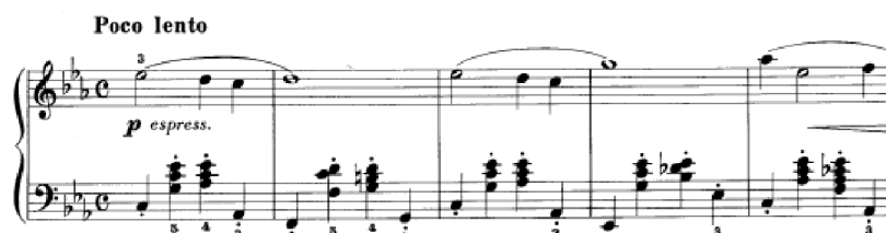
Obrázek 27 - Poco lento č. 14

Poco lento č. 14 je v tónině c moll a má zamilovanou až zasněnou náladu. Melodie je zpěvná s příznávkovým doprovodem. Zajímavost skladbě dodává častější výskyt alterovaných a zmenšeně malých akordů. Jednoduchý rytmus by žákům neměl dělat problém, ale časté změny v harmonii by mohly být komplikací. Melodie začíná v půlových a čtvrtěových hodnotách, postupně se přidává tečkovaný rytmus, osminy a závěr vygraduje do dvoutaktového pasážového běhu v osminových hodnotách. I přes harmonickou barevnost Franck ukončí tuto skladbu jednoduchým průtahem z dominantního septakordu do tóniky.