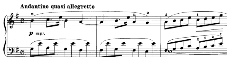
Obrázek 28 - Andantino quasi allegretto č. 5

Ve Franckových skladbách nalezneme mnoho paralel k ostatním skladatelům či obdobím. V podkapitole o skladbách s varhanní sazbou převažoval Bachův vliv na Francka. V následujících skladbách spatřujeme vliv Roberta Schumanna 62 . Inspirace Schumannovými skladbami je zřejmá výhradně v Andantinu quasi allegretto č. 5 a Air from Bearn (II) č. 37 . U skladby č. 5 doprovod připomíná figurativní doprovod na způsob, který nalezneme u Roberta Schumanna 63 v první skladbě Melodie v Albu pro mládež . Stejný doprovod se vyskytuje i ve Franckově skladbě Nářek panenky , kdy figurativní spodní linka má melodickou úlohu a k prvnímu hlasu vzniká protihlas.