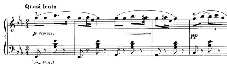
Obrázek 25 - Quasi lento č. 4

Quasi lento č. 4 je v tónině Es dur. Zpěvnost melodie s příznávkovým doprovodem nám může celkovou náladou připomenout typ nokturna. Přestože jsou v levé ruce občasné náznaky polyfonie, z dosavadních skladeb tuto strukturu nejvíce opouští. Téma se zde variačně obměňuje a ve čtvrtém taktu do ní Franck vložil zvětšenou kvartu, což zní po zasněném úvodu poněkud vážně. Před codou se objeví recitativ levé ruky, který také naznačuje něco vážného. Skladba je rytmicky pestrá. Objevují se zde trioly, tečkovaný rytmus, šestnáctinové hodnoty a ligatury. Dynamika se mění s každým čtyřtaktím. Nabízejí se zde dva způsoby, jak brát na začátku skladby pedál. Prvním způsobem lze vzít pedál na každou dobu. Druhým způsobem je brát pedál přes celý takt, což zní lépe a tuto variantu doporučuji. Skladba je průzračná s příznávkovým doprovodem melodicko-harmonickým založením a řadí se mezi jednodušší kusy.