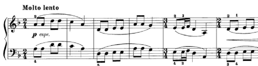
Obrázek 7 - Song from Creuse č. 10

Skladbou s dlouhou historií je Song from Creuse č. 10 – Píseň z Creuse . Podkladem je skutečný lidový popěvek. Už na první pohled je rytmicky zajímavý – střídá se dvoudobý takt s třídobým taktem. Hlavní téma je představeno v unisonu a v průběhu skladby se obměňuje a k jednohlasému zpěvu Franck přidává další hlasy. Převažuje zde varhanní přístup. Skladba je v tónině d moll a v počátku skladby nepoznáme, o jakou d moll se jedná, až s příchodem tónů