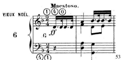
Obrázek 1 - Enoch in Paris – čísla

Největší skupinou zastoupenou v této edici jsou pochopitelně skladby s varhanní a polyfonní sazbou. Jednotlivé skladby mají mnoho společného, zejména prodlevové tóny. Basové nejspodnější tóny byly zamýšleny pro varhanní pedál. V první edici 51 jsou zapsány čísla pro manuály a pedál. V jiném vydání 52 jsou pokyny pro varhaníky přímo vypsány. Většina skladeb má více hlasů. Způsob nácvičku je tedy shodný – hra jednotlivých hlasů a jejich kombinací.