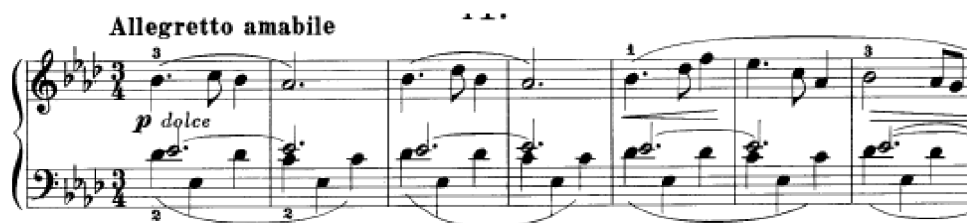
Obrázek 22 - Allegretto amabile č. 41