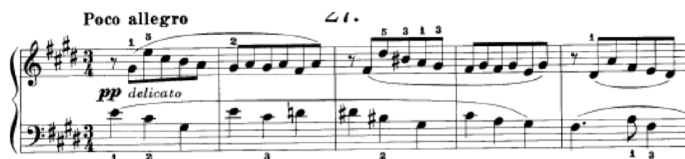
Obrázek 41 - Poco allegro č. 27

Skladba Poco allegro č. 27 je zaměřená na pasáže v osminových hodnotách se synkopickými nástupy v pravé ruce. Je na klavíristovi, jak bude jednotlivé motivy modelovat. Zda bude hrát všechny stejně důležitě, nebo v sudých taktech „melodičtěji“ zvýrazní tóny na dobách a tím pádem budou tvořit s levou rukou dvojhlas. Z interpretačního hlediska bychom mohli skladbu pojmout i jako rychlejší barokní menuet – třídobý takt, dvoutaktové členění. Barokní nádech přináší použití sekvencí a harmonie svou komplikovaností udává závažnou atmosféru. V barokním menuetu bychom volili kratší artikulaci, kdežto zde je požadavek neustálého legata.