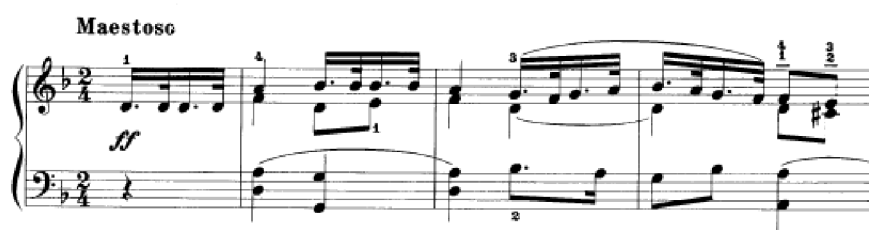
Obrázek 45 - Maestoso č. 19

Maestoso. 19 zahajuje trojici ve fortissimo . Už po prvních taktech zní jako pochod, což je u vánoční skladby zvláštní. Tečkovaný rytmus, který je prezentován v předtaktí, se v průběhu skladby ostinálně opakuje. Hlavní téma se prostřídává v různých tóninách. Hlavní melodie je uvedena v pravé ruce, je prezentována ale i v partu levé ruky. Doprovod je často tvořen oktávami. Dále se part levé ruky promění v doprovodný jednohlas či dvojhlas. Faktura vyžaduje větší rozpětí rukou. Skladba je tříhlasá s polyfonními prvky. Vícehlas lze opět rozdělit a hrát po hlasech. Tečkovaný rytmus je možno procvičit vytleskáváním rytmu – učitel jeden part, žák druhý a naopak.