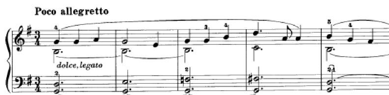
Obrázek 19 - Poco allegretto č. 33

Poco allegretto č. 33 je v tónině G dur. Charakter skladby je veselý s předepsaným dolce a legato . Dynamika je pestrá, v průběhu skladby se často mění z pp do piú f . Ke konci skladby má sólo levá ruka a pravá ruka má doprovodné akordy. Hlavní téma se navrácí a končí autentickým závěrem. Přestože se Franck pohybuje pouze v tóninách G dur, e moll a E dur, skladba zní díky mimotonálním dominantám a zmenšeným septakordům, kterými harmonizuje melodii, velmi barevně. Franck využil opět chromatických postupů k přechodu jednotlivých harmonií. Je zde nutné mít větší rozpětí ruky. Skladba není technicky náročná.