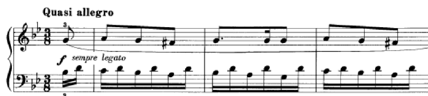
Obrázek 49 - Christmas Carol from Anjou (II) č. 45

Christmas Carol from Anjou (II) č. 45 je k předchozí skladbě kontrastní ve stejnojmenné tónině g moll. Jednohlasá melodie v pravé ruce zní nad doprovodnou figurací s ostinátním tónem D 1 . Pohyblivé melodické tóny v levé ruce v šestnáctinových hodnotách tvoří s hlavní melodií dvojhlas. Počátek skladby je harmonicky jednoduchý, střídá se tónika s dominantou a v místě, kdy začne skladatel modulovat do D dur, použije alterované akordy. Tuto část zakončí korunou. Dále pokračuje částí s označením Poco più lento a skladba se rozsvítí v tónině G dur s dvojhmatovou sazbou. Závěrečná část má pastorální charakter a s doporučením molto dolce e sostenuto . Podobnost můžeme opět najít u skladby Zimní čas II ( R. Schumann – Album pro mládež ), ve které mollový úvod rozjasní durová závěrečná část. Úvodní část si může žák zahrát bez ostinátního d jako dvojhlas.