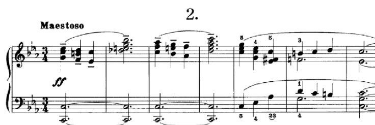
Obrázek 3 - Maestoso č. 2

Následující skladba Maestoso č. 2 je pomalá ve stejnojmenné mollové tónině c moll . Oproti předešlému tempovému označení Allegretto grazioso zde převažuje akordická sazba s polyfonními prvky. Sled akordů se s tragickým charakterem otvírá do zmenšeného septakordu. Franck přechází do paralelní Es dur a zachovává stejný sled harmonií, jako tomu bylo na začátku. Tato skladba žáka naučí porovnávat sled harmonií v různých částech skladby, jako tomu je například v Beethovenových sonátách nebo sonátách celkově, kdy se v repríze navrácí téma z expozice, ale v jiné tónině. Zmenšený septakord je zde vždy rozveden do subdominanty (dur/moll). Jelikož se ve skladbě vyskytují oktávy a čtyřhlasé akordy, měla by být skladba zadána žákovi, jehož ruka je na toto rozpětí připravena. Konec skladby je polyfonní, proto může být tato skladba přípravou k náročnějším polyfonním skladbám. Skladba je řazena mezi technicky méně náročné, avšak v průběhu skladby bude muset žák volit dynamické a úhozové varianty pro odlišení pásem.