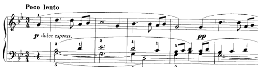
Obrázek 46 - Old Christmas Carol (II) č. 20

Druhá vánoční koleda Old Christmas Carol (II) č. 20 Poco lento je v tónině g moll. Skladba je oproti Maestosu v pomalejším tempu a v tišší dynamice. Náladu má pochmurnou a melancholickou. Franck v této skladbě neustále moduluje a využívá chromatiku. Dostává se do tóniny D dur a paralelní Es dur. Zajímavé je, že místo tradičních tónů akordu Es 7 , volí ES G B CIS. Používá zde i alterované akordy. V závěru skladby se navrácí hlavní téma a tempo se postupně zpomaluje a končí následujícím sledem akordů – alterovaný akord, dominanta, tónika.