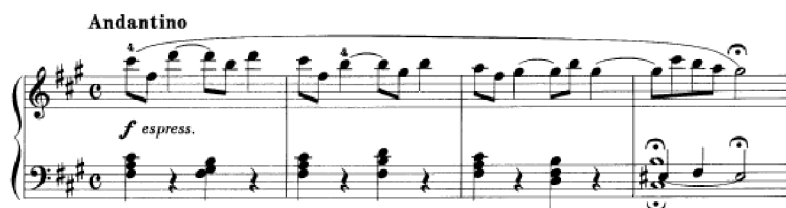
Obrázek 33 - Andantino č. 12

Jednohlasou melodii doprovází akordy ve skladbě Andantino č. 12 . Začíná střídáním tóniky (fīs moll) a subdominanty (h moll) a její nálada je díky dynamice ve forte a označení espressivo velmi vzdorovitá. Čtyřtaktí se beze změny zopakuje, tentokrát v pp , nálada se mění a stejné téma zní žalostně. Dále se objevují podobná témata, která se nejdřív představí ve forte a následně v piano v paralelní A dur. Opět zachovává harmonickou strukturu střídání tóniky a subdominanty. Doprovod je nejdříve v akordech, poté v sextách v půlových hodnotách. Následně se sexty v diminuci zopakují. Dalším způsobem doprovodu jsou dvojhmaty s ligaturovaným tónem, jednohlas s ligaturovaným tónem, a nakonec se střídající kvinty se sextami. Harmonie zde není komplikovaná a melodie je kantabilní. Při obměnách hlavního tématu využívá variační techniku. Dynamika se zpočátku mění po čtyřtaktích a postupně se délka zkracuje – čtyři takty f , čtyři takty pp , dva takty f , dva takty pp , jeden takt f , jeden takt. Andantino patří mezi snadnější skladby k interpretaci.