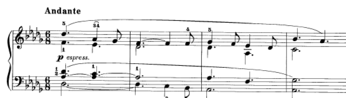
Obrázek 6 - Andante č. 8

Kombinací kantabilní skladby s varhanní sazbou je Andante č. 8 v tónině Des dur. V průběhu celé skladby se objevují průtahy, ligatury a chromatické průchody často směřují do další tóniny. Objeví se zde i klamný spoj (As 7 – b moll). V druhé části skladby se stejné motivy střídají v partu pravé i levé ruky a vzniká mezi nimi tak rozhovor. Objevují se čtyři hlasy a jsou zde opět hojně využity ligaturované tóny. Vznikající harmonie by měl žák pečlivě proposlouchat. To znamená, že hrajeme velmi pomalu a sledujeme vznik souzvuků s každou změnou jednotlivých hlasů. Vrchol skladby je ve střední části v tónině f moll.