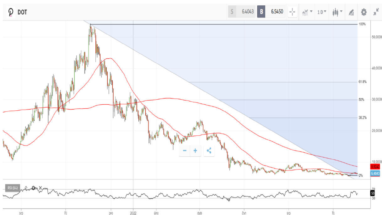
Obrázek 8 Graf ceny polkadotu – denní graf

Polkadot je brán jako více riziková kryptoměna, protože se stále ještě dostává do povědomí investorů, stejně jako je tomu u Cardana. Z tohoto důvodu je jeho volatilita také na vyšší úrovni, a to činí u potenciálního investora větší zájem o investici ale zároveň větší strach z možné ztráty.