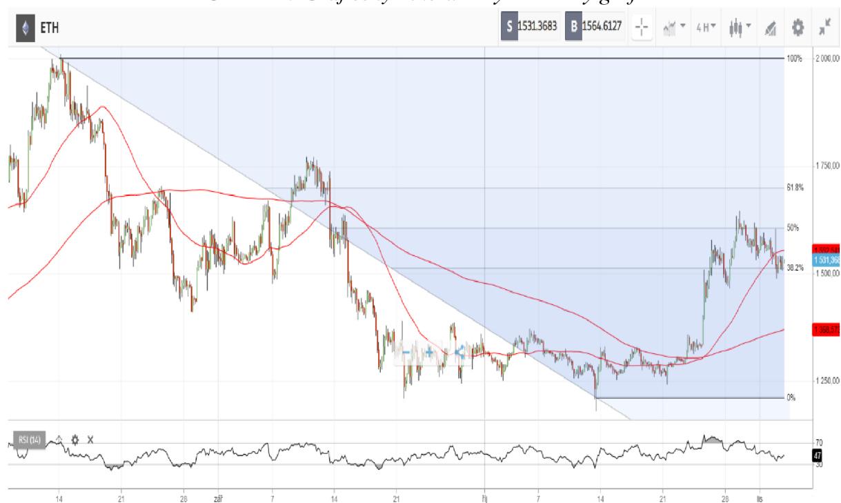
Obrázek 5 Graf ceny Etheru – čtyřhodinový graf