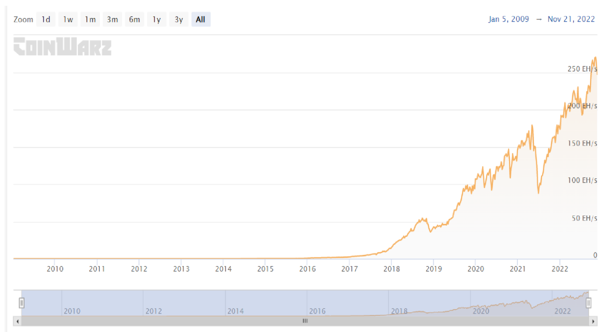
Obrázek 10 Vývoj těžebního výkonu Bitcoinu v grafu