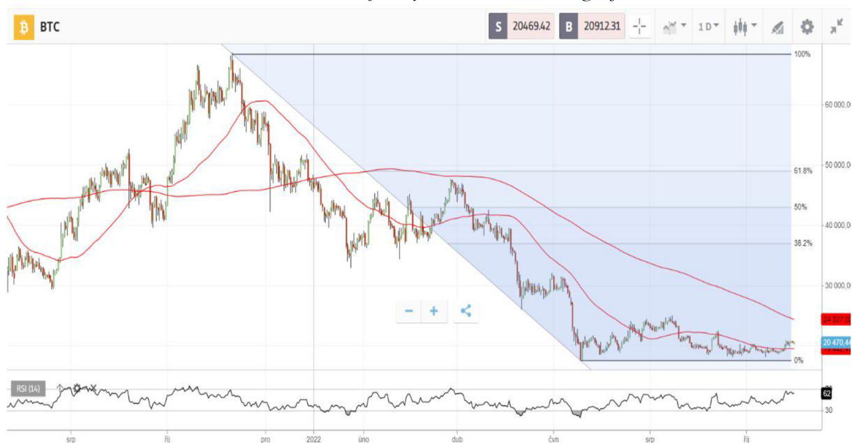
Obrázek 2 Graf ceny Bitcoinu – denní graf