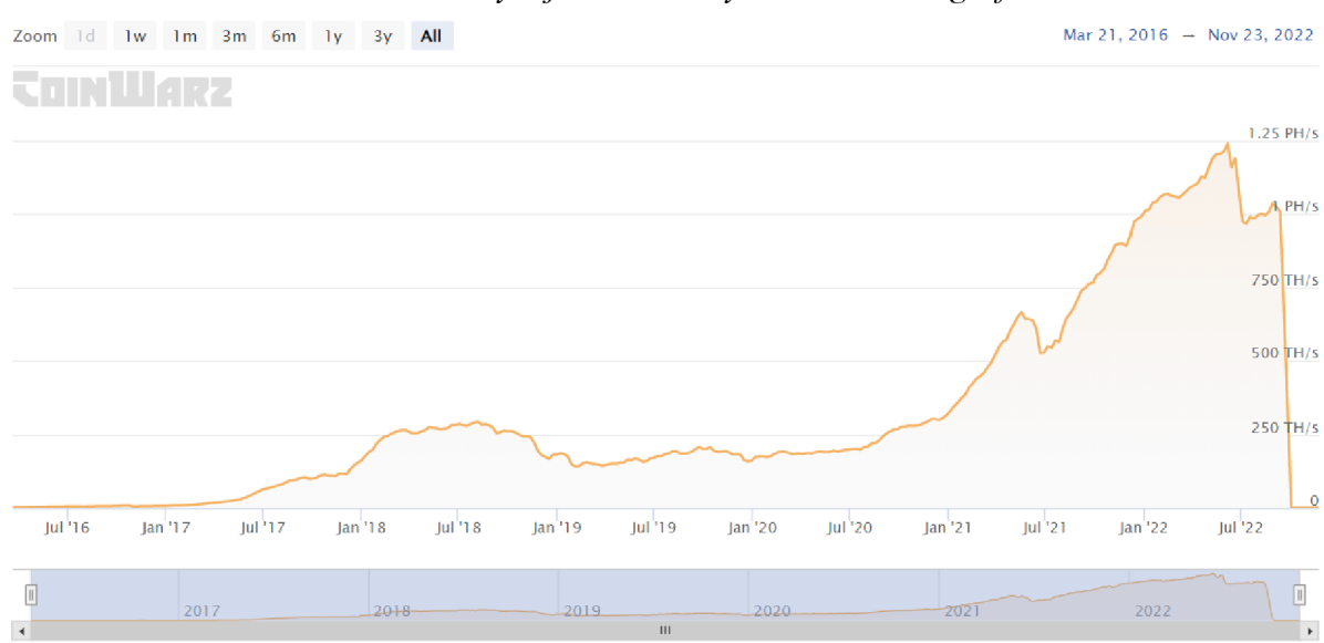
Obrázek 11 Vývoj těžebního výkonu Etheru v grafu

Po stránce výkonu celé sítě je hashrate na zlomku hodnoty z důvodu přechodu na Proof of stake systém.