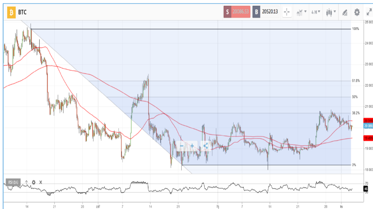
Obrázek 3 Graf ceny Bitcoinu – čtyřhodinový graf

60 bodů. Z toho lze usoudit že v případě překročení 70 bodů dojde k pře nakoupenému trhu. Může tedy nastat to, že cena po překročení klesne. Pokud však RSI bude nad 70 body a cena Bitcoinu poroste, tak to bude znamení silného býčího trhu.