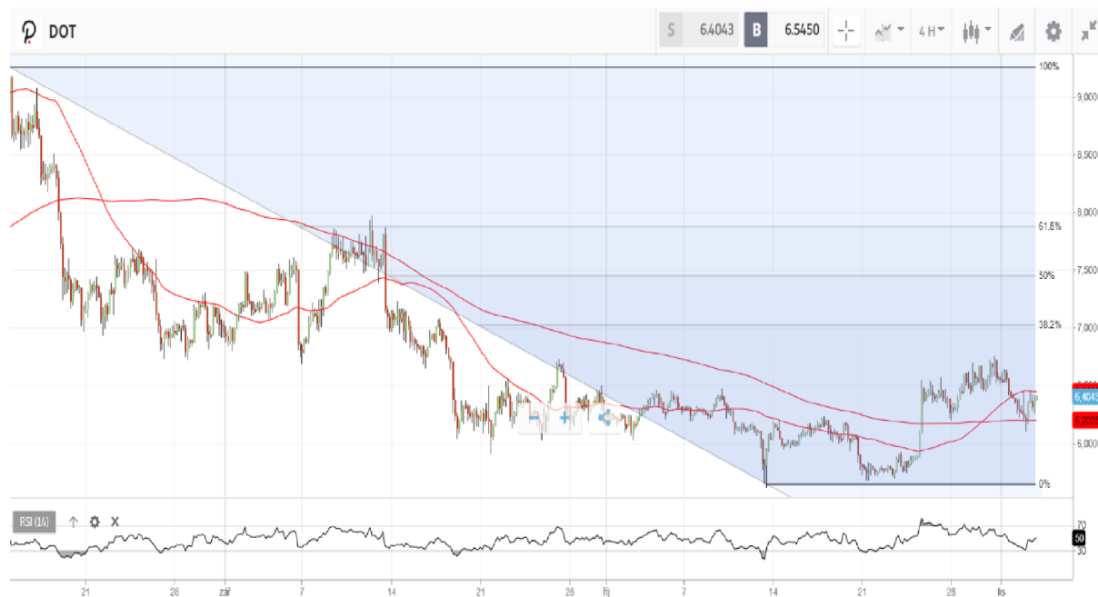
Obrázek 9 Graf ceny Polkadotu – čtyřhodinový graf

nevýznamný ukazatel, jelikož z důvodu volatility Polkadotu by nejbližší dlouhodobá resistance vznikla až v hodnotě 38,2 %, která byla dosažena v dubnu 2022.