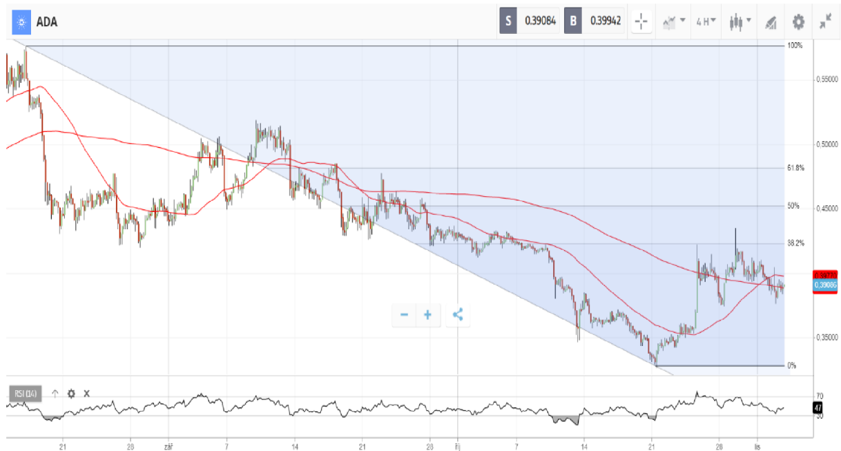
Obrázek 7 Graf ceny Cardana – čtyřhodinový graf