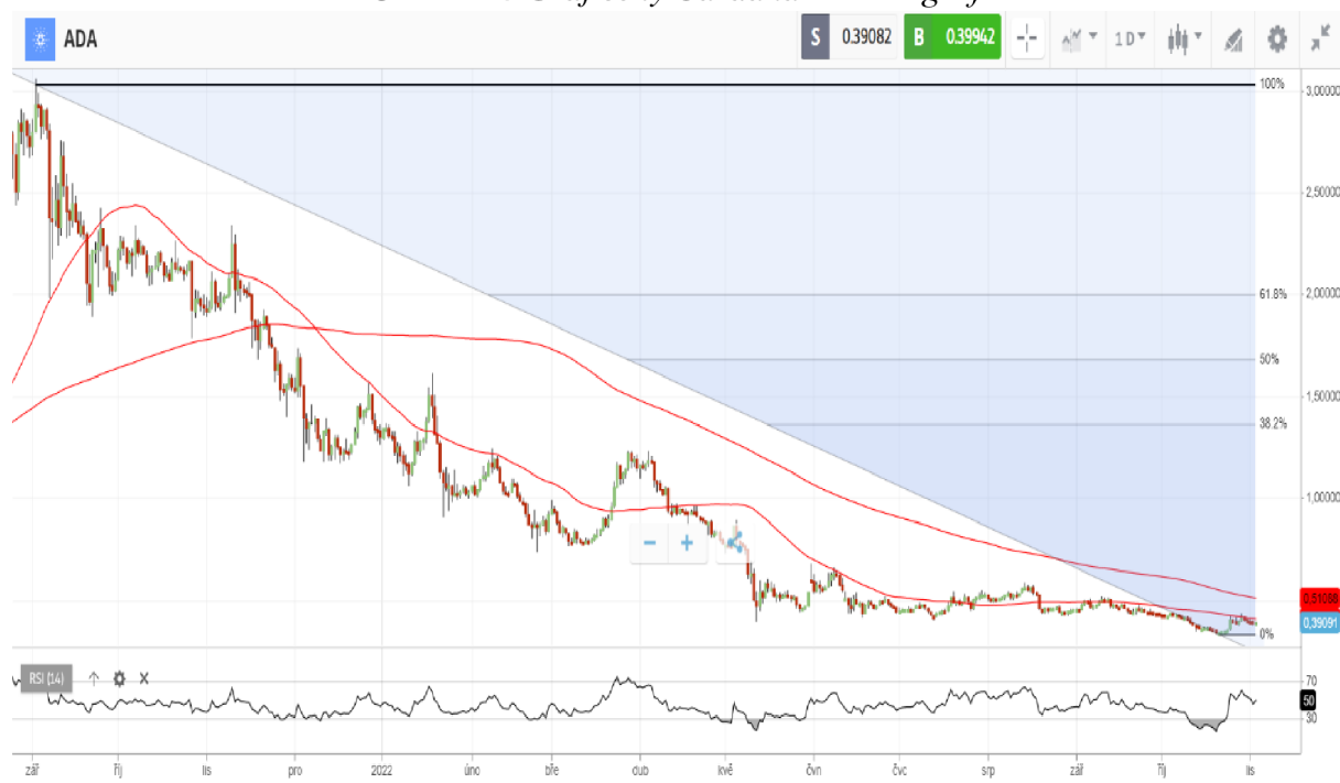
Obrázek 6 Graf ceny Cardana – denní graf