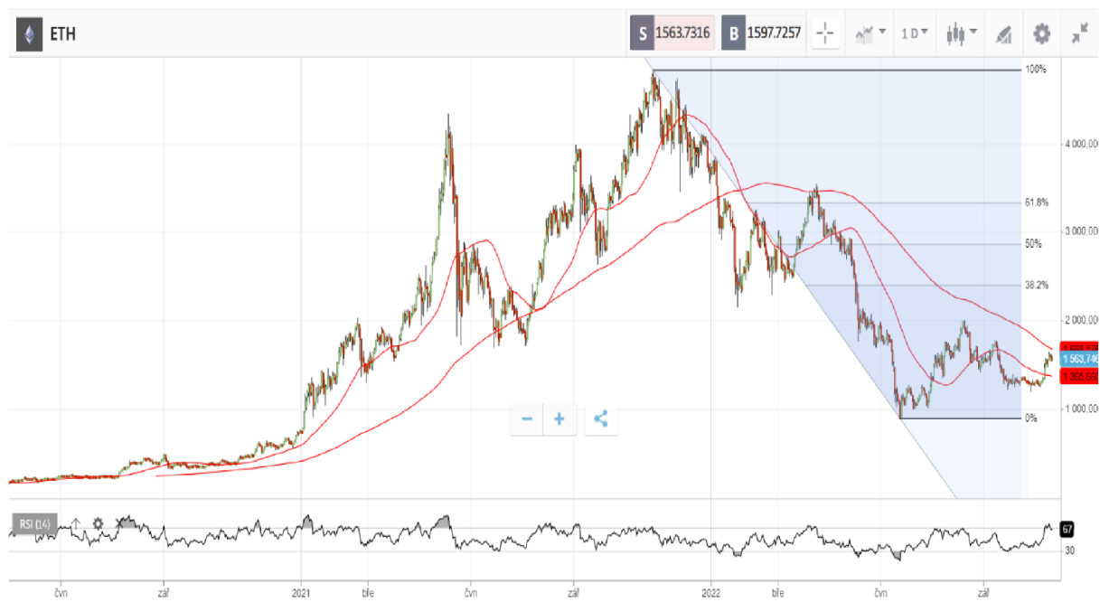
Obrázek 4 Graf ceny Etheru – denní graf