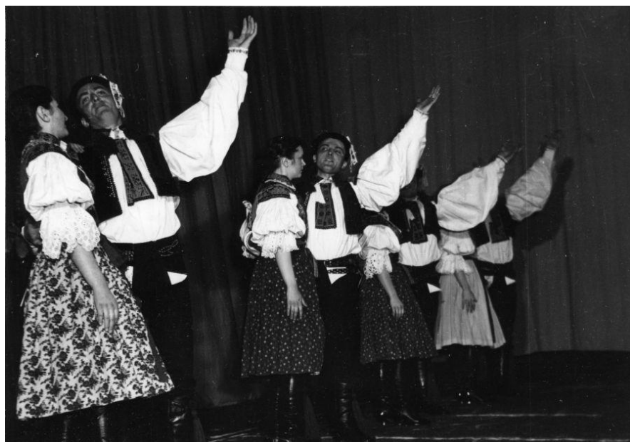
Příloha č. 10: Vystoupení souboru Hradišťan v roce 1963. Tanec Danaj . 410