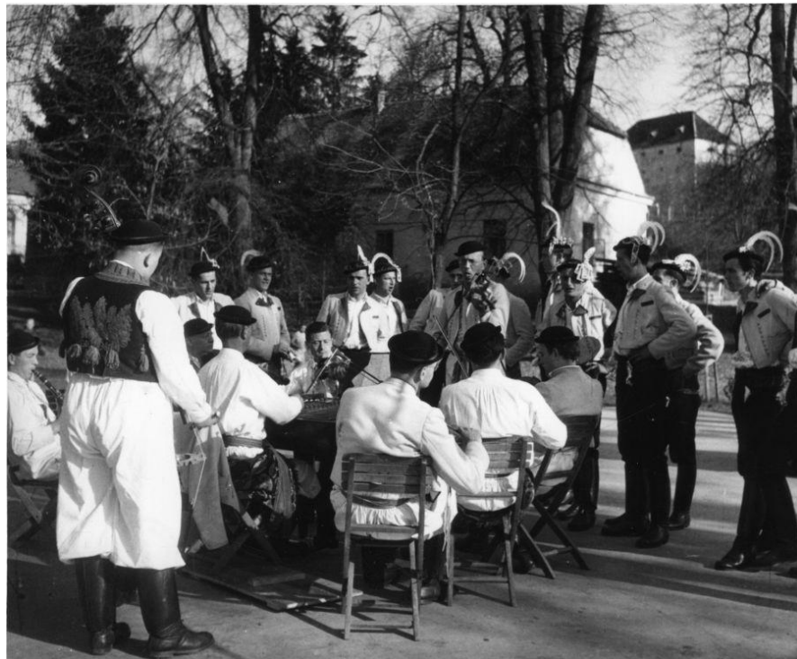
Příloha č. 4: Muzika a chasa souboru Hradišťan na Strážnických slavnostech kolem roku 1950. 404