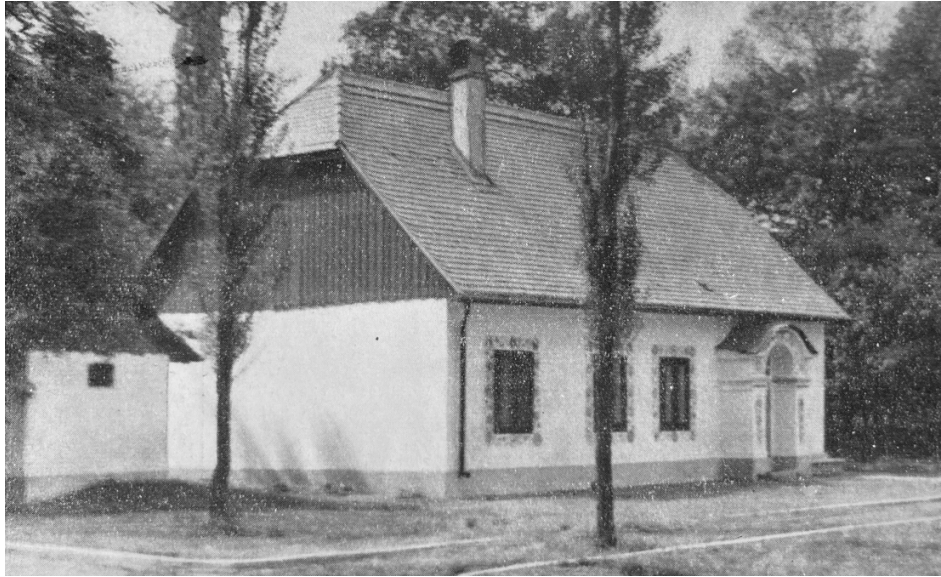
Příloha č. 3: Slovácká búda ve Smetanových sadech. 403