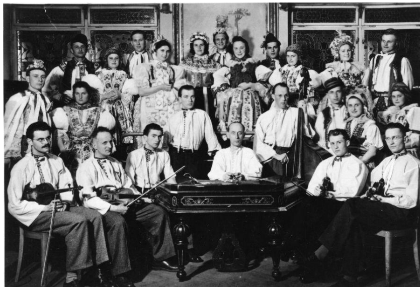
Příloha č. 2: Slovácký krúžek z Uherského Hradiště v roce 1944. 402