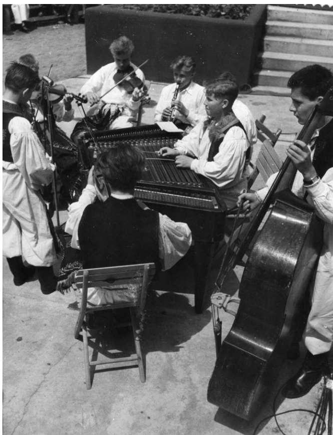
Příloha č. 9: Muzika dětského souboru Hradišťánek na Strážnických slavnostech v roce 1961. 409