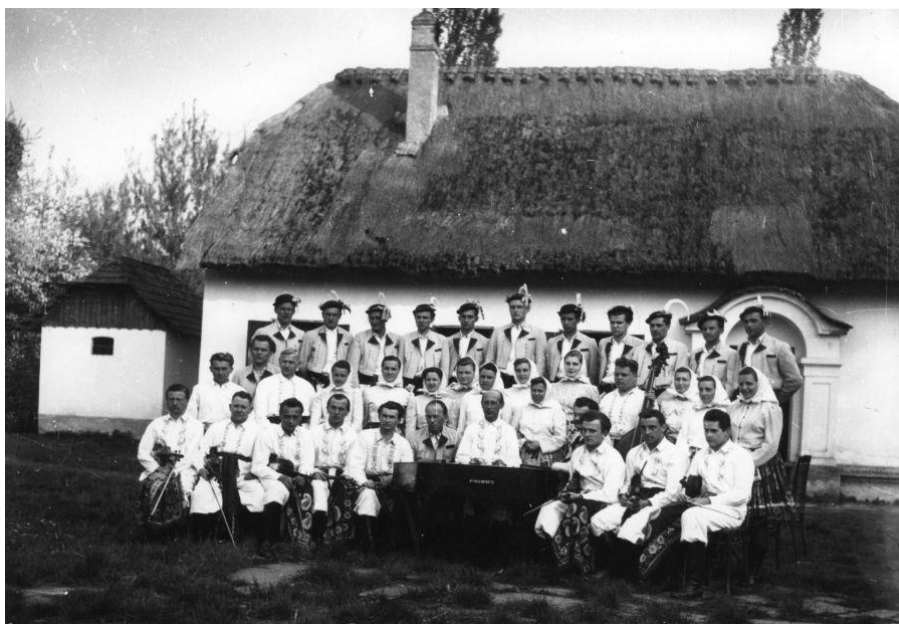
Příloha č. 7: Soubor Hradišťan v parku u Slovácké budy při společném fotografování v roce 1952. 407