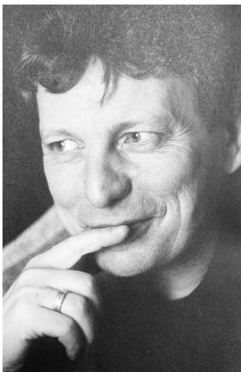
Příloha č. 22: Současný primáš a umělecký vedoucí Hradišťanu Jiří Pavlica. 422