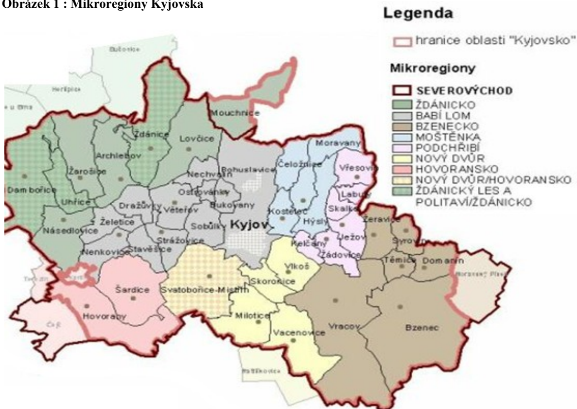
Obrázek 1 : Mikroregiony Kyjovska

Zdroj : MAS, Strategie MND 2010-2015. Kyjovské Slovácko v pohybu , 2009. s.13