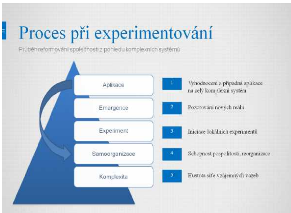
Obrázek 2. Proces při experimentování