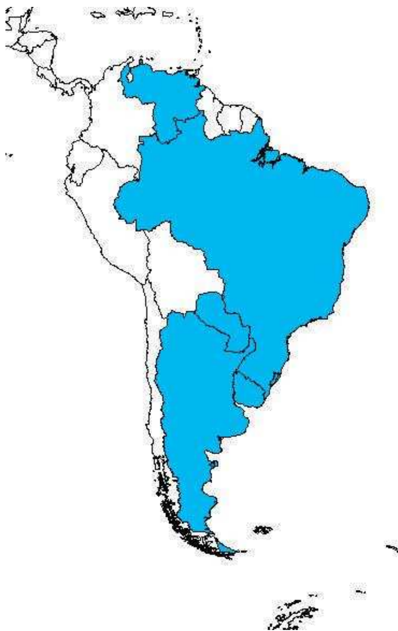
Obr. č. 7 Členské státy MERCOSURu k roku 2011