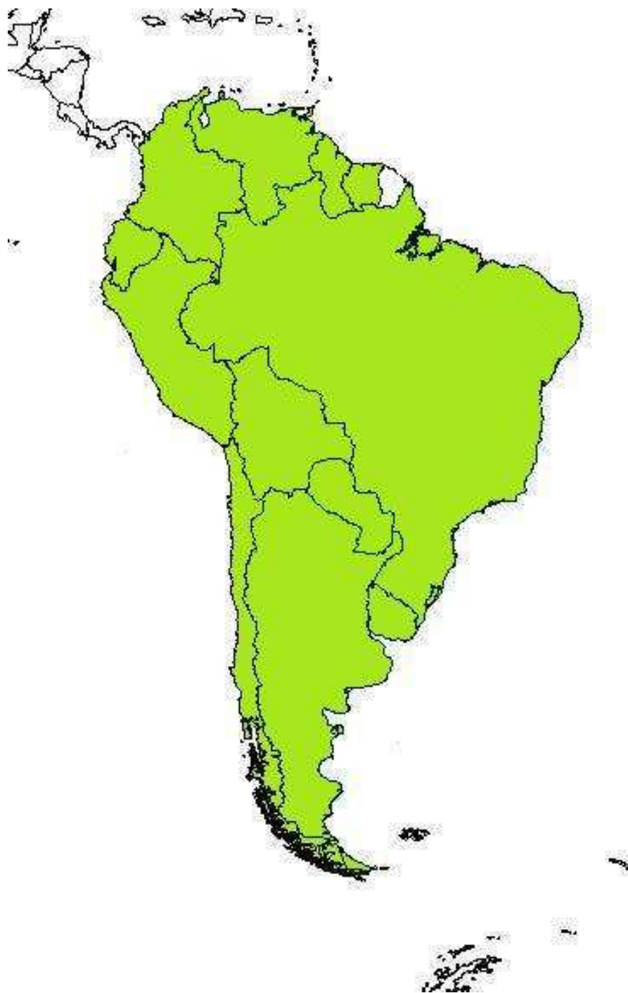
Obr. č. 8 Členské státy UNASURu k roku 2011