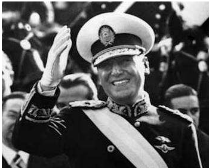
Obr. 3 Juan Perón [17] ()