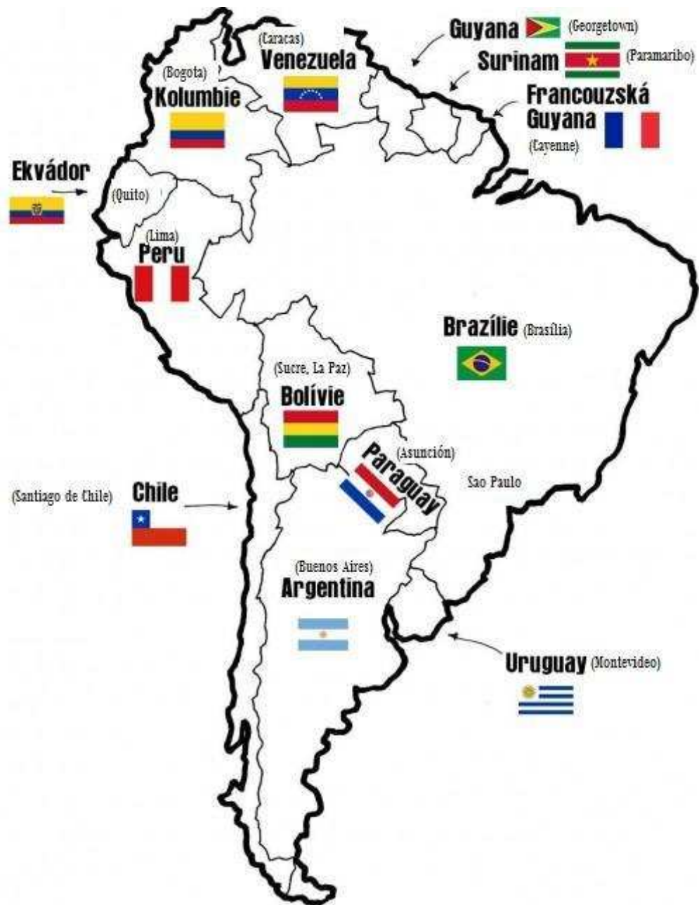
Obr. 1. Území Jižní Ameriky s vlajkami a hlavními městy [15]