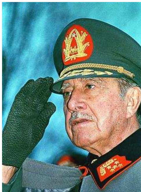
Obr. 2 Augusto Pinochet [16]