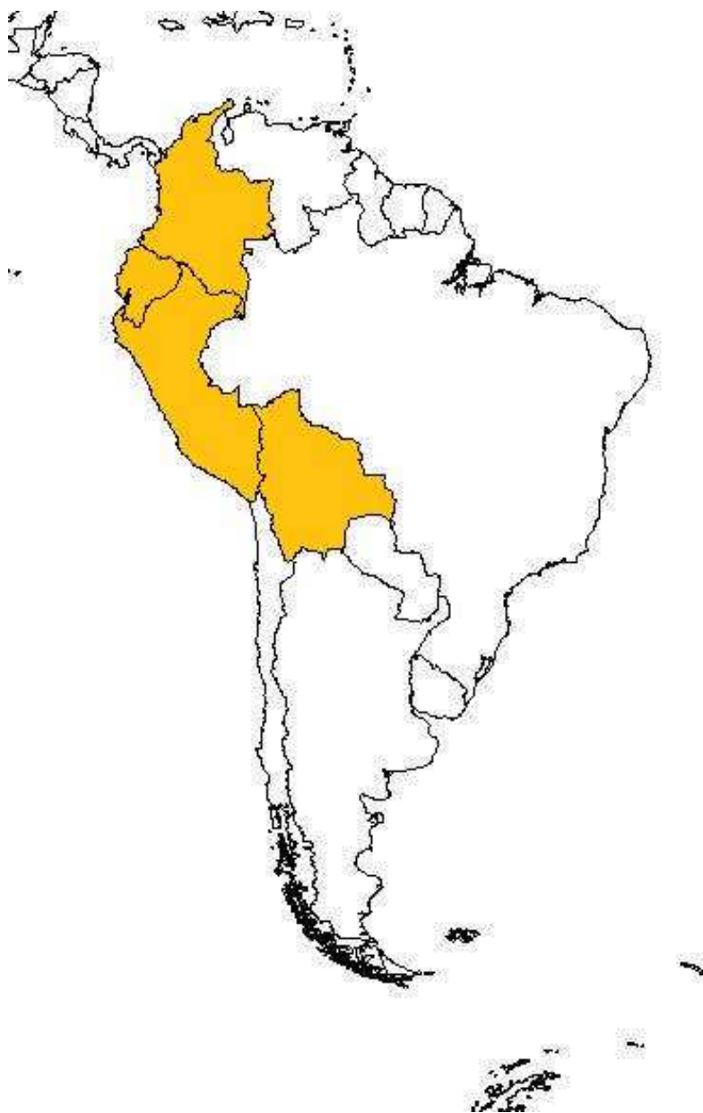
Obr. č. 6 Členské státy Anského společenství k roku 2011