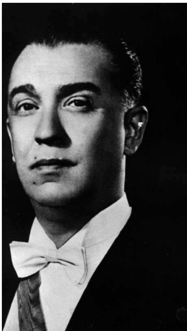
Obr. č. 5 Juscelino Kubitschek [19]