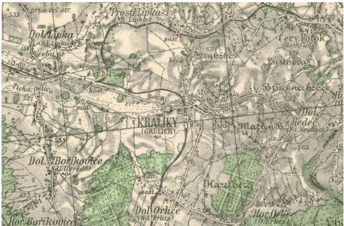
Obrázek 2: Mapa III. Vojenského mapování. Množství drobných sakrálních objektů výrazně převyšuje dnešní stav.

většina z nich byla zničena nadcházejícími událostmi, tedy průchodem vojsk a ničením za účelem potlačení křesťanství.