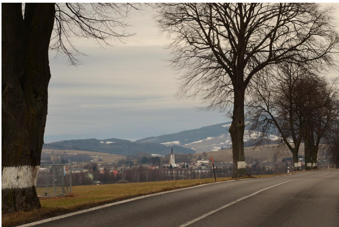
Obrázek 4: Věž Králického kostela archanděla Michaela na náměstí ze silnice I/43.

Míra ovlivnění území je odvislá na intenzitě dopravy a složení dopravního proudu. Středem území prochází komunikace č. 43 (z Červené Vody přes Králíky k hraničnímu přechodu Dolní Lipka) a 11 (z Jablonného nad Orlicí do Šumperka přes Červenou Vodu), další významnější komunikací je silnice č. 312, která vede z Žamberka přes Mladkov, Lichkov a Králíky do Hanušovic. Podle ÚAP ORP Králíky není prostředí Králicka zatíženo nadměrným množstvím hluku či imisemi z mobilních zdrojů, vyjma výše zmíněné komunikace. Ta při svém průtahu zastavěným územím hrozí vysokou hlučností a prašností (ÚAP ORP KRÁLÍKY, 2016).