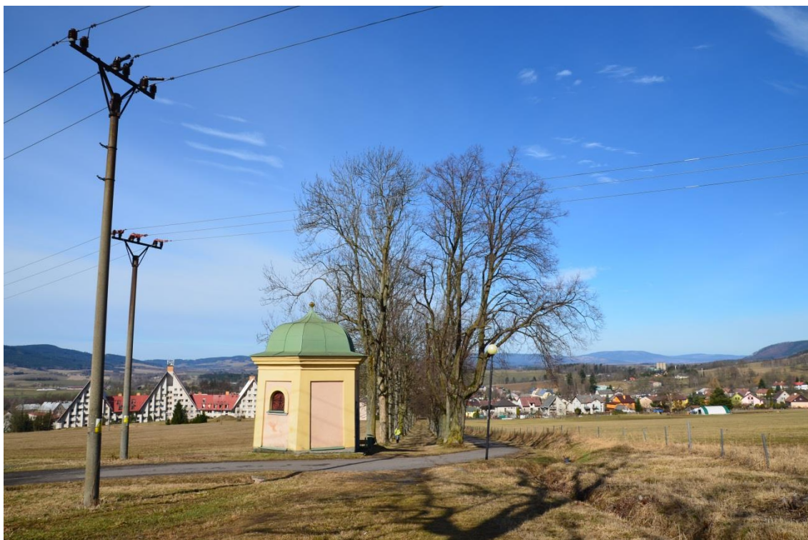
Obrázek 3: Snaha o zastínění církevních objektů. Vlevo v pozadí obytné domy, tzv. „Špice“ vystupující z horizontu zástavby.