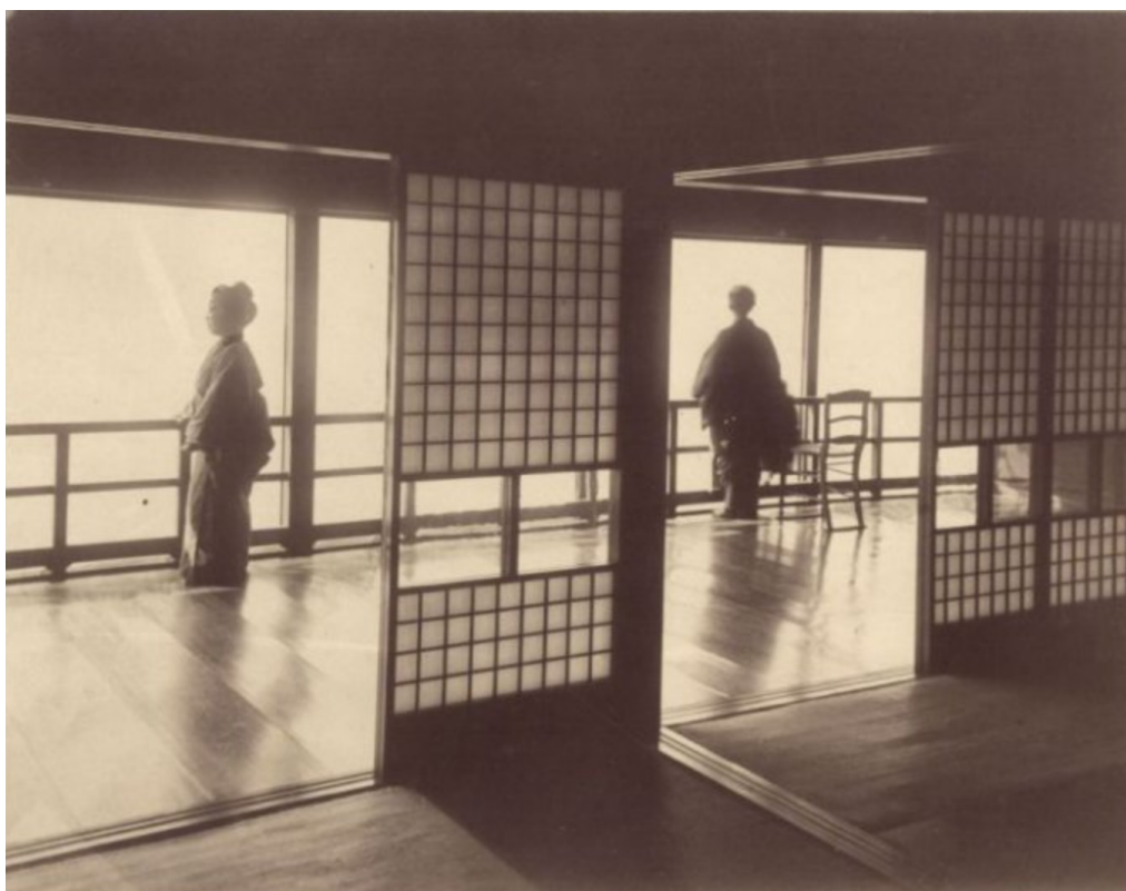
Obrázek 3 - V Žaponském hotelu při jezeře Čuzendži.

19. října cestovatelé podnikli výstup k jezeru Hakone, ležícím nedaleko hory Fudži. V jeho blízkosti se nacházelo vulkanické údolí se sirnými útvary, jež Kořenského přirozeně zaujaly – vzpomíná zde krátce i na Yellowstone.