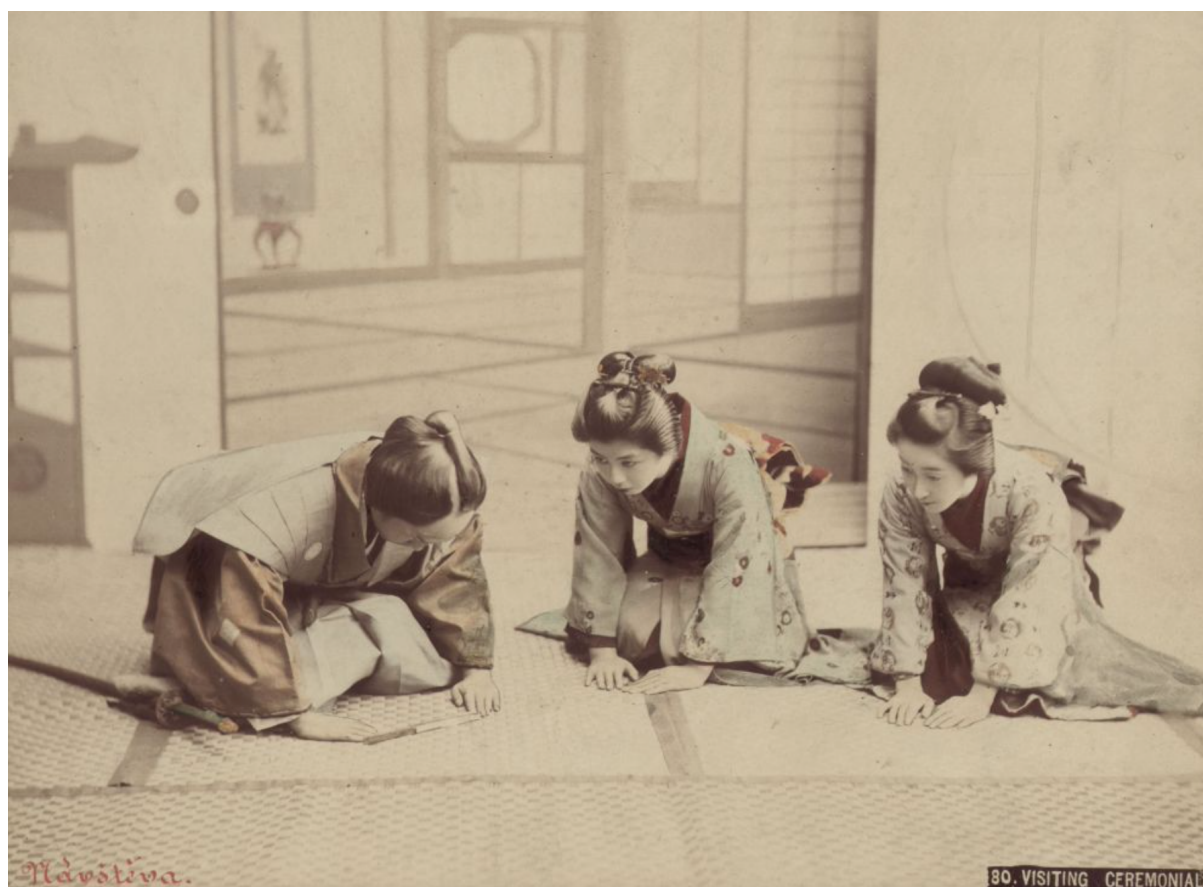
Obrázek 9 – Návštěva.

Kořenský v cestopise fotografiemi ani kresbami nijak nešetří, často k nim přímo v textu odkazuje, ilustruje jimi svůj výklad. Některé z fotografií jsou obarvené. Množství fotografických příloh muselo tehdy nutně zaujmout čtenáře, jelikož se stále jednalo o moderní médium. Cestopis to činilo poutavějším, zhmotňovalo popisované destinace. Snad i z toho důvodu byli ve své době cestopis i s autorem tak oblíbení. V japonské části cestopisu jsou nejčastějšími motivy na fotografiích aranžované výjevy z každodenního japonského života, jež nepochybně probouzely v lidech fascinaci exotikou (a evidentně i prohlubovaly kulturní stereotypy – viz Obr. 9).