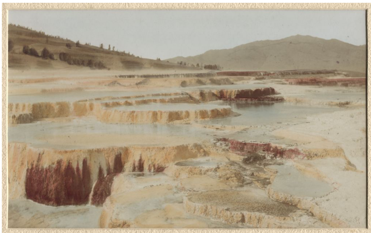
Obrázek 1 – Terasy Jupiterovy v parku Yellowstonekém.

Do Livingstonu dorazili Kořenský s Řezníčkem 8. srpna, vydávající se dále do Cinnabaru v bezprostřední blízkosti Yellowstonekého parku, kde strávili přibližně týden. Pro Kořenského, zběhlého v přírodních vědách, představovala neobvyklá yellowstonská krajina jednu z hlavních atrakcí jeho cesty po USA a její důkladné charakteristice věnuje ve svém cestopisu několik desítek stran. Svůj popis doprovází hojnou fotodokumentací (viz Obr. 1).