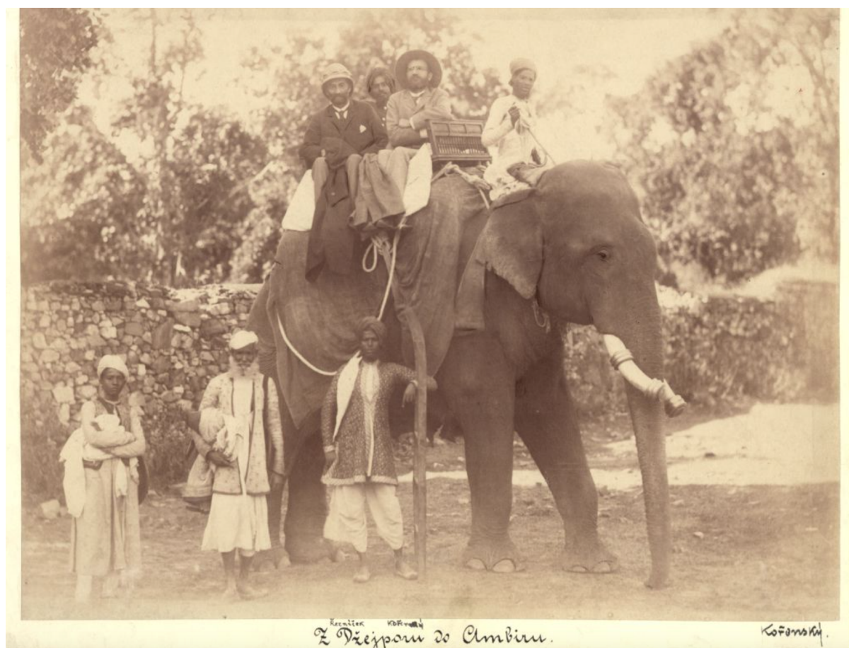
Obrázek 5 - Z Džajpuru do Ambiru.

Když viděli ve městě svatbu jednoho z členů maharadžovy rodiny, neodolali pokušení a požádali o svolení se slavnosti účastnit, v čemž jim bylo vyhověno. Mimo to byli i v zoologické zahradě nebo na divadelním představení.