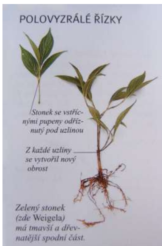
Obrázek č. 2 – Řízkování polovyzrálými řízků a jejich zakořeňování