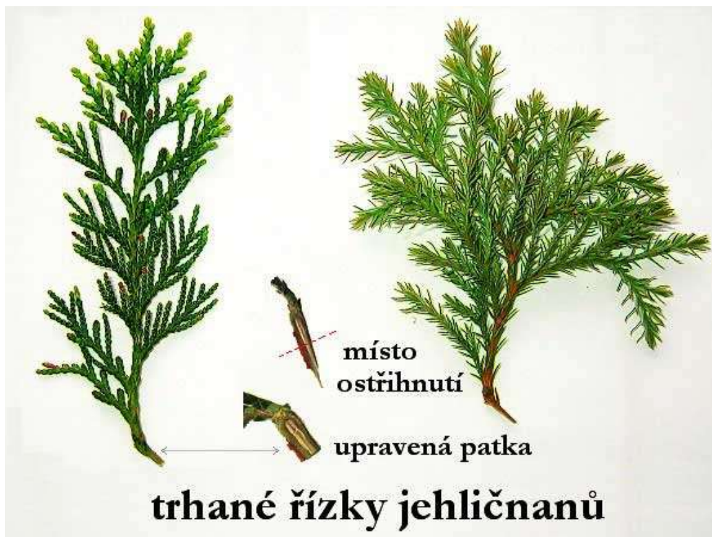
Obrázek č. 6 – Úprava jehličnatých řízků s patkou