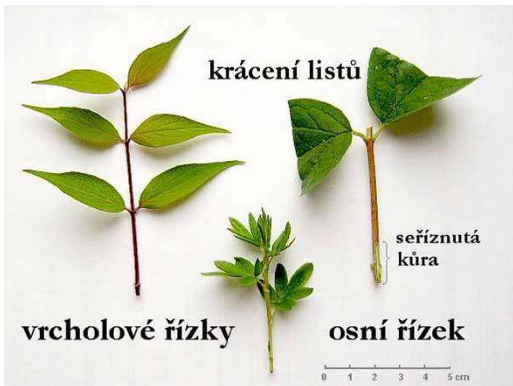
Obrázek č. 5 – Úprava řízků listnatých dřevin