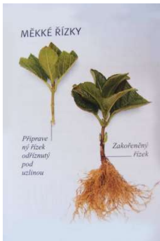
Obrázek č. 1 – Řízkování měkkými řízků a jejich zakořeňování