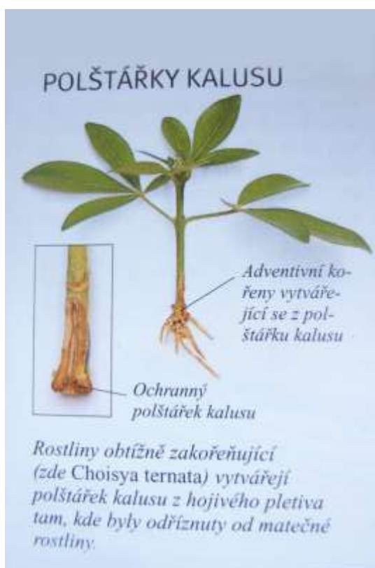
Obrázek č. 4 – Zakořeněný řízek, kde se vytvořil kalus