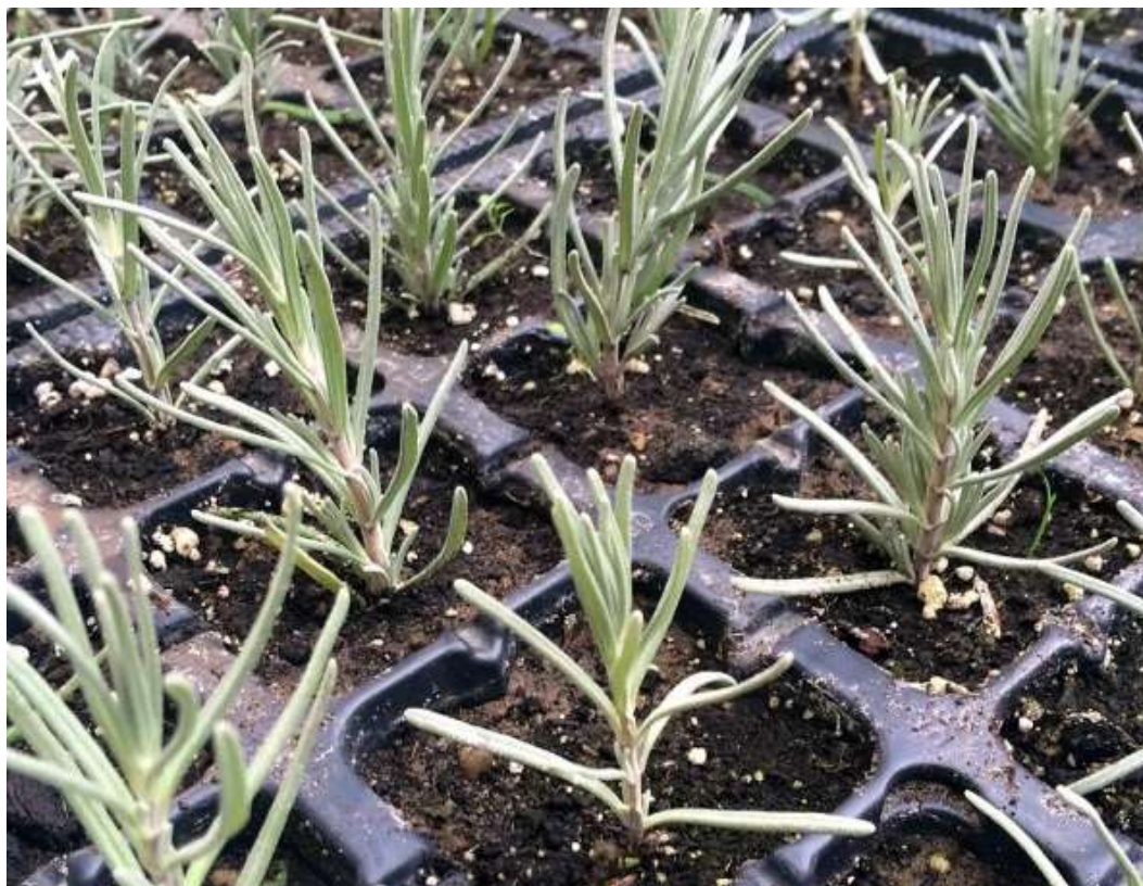
Obrázek č. 7 – Zapíchané řízky druhu Lavandula do sadbovače