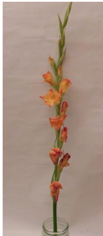
Obr. č. 25 'Adéla' č. 1 5. den