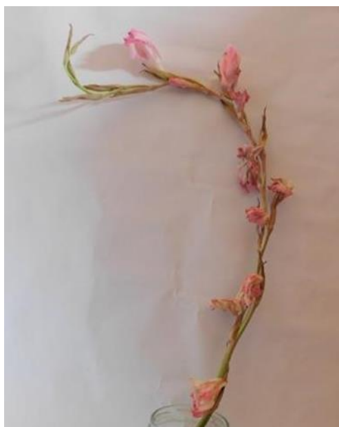
Obr. č. 17 'Libertas' č. 1 8. den