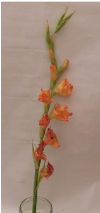
Obr. č. 21 'Adéla' č. 1 6. den