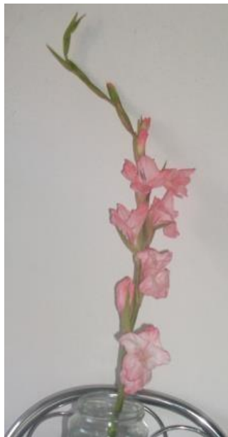
Obr. č.15 'Libertas' č. 1 4. den