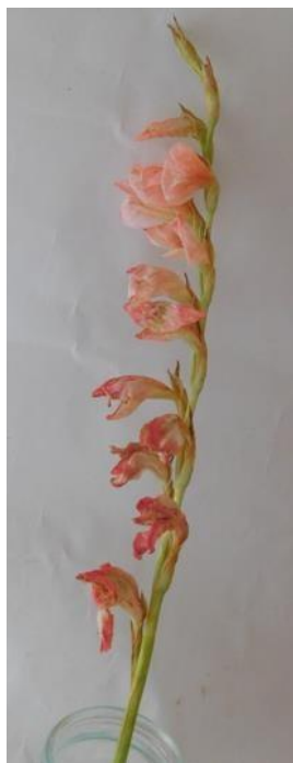
Obr č.5 'Chloe' č.1 8. den