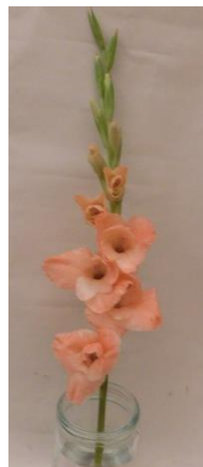
Obr. č.3 'Chloe' č.1 3. den