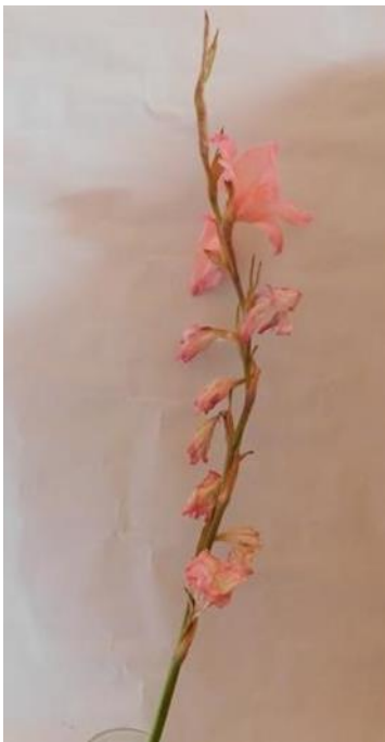
Obr. č. 13 'Libertas' č. 1 7. den