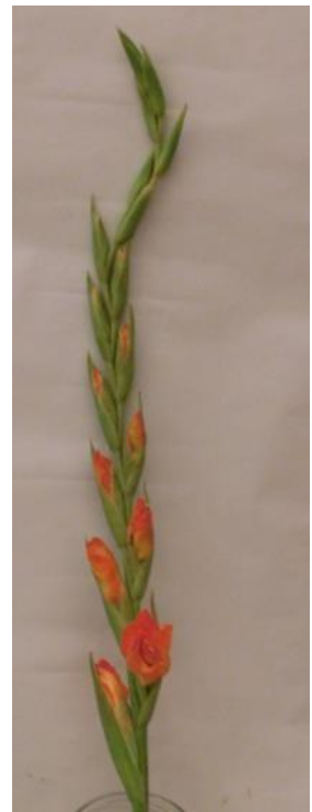
Obr. č. 20 'Adéla' č. 1 3. den