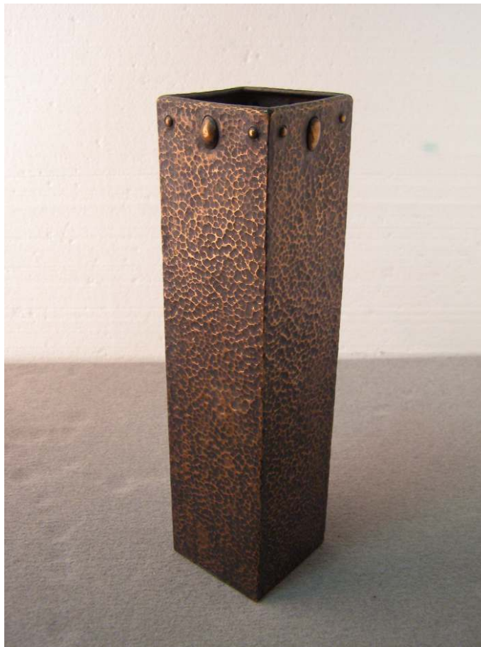
Obr. 18 – K 724