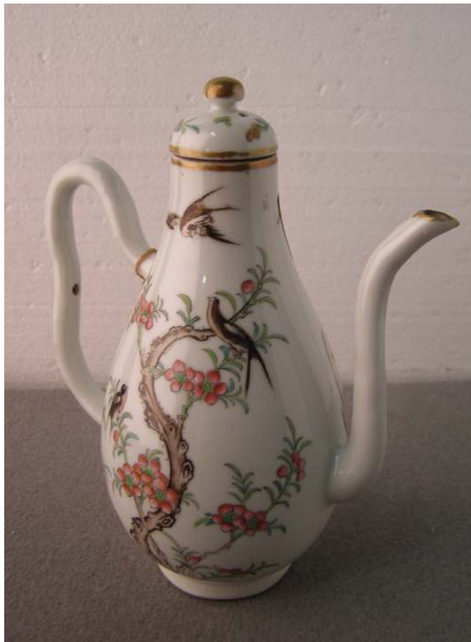
Obr. 8 – K 732