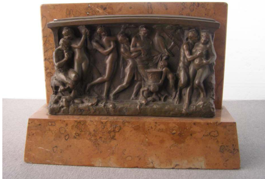
Obr. 28 – K 882