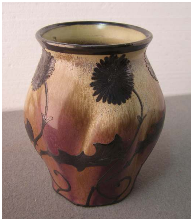
Obr. 46 – Z 484