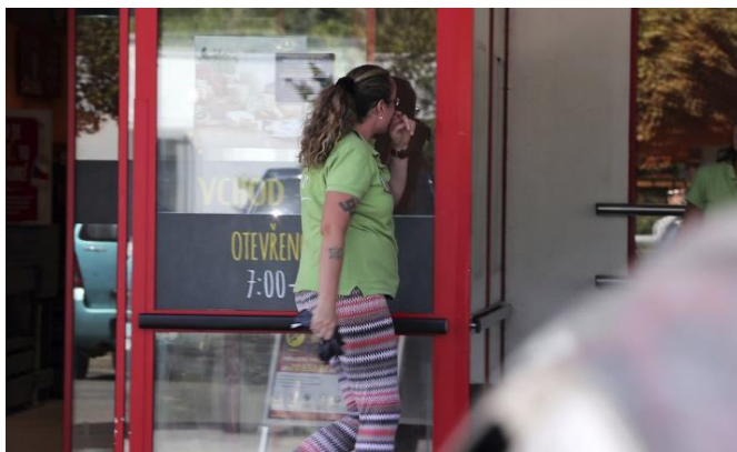
Obrázek 4 – Příklad z praxe Penny