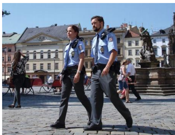
Obrázek 9 - Uniforma PČR