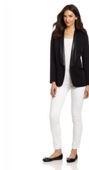
Obrázek 6 - Business casual