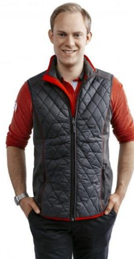
Obrázek 2 - Zaměstnanecké oblečení Kaufland