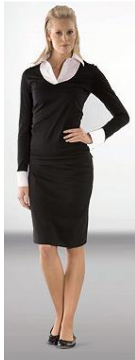
Obrázek 5 - Business styl