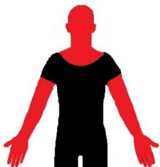
Obrázek 7 - Zakázaná místa na těle AČR