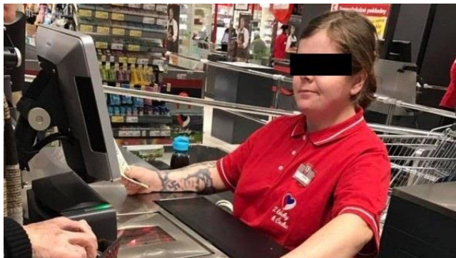
Obrázek 3 – Příklad z praxe Kaufland