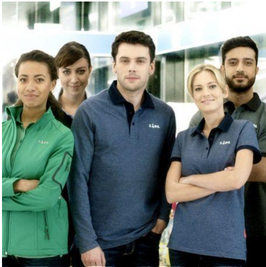
Obrázek 1 - Zaměstnanecké oblečení Lidl