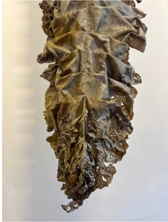
detail struktury a zkouška adjustace křemičitanem sodným a pšeničným škrobem