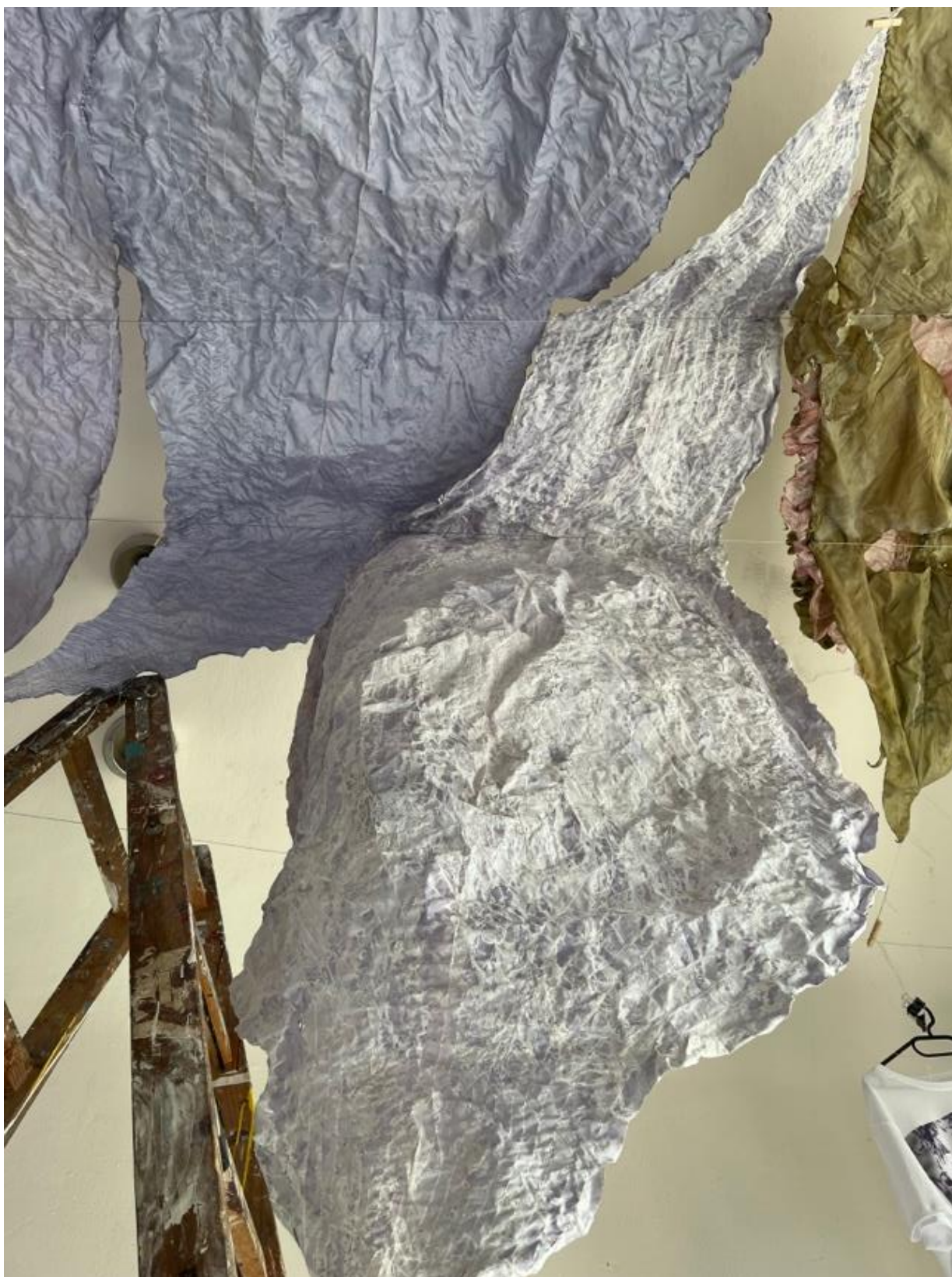
průběh schnutí křemičitanu sodného