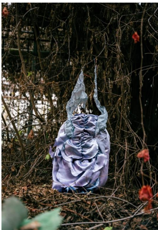
instalation uncluttered.greenhouse/saténový objekt, 2023