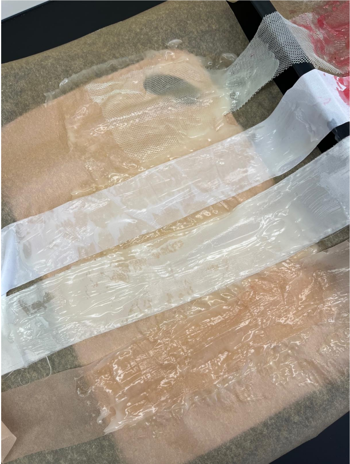
reakce vybraných textilií po namočení v bioplastu