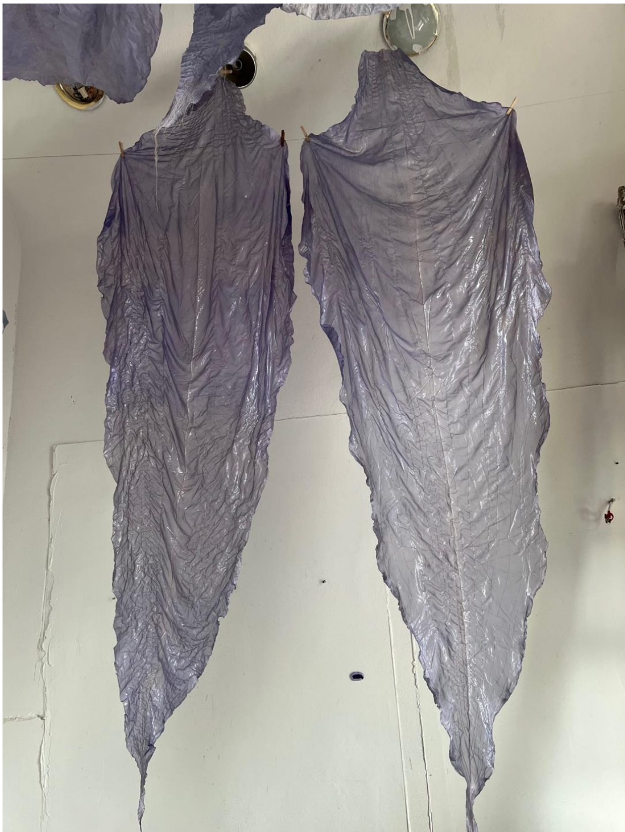
průběh schnutí křemičitanu sodného