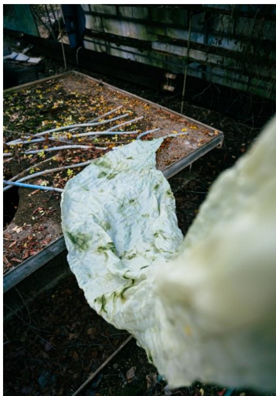
instalation uncluttered.greenhouse/objekt z podšívkového textilu, 2023