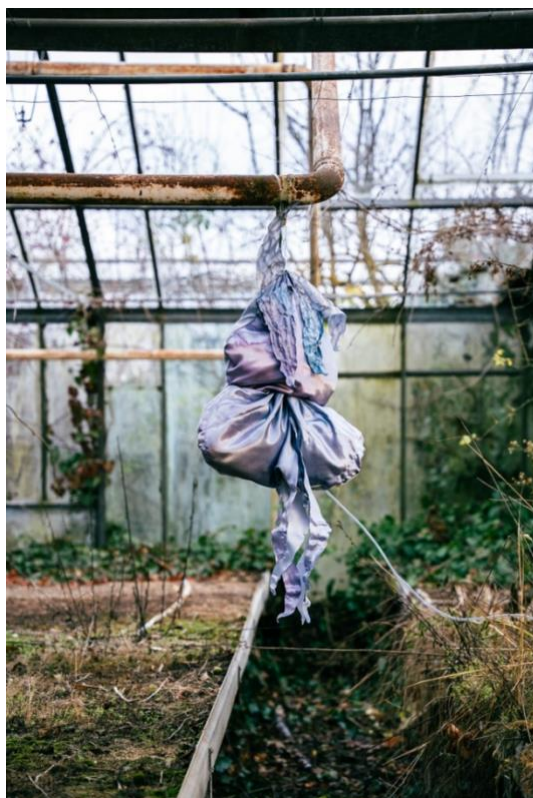
instalation uncluttered.greenhouse/saténový objekt, 2023