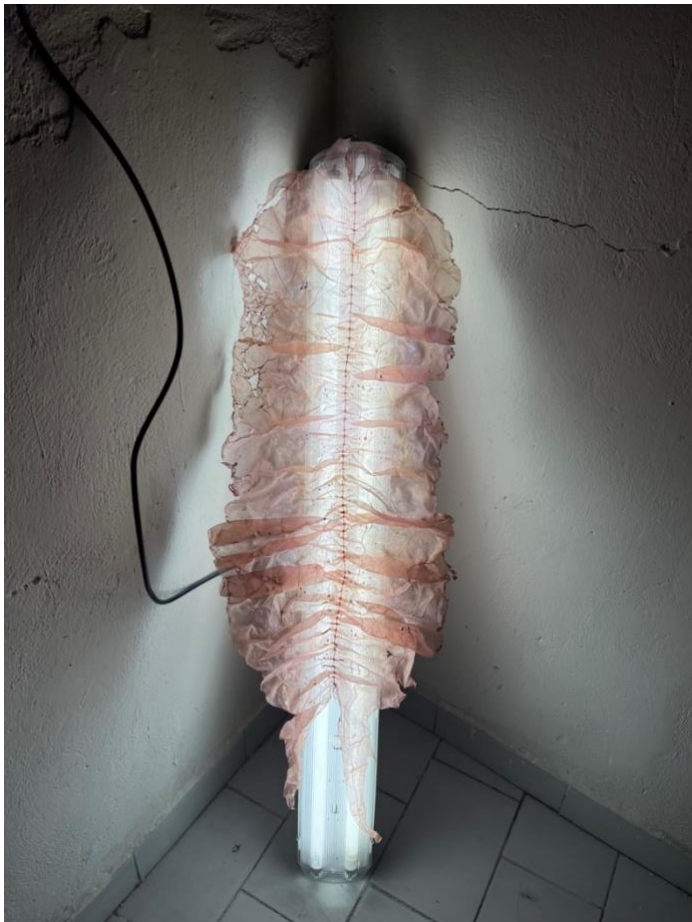
zkouška instalace se světlem a adjustace pouze křemičitanem sodným