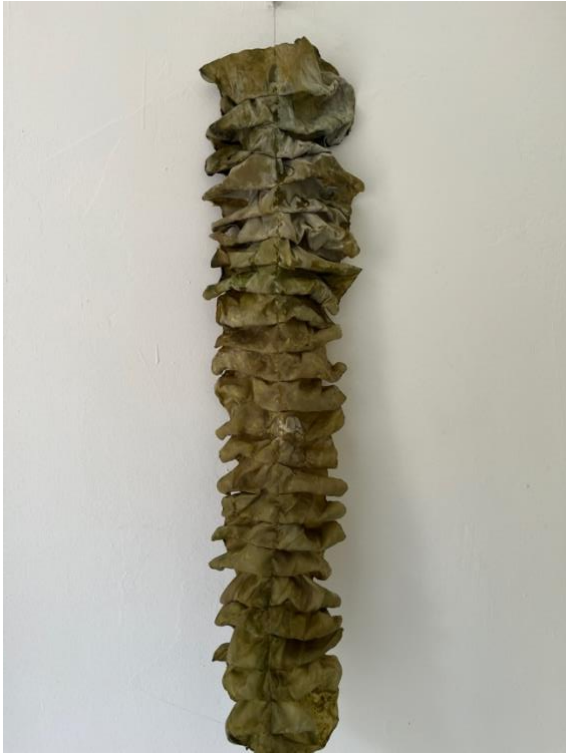
model páteře a zkouška adjustace pšeničným škrobem