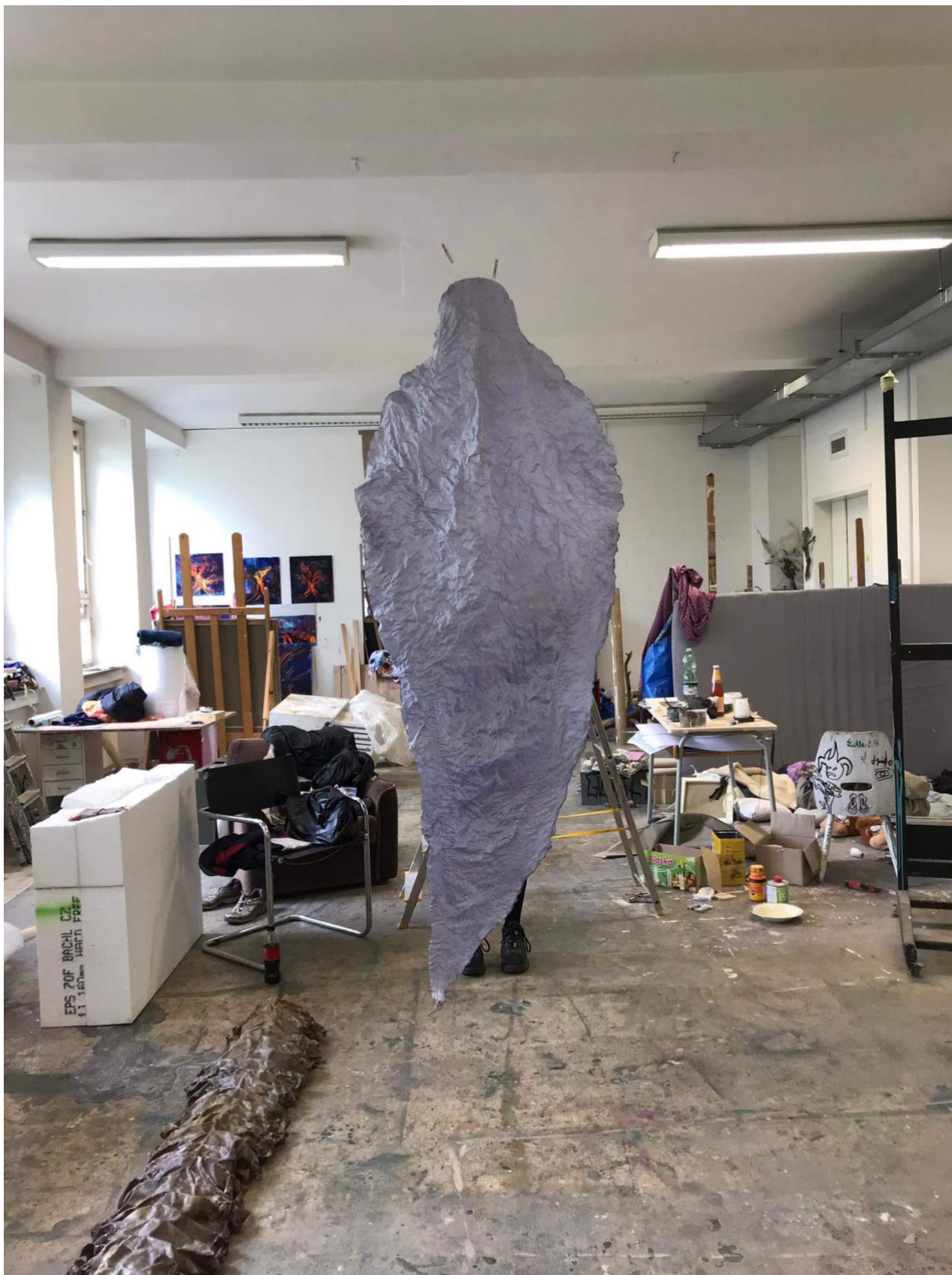
zkouška instalace finálních objektů