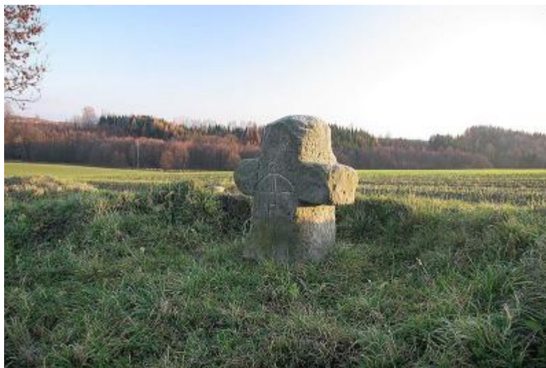
Obrázek 1: Smírčí kříž u Brzic na Náchodsku

Mediace byla v Evropě ve středověku hojně využívána zejména v oblasti trestných činů. Odkazem na to je mj. fenomén tzv. smírčích křížů, 35 jež symbolizovaly pokání a smíření se nejen s bohem, ale i s obětí a pozůstalými. Ostatně smírčích křížů nacházíme na území Evropy (hojně i na našem území) poměrně velké množství. 36