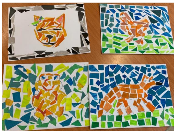
Obrázek 21 – výsledné práce žáků