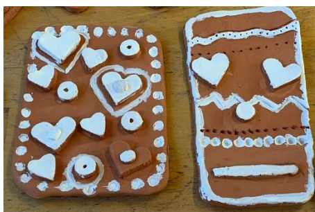
Obrázek 7 – výsledná práce žáků, keramická tvorba

Děti měly možnost seznámit se s keramickou tvorbou. Standardně se k barvení keramiky používá glazura, která se posléze vypaluje s výrobkem v keramické peci. Autorka této práce, ale k závěrečnému nabarvení perníčku s dětmi použila akrylovou barvu, která je pro ŠD finančně dostupnější variantou. Lze také pro závěrečný nátěr použít i temperu smíchanou s lepidlem Herkules, aby se barva neloupala a byla lesklejší. Nakonec k závěrečnému nabarvení stačilo použít pouze bílou barvu, neboť samotná hlína měla přirozenou barvu tradičního perníku.