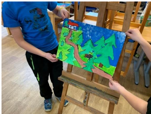
Obrázek 36 - chlapci, 3. třída, instalace výtvarných děl na výstavu (malířské stojany)