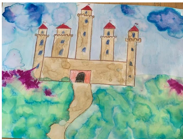
Obrázek 33 – výsledná práce chlapců