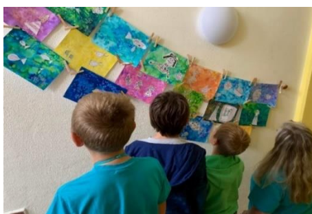
Obrázek 9 – výstava

Děti měly možnost vyzkoušet si instalaci vlastních výtvarných děl na výstavu po budově školy. Pro výstavy byly využity chodby, okna, malířské stojany a magnetické tabule, které slouží jako výstavní plocha ve školní družině. Vystavená díla si mohli prohlédnout ostatní pedagogové i žáci školy a v odpoledních hodinách i rodiče, kteří vyzvedávali dítě ze školní družiny. Rodiče žáků pracujících na výtvarném projektu, byli o všech průběžných výstavách pravidelně informováni. Děti svým rodičům zpravidla při odchodu ze ŠD svá díla i samy nadšeně ukazovaly a popisovaly techniku či průběh práce. Rodiče byli s výtvarným projektem spokojeni a byli rádi, že si mohli všechna díla vždy prohlédnout.