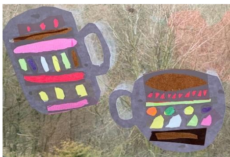
Obrázek 5 – výsledná práce žáků, papírová vitráž

Děti měly možnost seznámit se s technikou papírové vitráže. Během samotné práce se neobjevily žádné výrazné obtíže, občas bylo jen potřeba dětem pomoci s nastřihnutím menších vzorů nebo děti upozornit, aby použily do vitráže více barev. Dívky volily spíše drobnější vzory a chlapci naopak větší. Dětem se líbila závěrečná instalace vitráže na okno, kdy mohly pozorovat, jak se jim barvy jednotlivých papírů vlivem světla rozzářily.