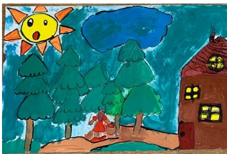
Obrázek 6 – výsledná práce žáků, ilustrace (tempera, tuš)

Všichni tento výtvarný úkol bez problému pochopili a zvládli. Každý pohádku „O Červené Karkulce“ znal a dokázal ji převyprávět. Děti pro tuto práci upřednostňovaly spolupráci ve dvojicích či skupinách. Každý se tak v ilustraci podílel na určité části. K práci byly využity klasické temperové barvy v sadě i v lahvích, které jsou pro ŠD cenově dostupné. Děti byly se svými ilustracemi spokojené, obzvláště po přidání černé tuše, který obrázku dodal živost.