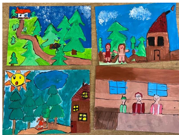
Obrázek 27 – výsledné práce žáků