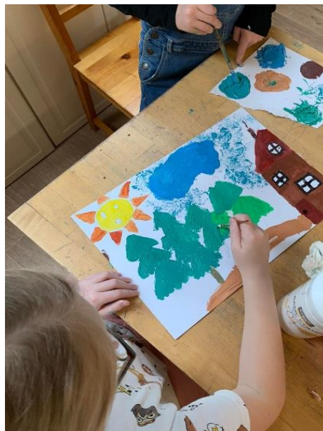
Obrázek 26 – Kačka, 3.třída, malba temperou