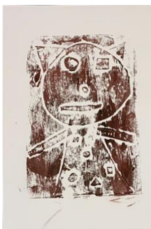
Obrázek 2 – výsledná práce žáků, tisk z koláže

Toto bylo první setkání dětí s grafikou a tiskem. Děti úkol pochopily, a tak nevznikla při práci žádná nedorozumění. Jen bylo nutné občas připomenout vrstvení a řádné lepení, aby při nanášení barvy nedošlo k odlepení. Pro tisk byly zvoleny klasické temperové barvy, které jsou ve školní družině běžně dostupné a pro práci byly dostačující. Pro lepší kontrast barev výsledného výtvoru je lepší využít až druhý nebo třetí otisk matrice.