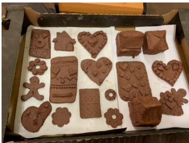
Obrázek 30 - žáci, 3. třída, zhotovené výtvary před vypálením v keramické peci