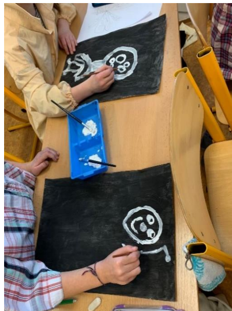
Obrázek 17 - žákyně, 3. třída, kresba bílou linkou