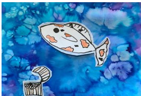
Obrázek 1 – výsledná práce žáků, zapouštění barev,

Toto byla autorky první společně realizovaná práce s dětmi, která by je měla uvést do tématu výtvarného projektu. Pojmy vztahující se k pohádkám si s dětmi nejprve utřídily v myšlenkové mapě. Obrázky, na kterých byly ilustrovány tradiční české pohádky, děti snadno poznávaly a dokázaly shrnout, o čem vypráví. Při výběru barev převažovaly u chlapců modré a zelené odstíny a u dívek růžové a žluté. Dětem vnikly krásné a jedinečné barevné efekty.