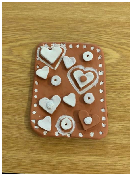
Obrázek 29 – výsledná práce žáků