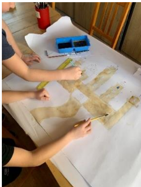
Obrázek 31 - chlapci, 3. třída, malba kávou