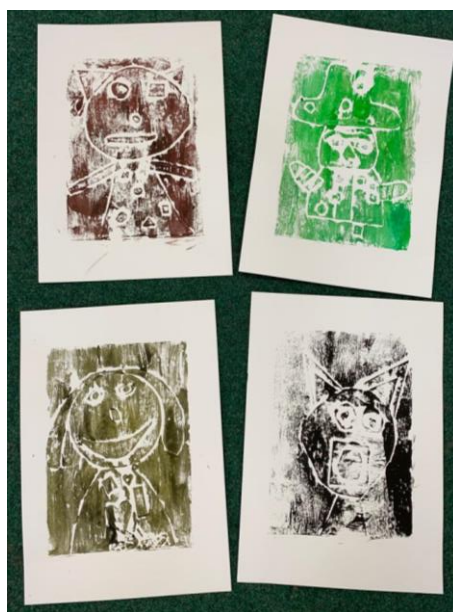
Obrázek 15 – výsledné práce žáků