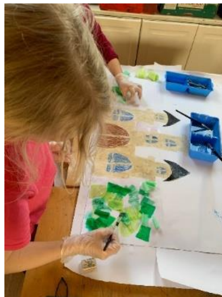
Obrázek 32 - dívky, 3. třída, malba krečovým papírem