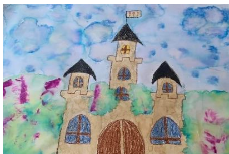
Obrázek 8 – výsledná práce dívek, kombinovaná technika

Děti měly možnost seznámit se s technikou malby kávou a s barvením podkladu pomocí krepového papíru. Při barvení podkladu mohly děti využít jednorázové rukavice, které dětem zamezily v zašpinění od krepového papíru. Při samotné kresbě zámku či hradu chlapci preferovali pravítko, které jim umožnilo přesné linie a tvary. Dívky naopak volily kreslení od ruky a celkově tak byly při práci rychlejší než chlapci. Tato výtvarná práce byla pro děti zajímavou netradiční technikou, se kterou se setkaly ve školní družině.