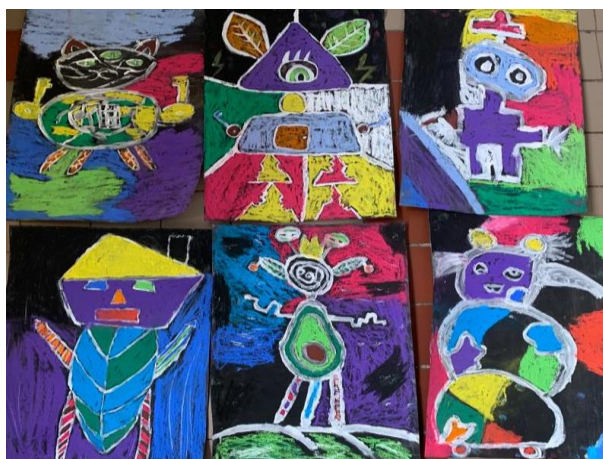
Obrázek 18 – výsledné práce žáků