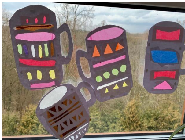
Obrázek 24 – výsledné práce žáků