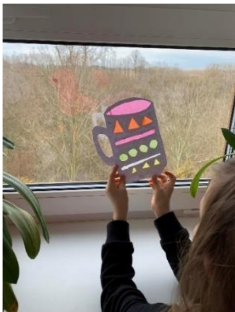
Obrázek 34 – Tonička, 3. třída, instalace výtvarných děl na výstavu (okna)