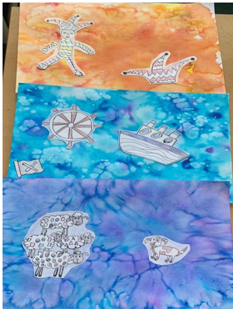
Obrázek 10 – výsledné práce žáků

Příloha č. 1 – zapouštění barev do vlhkého podkladu, solný efekt, tuš, pastelka