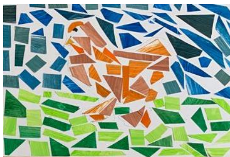
Obrázek 4 – výsledná práce žáků, papírová mozaika

Děti si při této práci poprvé vyzkoušely techniku papírové mozaiky. Papíry děti nakonec nabarvily temperami den předem, aby mohly vyschnout. Další den se tak mohlo hned pracovat na mozaice a pro děti tak alespoň nebyla práce příliš zdoluhavá. Vlastní papíry, které si děti nabarvily, byly ve výsledné práci mnohem zajímavější a živější než kdyby byly použity klasické barevné papíry.