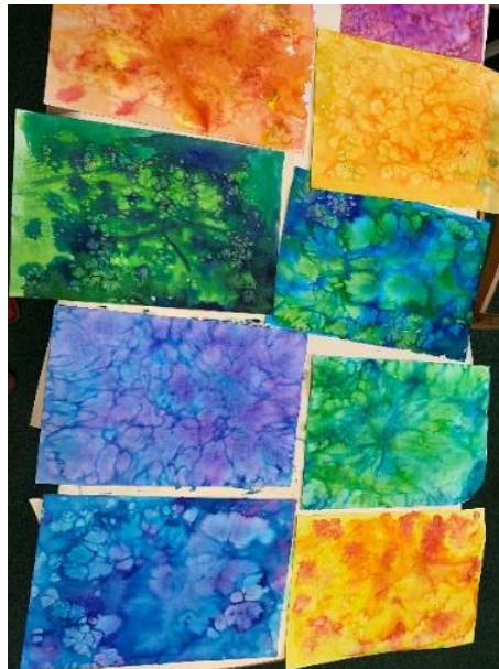
Obrázek 11 – žáci, 3. třída, solný efekt