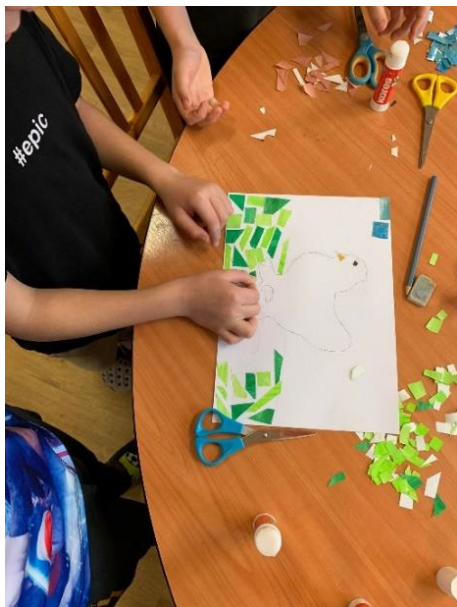
Obrázek 19 - Lukáš, 3. třída, tvorba mozaiky