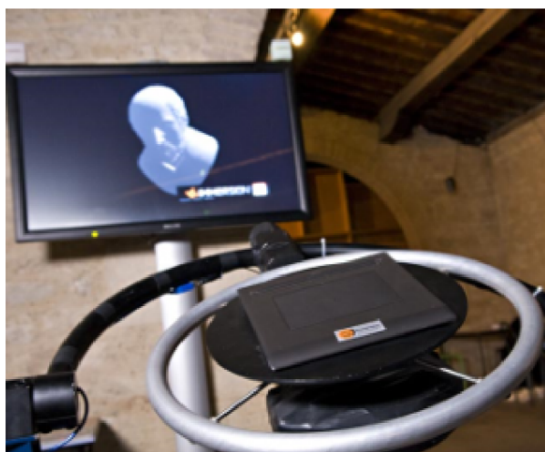
Obr. 3 Způsob provedení CAT plošiny [41]

Uživatel požívá plošinu k ovládání zobrazené scény. Identická orientace platformy a scény napomáhá intuitivnímu ovládání. Šest stupňů volnosti může být ovládáno zároveň nebo jednotlivě. Záleží na tom, jestli chceme vytvářet složité pohyby nebo jen pohyby, které obsahují malé množství stupňů volnosti. Je také opatřen grafickým tabletem, který obstarává 2D interakci. [1]