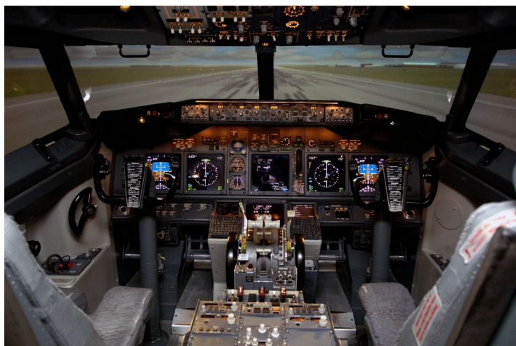
Obr. 10 Simulátor kokpitu letadla [47]

Budování konstrukčního projektu ve virtuální realitě přináší řadu výhod. Jednou z výhod je schopnost otestovat množství faktorů dříve, než začneme se stavbou a tím zredukujeme počet chyb přítomných v hotové budově. Dalším faktorem, který můžeme otestovat je proveditelnost dané stavby a můžeme nasimulovat i vlastní konstrukci. Toto umožní stavebním firmám doladit konstrukční proces a zajistit maximální efektivnost. [22]