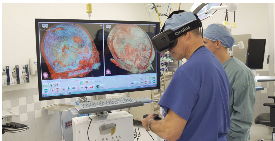
Obr. 11 Plánování operace pomocí VR [48]

Schopnost naplánovat proces operace je nedílnou součástí přípravy. Možnost provést toto plánování v prostředí virtuální reality to posunuje ještě o kus dále. Konzultanti se mohou doslova procházet skenem mozku nebo těla (Obr. 11). [39]