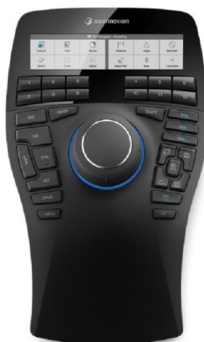
Obr. 2 3D myš SpaceMouse Enterprise [40]

Ceny se pohybují od 3000 Kč do 14000 Kč. Například 3D myš SpaceNavigator od firmy 3dconnexion, což je nejlevnější verze, stojí 3570 Kč a model SpaceMouse Enterprise (Obr. 2), který obsahuje i další tlačítka a displej, stojí 12852 Kč. [6]