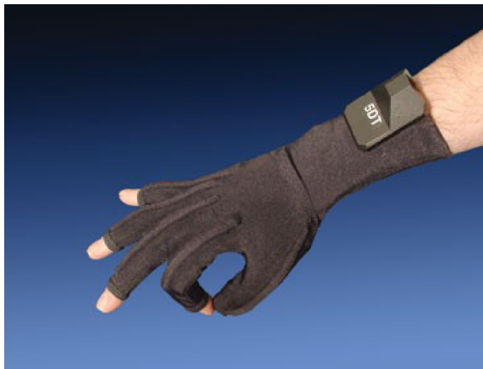
Obr. 1 Data Glove 5 Ultra [3]

Cena datových rukavic se odvíjí od použité technologie a počtu senzorů. Rukavice Data Glove 5 Ultra (Obr. 1) od výrobce 5DT (Fifth Dimension Technologies), která obsahuje 5 senzorů stojí přibližně 24000 Kč (995 USD) a stejná rukavice, která má 14 senzorů stojí 145000 Kč (5945 USD). Tato cena může odradit běžného zákazníka, a proto se používá spíše pro vědecké účely. [3]