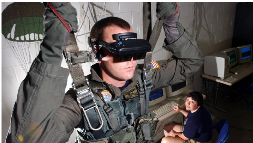
Obr. 12 Simulace seskoku s padákem [39]

Plextek není jediným vojenským dodavatelem, který experimentuje s virtuální realitou. V Jižní Korei, DoDAAM poskytuje celou řadu programů. V jednom se používá postroj, zavěšený ze stropu a HMD simuluje let padákem (Obr. 12). Uživatel musí navádět padák na dopadovou plošinu zatímco mu průmyslový ventilátor, který simuluje reálné podmínky, fouká vzduch do obličeje. Další je navržen k tréninku odstřelovačů a jejich pozorovatelů. Odstřelovač si lehne na zem v obrovském klenutém prostředí a je mu promítnuta scéna města. Pozorovatel používá Oculus headset jako dalekohled, aby vybral cíl pro svého partnera. [39]