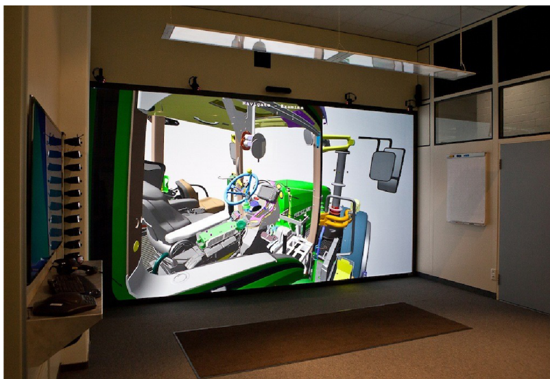
Obr. 5 Umístění kamer pro tracking [42]

Pro ovládání projektorů se používá skupina počítačů. Principem je rozdělení výpočetního zatížení do sítě více zařízení, které pracují současně. Každé zařízení je potom odpovědné za kalkulaci části obrazu. Tento systém je výhodný, protože umožňuje použití systému, který je méně nákladný než vyhrazený počítač a také je více flexibilní z hlediska vývoje a upgradu komponent. [1]