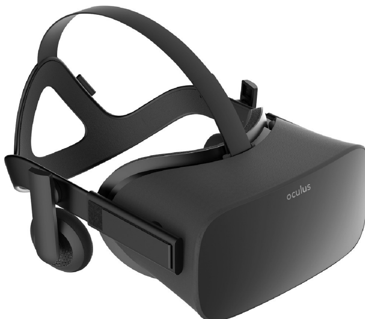
Obr. 8 Zařízení Oculus Rift [45]

Cena Oculus Rift je 14 134 Kč (598 USD), ale jako u předchozího zástupce je nutné vlastnit počítač s určitými minimálními požadavky. Tyto minimální požadavky jsou grafická karta NVIDIA GTX 960, procesor Intel i5–4590, 8 GB RAM, kompatibilní HDMI 1.3 video výstup, 3x USB 3.0 a 1x USB 2.0 port a operační systém Windows 7 SP1 nebo lepší. Cena sestavy je tedy přibližně stejná pro obě zařízení, ale pro lepší zážitek je potřeba ještě dokoupit ovladač Oculus Touch, který vyjde na 2 340 Kč (99 USD). Pro provoz Oculus Rift při minimálním požadavcích zaplatíme 28 500 Kč. [29]