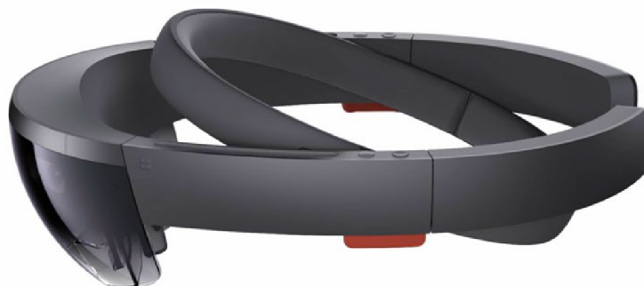
Obr. 6 Dvě části brýlí Hololens [43]

je problém při vytváření VR. Musíme mít prostředek, který tuto vzdálenost dokáže upravovat. Hololens má dvoudimenzionální IPD. To znamená, že můžeme upravovat “eye box“ horizontálně i vertikálně. [16]