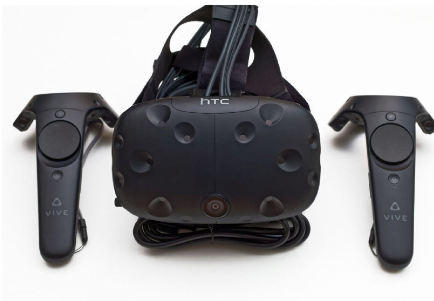
Obr. 7 Zařízení HTC Vive a ovladače [44]

Cena balíčku HTC Vive je 23 834 Kč (899 EUR), ale pro plné využití je zapotřebí výkonného počítače. Minimální technické parametry by měli být procesor Intel Core i5-4590, NVIDIA GeForce GTX 1060, 4 GB RAM, 1x HDMI 1.4 nebo Display Port 1.2, 1x USB 2.0 a operační systém Windows 7 SP1 nebo novější. Cena sestavy s minimálními požadavky je 12 000 Kč (500USD) a může se vyšplhat i na cenu kolem 100 000 Kč pro high-end sestavu. Minimální cena pro pořízení HTC Vive je tedy cca 38 000 Kč. [25][26]