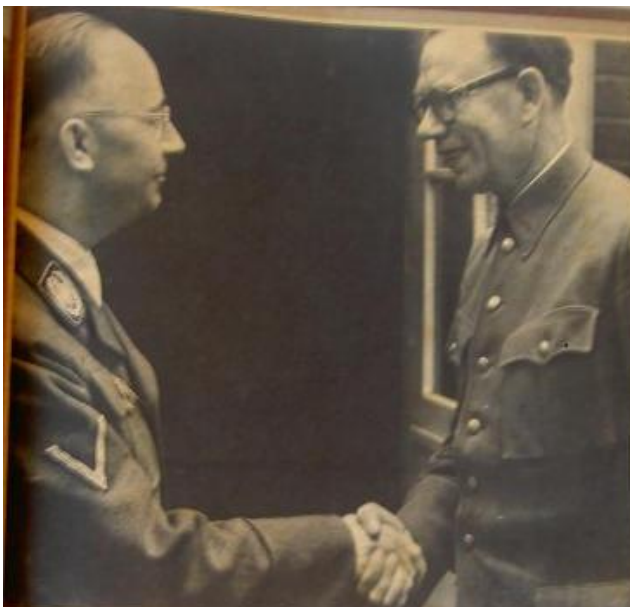
Obrázek č. 3: Heinrich Himmler a Andrej A. Vlasov

„...pod dojmem právě zahájené ofenzivy Rudé armády se tedy Himmler konečně rozhodl zahájit organizování osvobozeneckého hnutí v čele s gen. A. A. Vlasovem, bez ohledu na předešlé Hitlerovy pokyny.“ (Auský 1992).