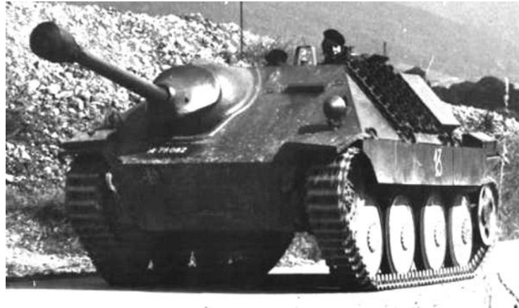
Obrázek č. 2.3: Dobová fotografie Jagdpanzeru Hetzer