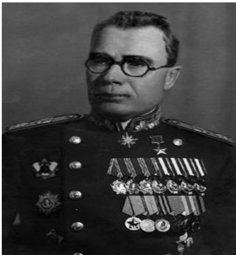
Obrázek č. 2: Andrej Andrejevič Vlasov

Ještě před samotným otevřením východní fronty v Evropě probíhaly boje na území Číny, na kterou dotírala japonská invazní armáda. Tehdejší vůdce Číny,