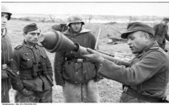
Obrázek č. 2.2: Panzerfaust 60 v rukou zbraňového instruktora