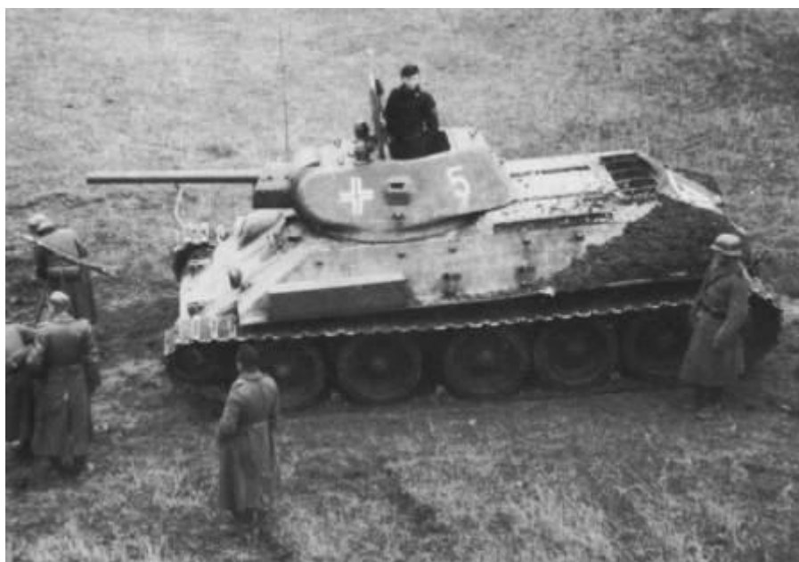
Obrázek č. 2.4: Panzerkampfwagen T-34 s německou posádkou