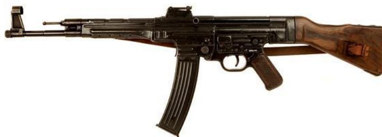
Obrázek č. 2.1: Útočná puška Sturmgewehr 44

Vývoj této útočné pušky započal až po hlavních bojích na území Sovětského svazu, kde Němci především v rozbombardovaných městech okusili tvrdý boj muže proti muži. Do té doby neměli pro tento typ boje zcela ideální zbraň, která by dávala možnost bojovat jak na krátkou, tak na delší vzdálenost. Přestože je tato zbraň schopná střílet v automatickém režimu, z technologického hlediska se nejedná o samopal, neboť vnitřní mechanismus je sestaven spíše po vzoru tehdejších klasických pušek. Dalším atypickým atributem pro zbraně tehdejší doby je „banánovitě“ zahnutý zásobník s kapacitou třicet ran. Vývoj této technologie byl široce celosvětově rozvinut až několik let po druhé světové válce. I samotná zbraň StG 44 se po skončení války rozšířila do výzbroje více zemí a stala se i vyhledávanou položkou zboží mezi obchodníky na černém trhu.