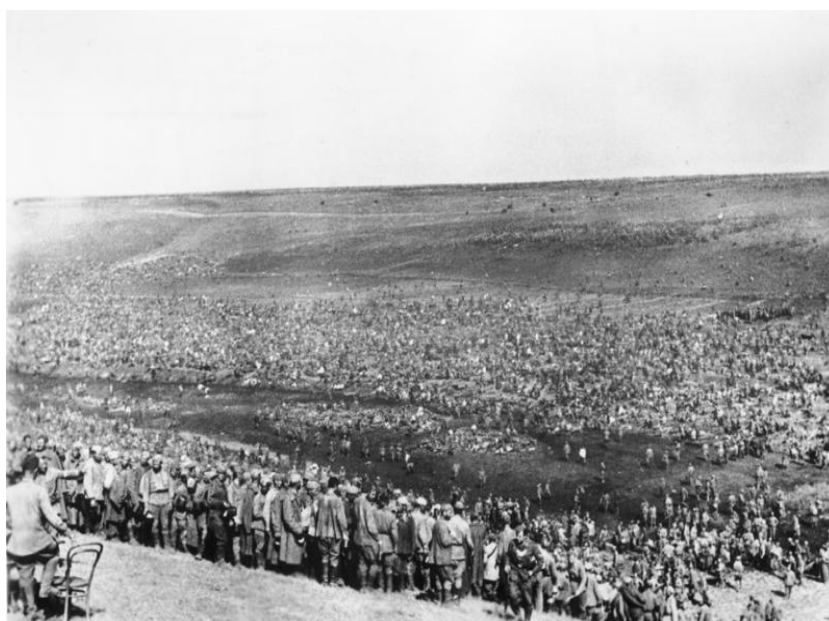
Obrázek č. 1: zajatci z východní fronty

Bundesarchiv, Bild 183-B21845 Foto: Wahner | August 1942