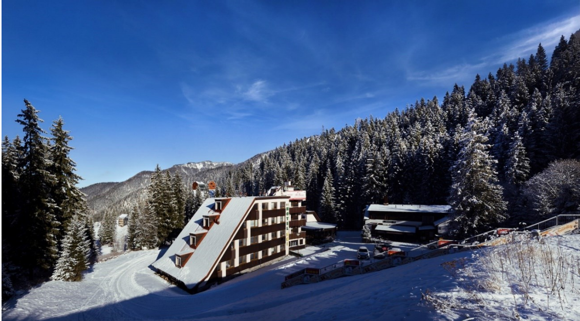
Obr. 3.1 Exteriér hotelu SKI