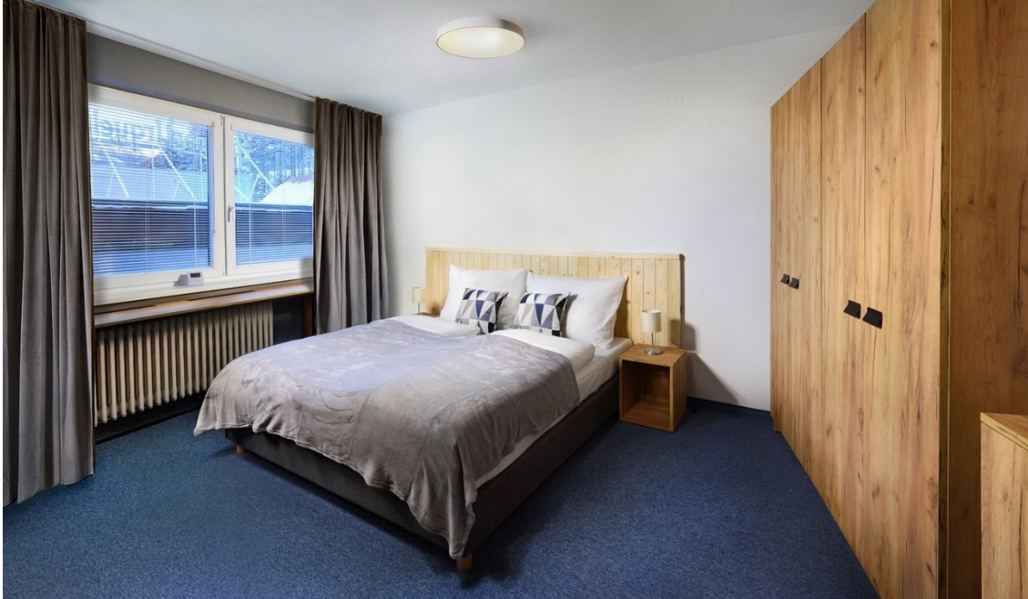
Obr. 3.2 Izba v hoteli SKI