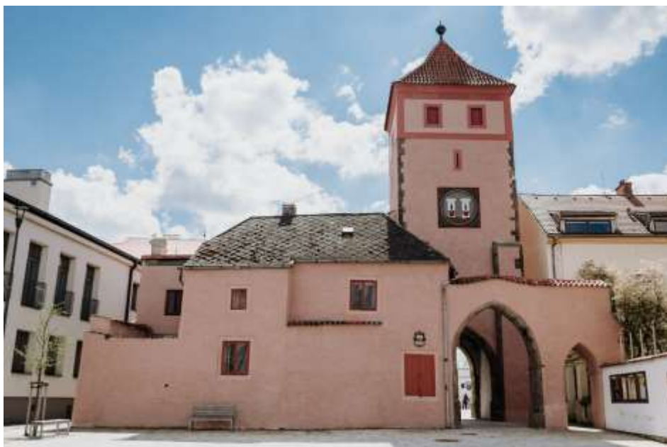
Obr. 4/ Pražská (Červená) brána v Horažďovicích.