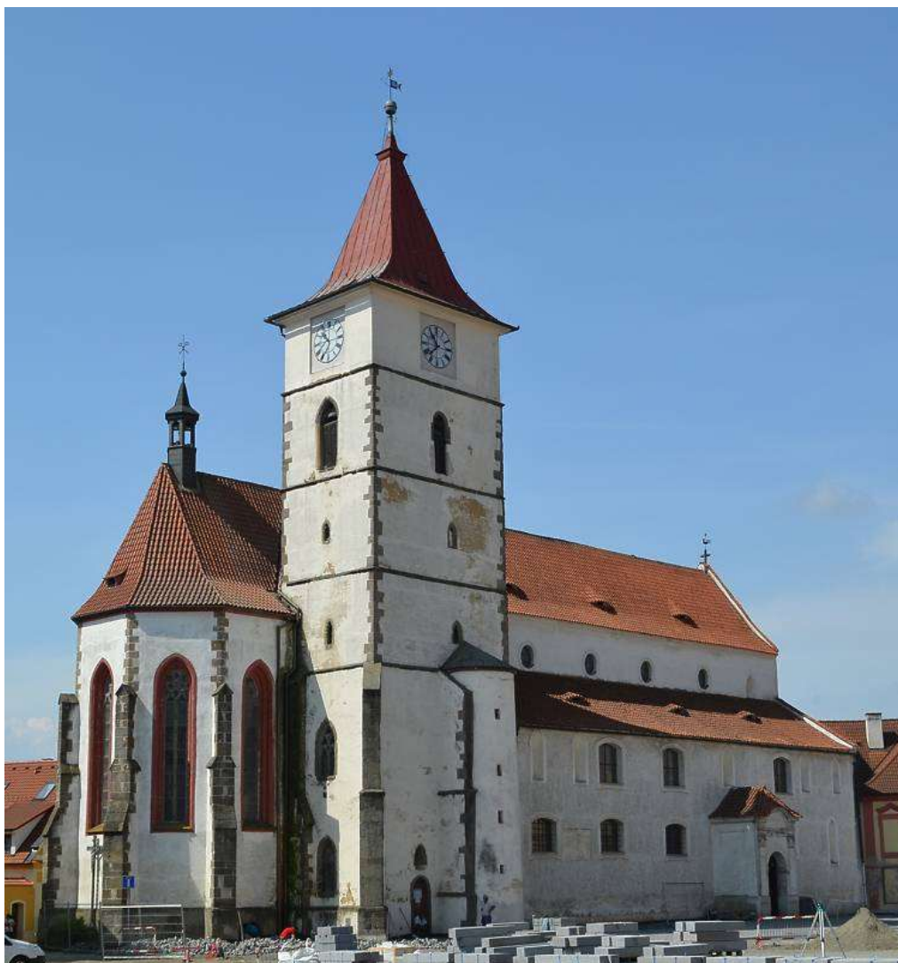
Obr. 17/ Kostel sv. Petra a Pavla v Horažďovicích, pohled na severní stranu kostela.