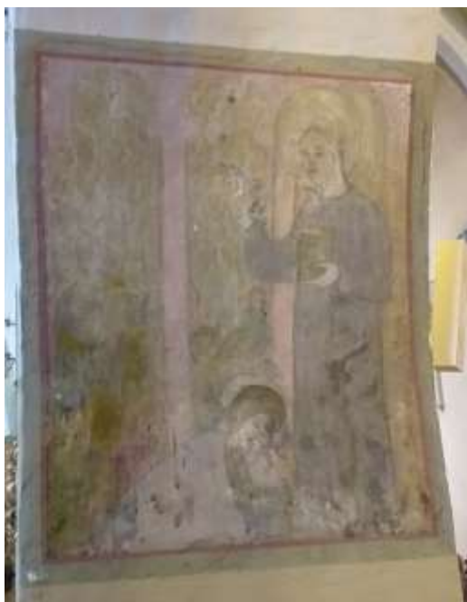
Obr. 19/ Nástěnná malba.