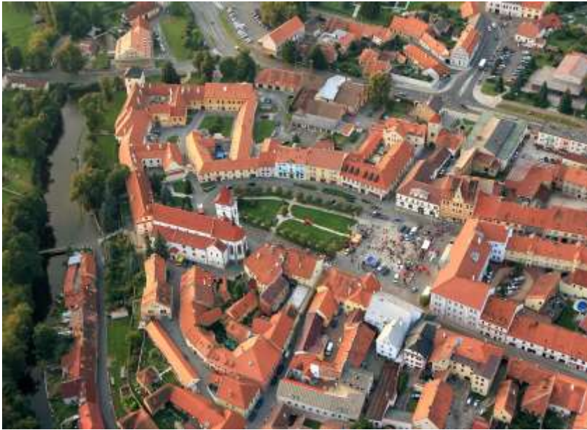
Obr. 1/ Město Horažďovice, pohled na Mírové náměstí.