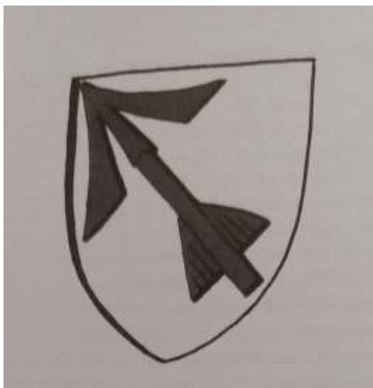
Obr. 15/ Erb rodu Bavorů. [Zdroj: Kniha Bavorové erbu střely, Simona Kotlárová, České Budějovice, 2004, s. 14]