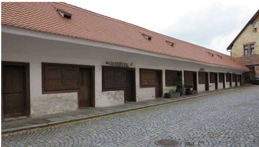
Obr. 9/ Masné krámy.