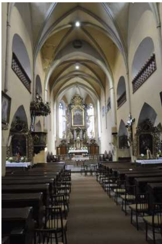
Obr. 18/ Hlavní loď kostela sv. Petra a Pavla.