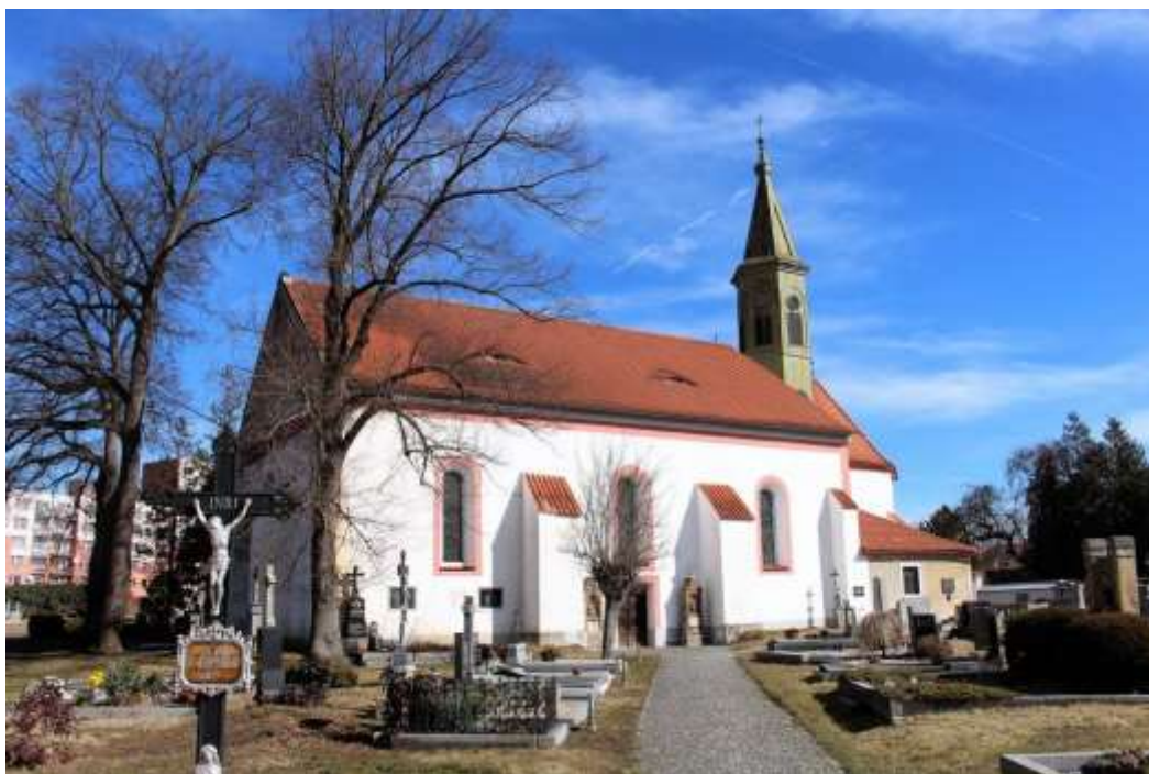
Obr. 11/ Kostel sv. Jana Křtitele.