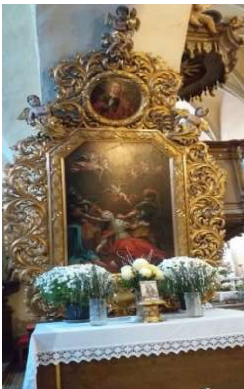
Obr. 20/ Oltář sv. Ludmily.