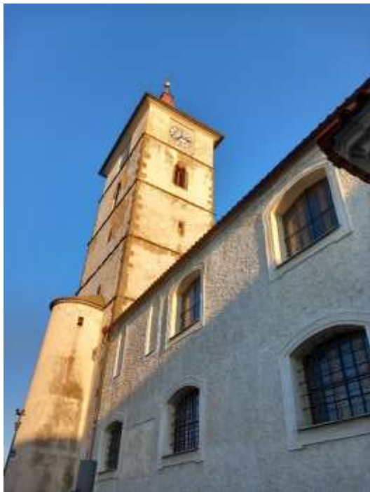
Obr. 25/ Kostel sv. Petra a Pavla, pohled na věž a přístavek se schodištěm.