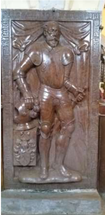
Obr. 24/ Náhrobek Adama Šice.