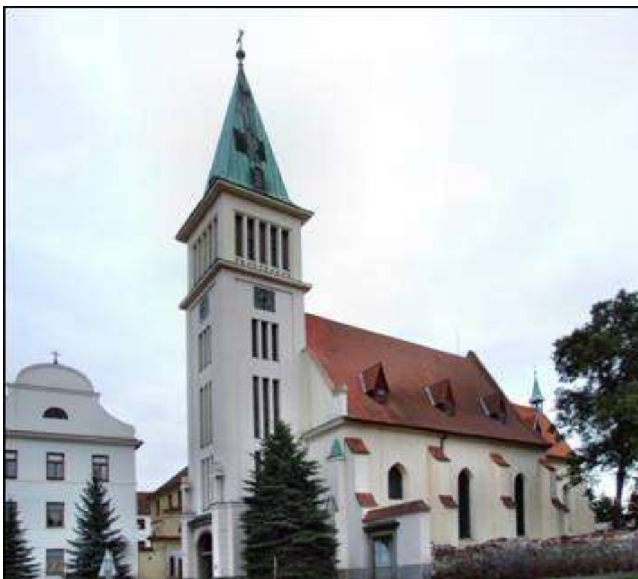
Obr. 12/ Kostel Panny Marie.