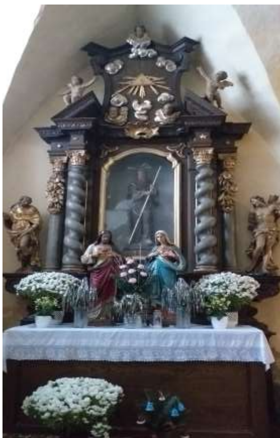
Obr. 21/ Oltář sv. Františka z Pauly.