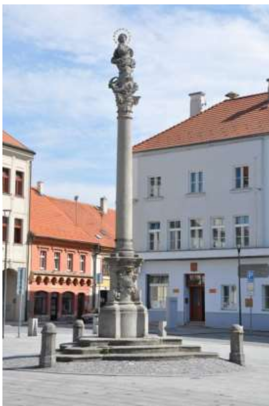
Obr. 5/ Mariánský sloup na Mírovém náměstí.