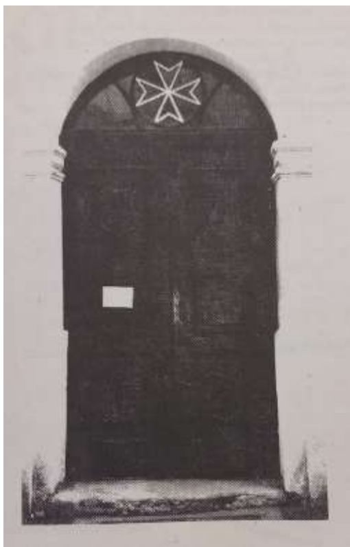
Obr. 13/ Dveře kostela sv. Petra a Pavla s jejich znaky.