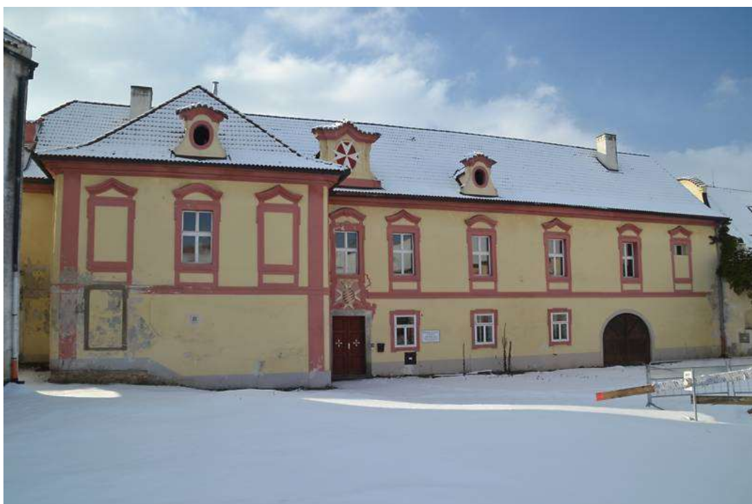
Obr. 10/ Děkanství. [Zdroj: Památkový katalog, dostupné z: https://pamatkovykatalog.cz/pravni-ochrana/dekanstvi-131669 , vyhledáno: 1.5. 2024]