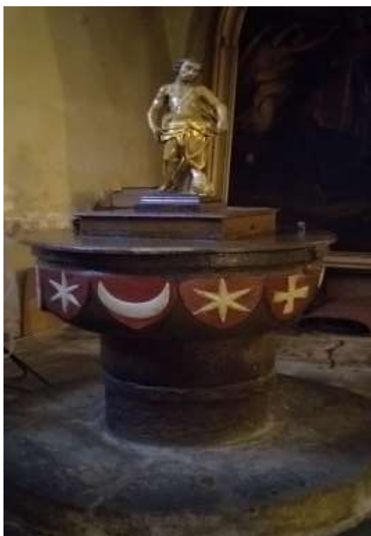
Obr. 23/ Gotická křtitelnice.