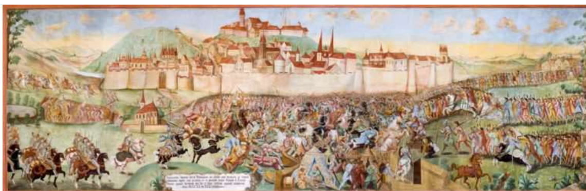
Obr. 8/ Nástrovní freska Velkého sálu, pohled na Horažďovice.