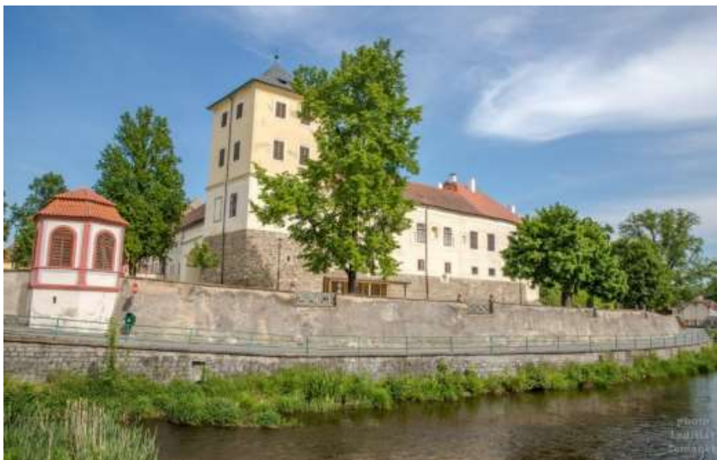
Obr. 7/ Zámek v Horažďovicích, pohled od řeky.