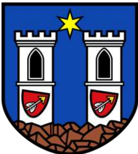
Obr. 16/ Znak města Horažďovice.