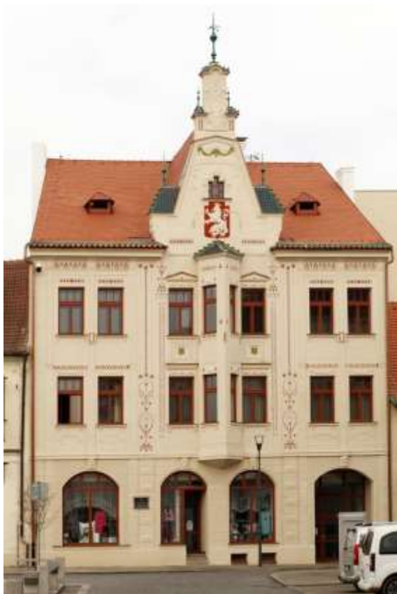
Obr. 3/ Dům č. p. 19 na Mírovém náměstí v Horažďovicích.