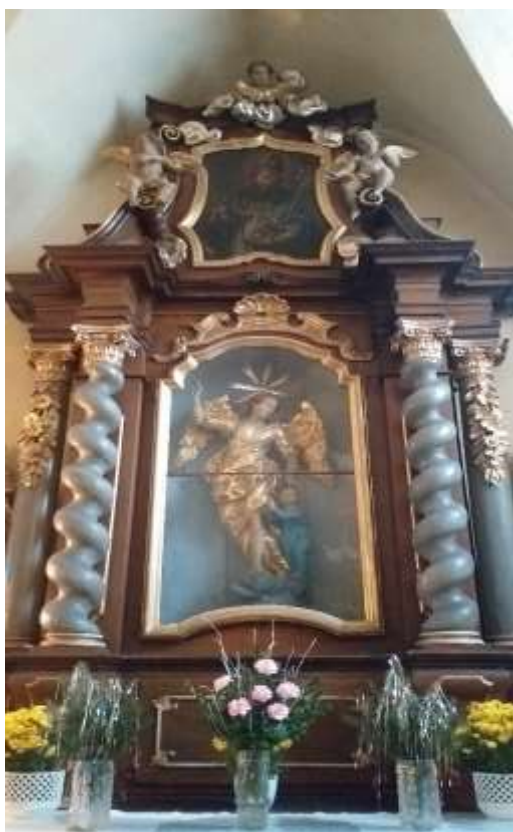
Obr. 22/ Oltář zasvěcený Andělu Strážci.