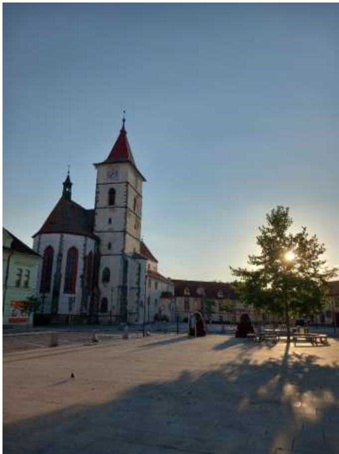
Obr. 2/ Pohled na kostel z náměstí.