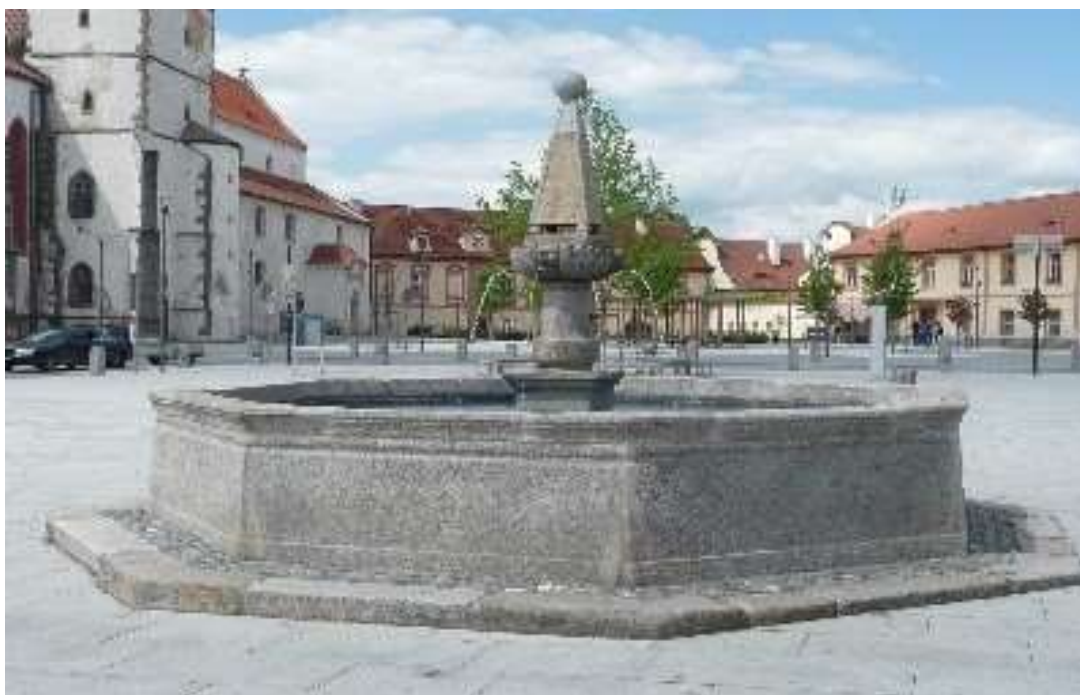
Obr. 6/ Kašna na Mírovém náměstí v Horažďovicích.