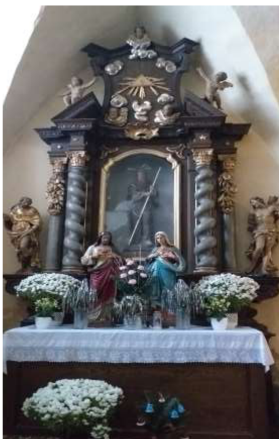
Obr. 21/ Oltář sv. Františka z Pauly.