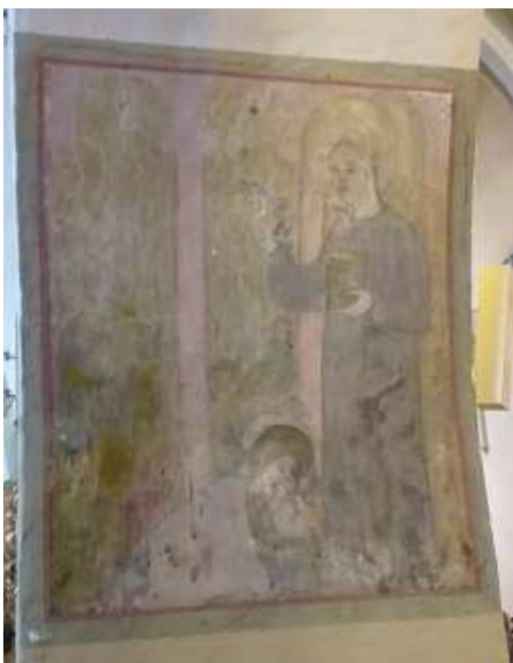
Obr. 19/ Nástěnná malba.