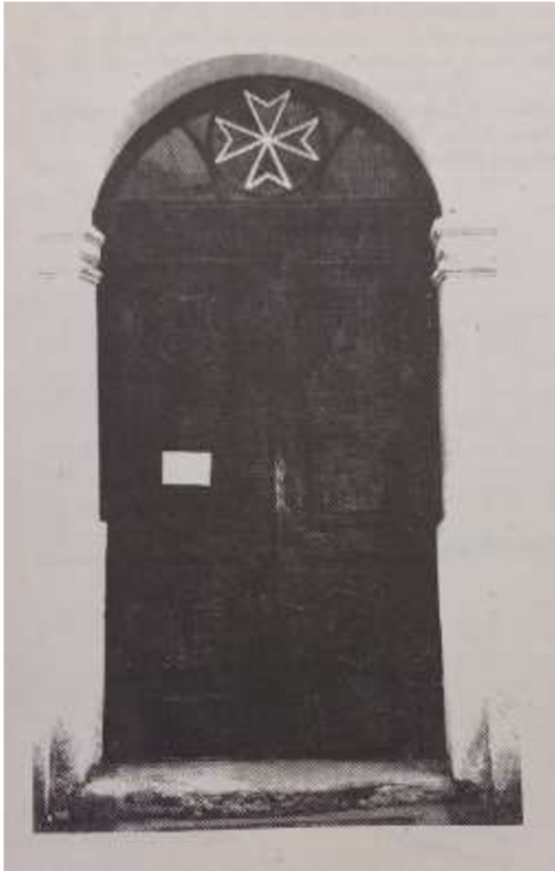
Obr. 13/ Dveře kostela sv. Petra a Pavla s jejich znaky.