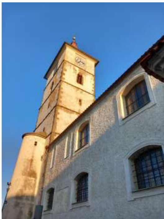
Obr. 25/ Kostel sv. Petra a Pavla, pohled na věž a přístavek se schodištěm.