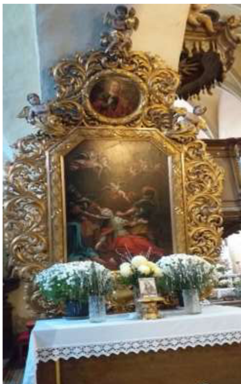
Obr. 20/ Oltář sv. Ludmily.