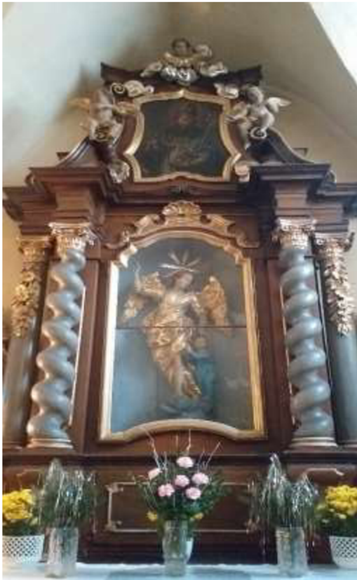
Obr. 22/ Oltář zasvěcený Andělu Strážci.