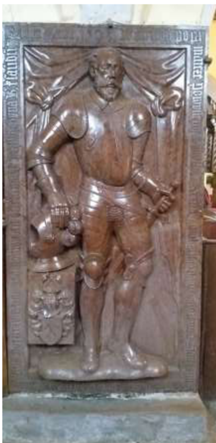
Obr. 24/ Náhrobek Adama Šice.