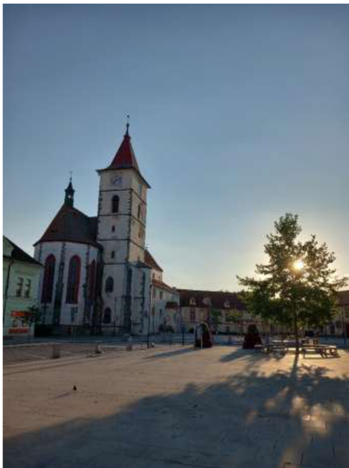
Obr. 2/ Pohled na kostel z náměstí.