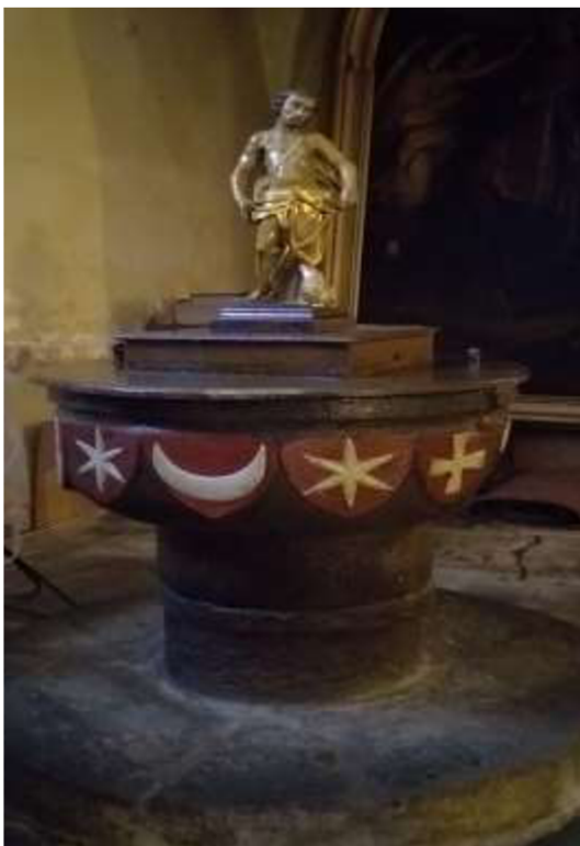
Obr. 23/ Gotická křtitelnice.