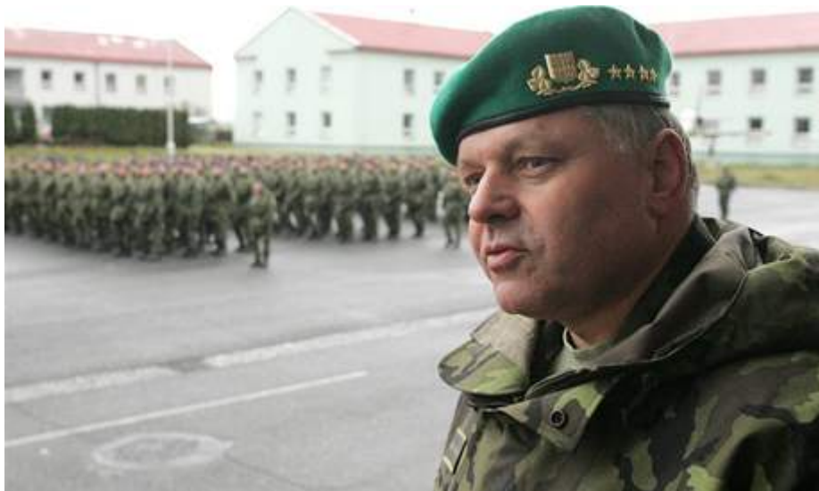
Generál Pavel Štefka

Případ korupce a mrhání peněz v armádě se vrací k bývalému šéfovi generálního štábu Pavlu Štefkovi. Po skupině důstojníků čelí i on nepříjemnému podezření. Inspekce ministryně obrany Vlasty Parkanové prověřuje, zda se protizákonně neobohatil o 600 tisíc korun.