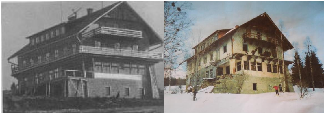
Obr. 3: Pešlova chata r. 1938 a obr. 4: Pešlova chata z roku 1991