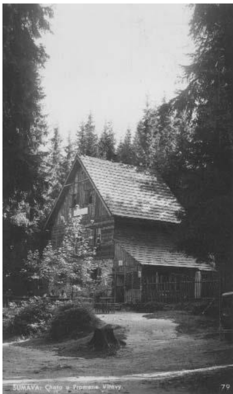
Obr. 2: Chata u Pramenů Vltavy, rok 1935

Po zřízení zahraničního pásma zůstala opuštěná a v roce 1953 byla definitivně zbourána. Dodnes jsou ale na některých místech patrné zbytky základů chaty (kolektiv, 2003:728).