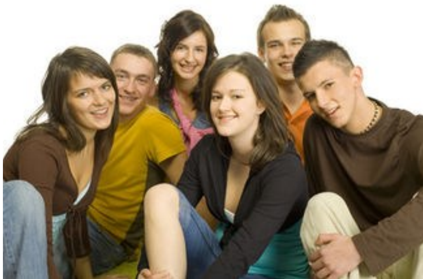
Obrázek č. 1: Děti (Zdroj: https://www.substitucni-lecba.cz/novinky/drogove-nebezpeci-muze-na-dospivajici-ci-hat-temer-vsude-240 ).

„Hledejte potěšení v dětech, dopřejte dětem, aby se mohly potěšit s vámi, a bez odkladů užívejte každou radost.“