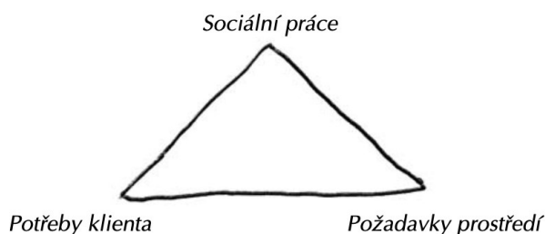
Schéma č. 1: Pozice sociálního pracovníka mezi klientem a jeho prostředím (Janebová, 2007, s. 76).

Následující schéma znázorňuje danou definici: