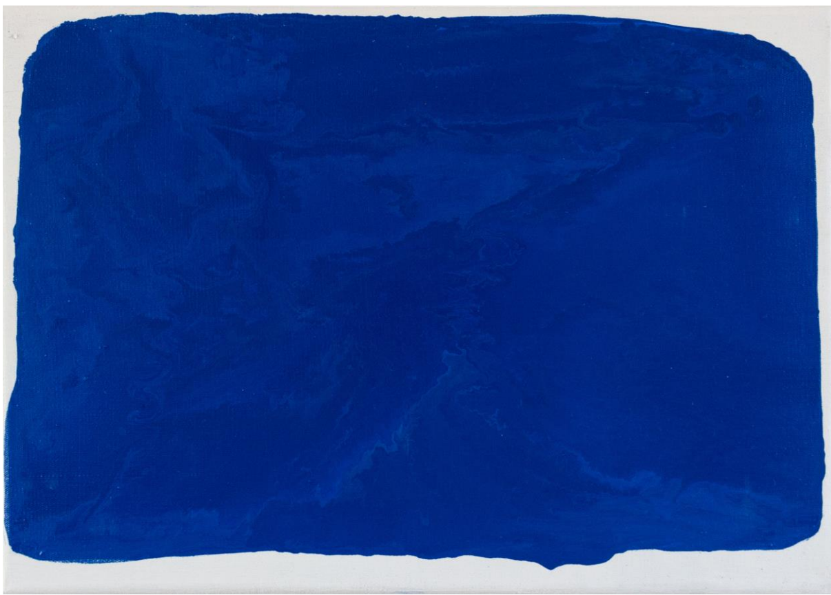
Bahňák , balakryl na plátně, 50 x 35 cm, 2019