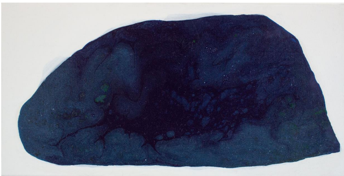
Tůňka , balakryl a malířské barvy na plátně, 60 x 30 cm, 2019