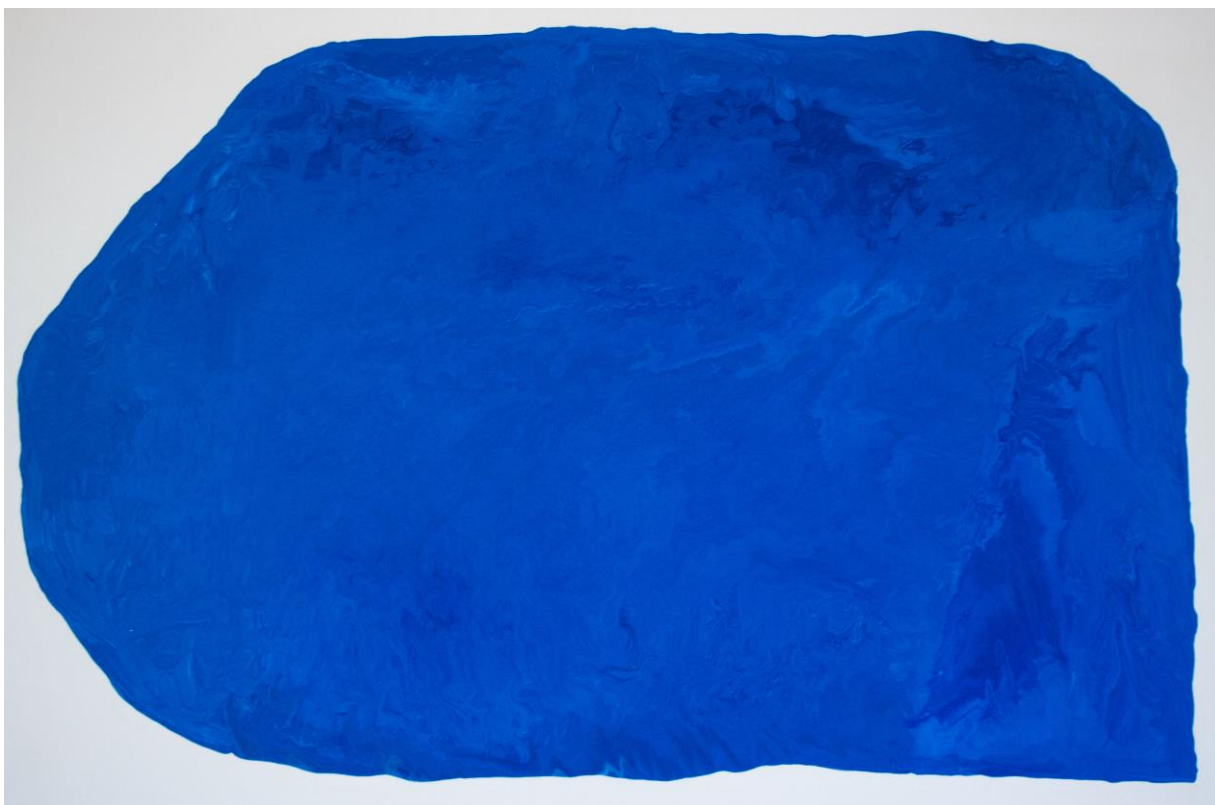
N1 , balakryl na plátně, 95 x 145 cm, 2019