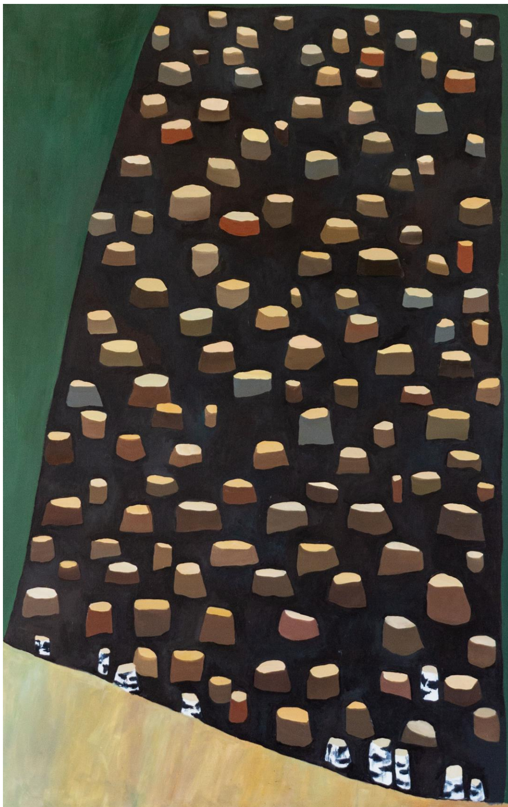
Díra po lesu v zatáčce (1), olej na plátně, 85 x 135 cm, 2019