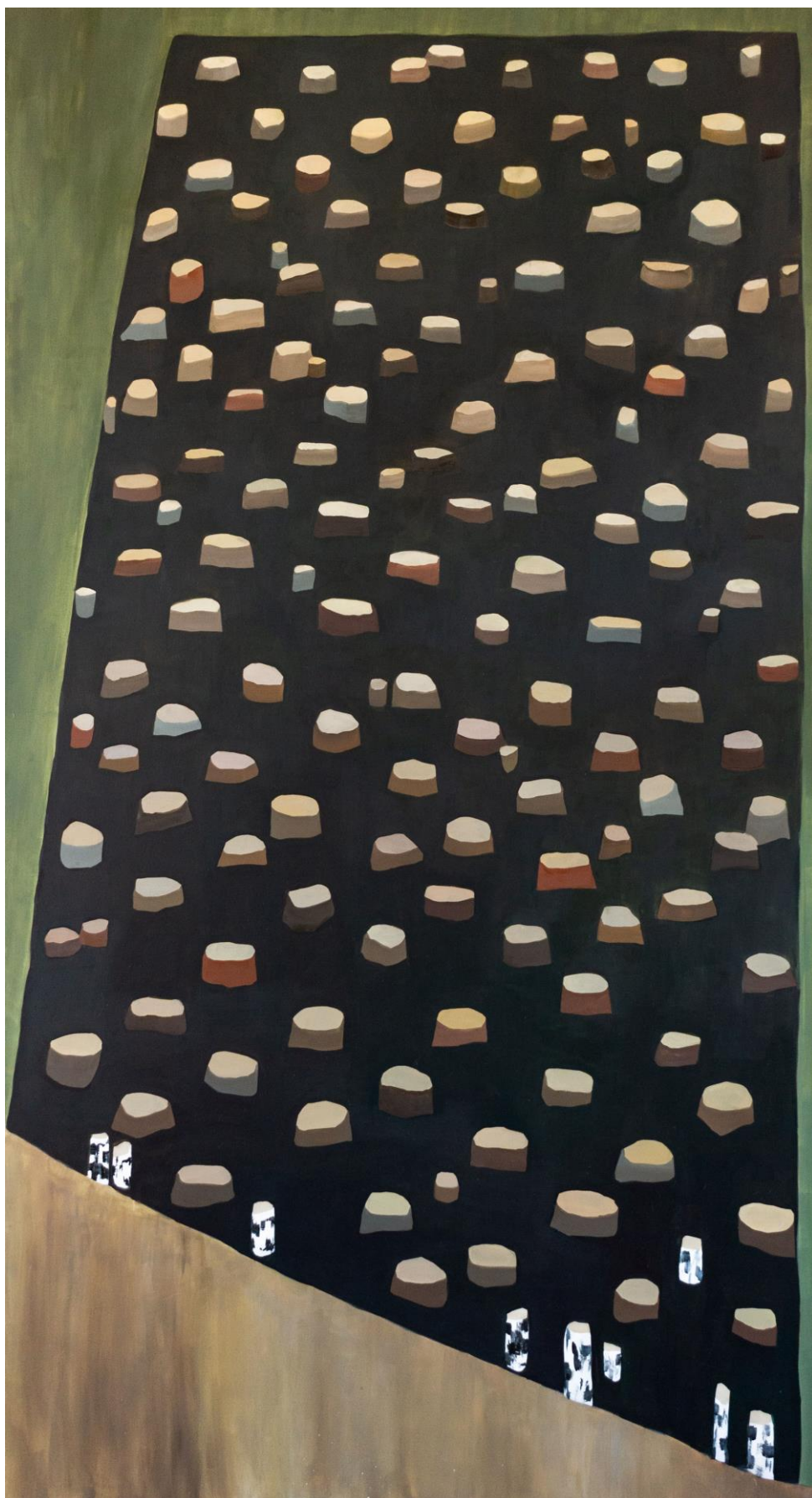
Díra po lesu v zatáčce (2), olej na plátně, 120 x 220 cm, 2019