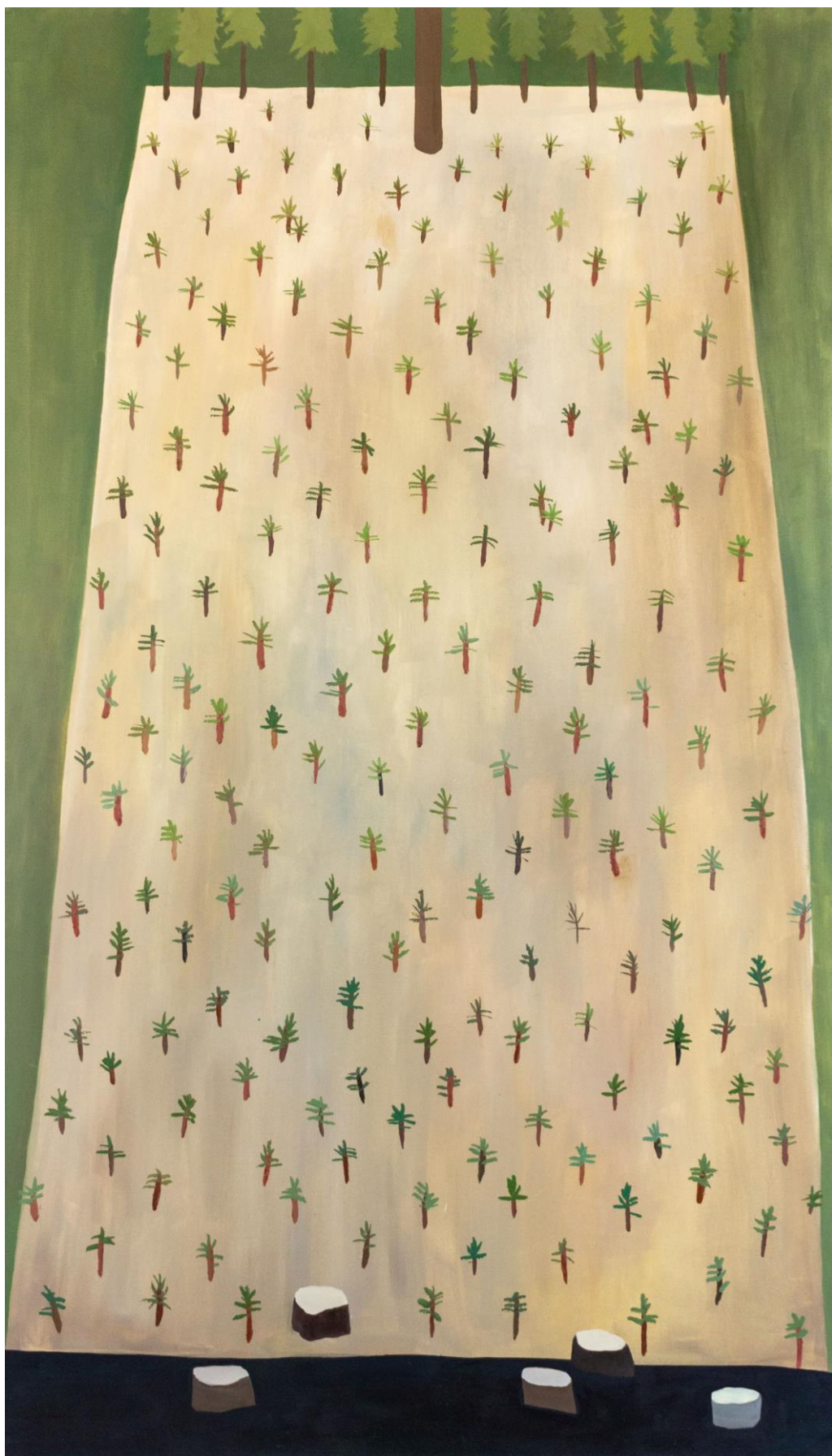
Náš les – tři generace, olej na plátně, 115 x 200 cm, 2019