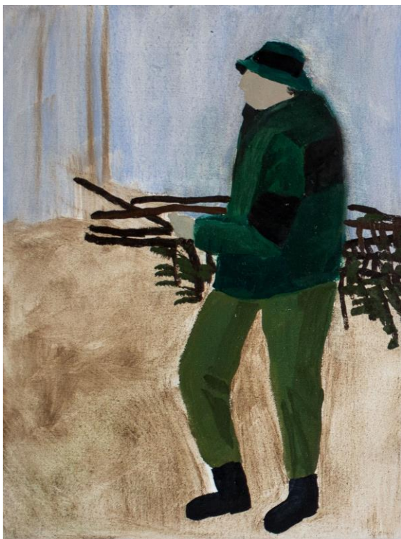
Lesní scény – taťka, olej na plátně, 30 x 40 cm, 2019 - rozpracované