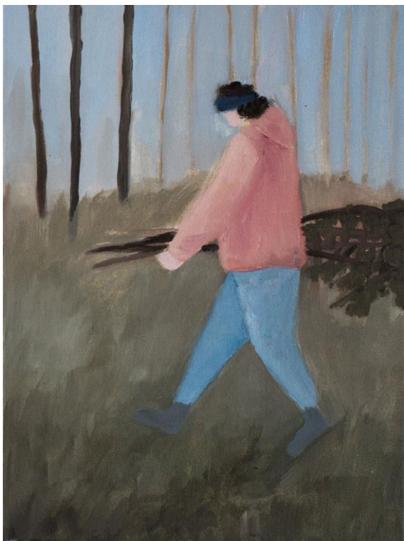
Lesní scény – mamka, olej na plátně, 30 x 40 cm, 2019