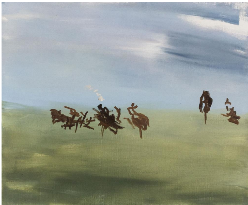
Srnky , olej na plátně, 80 x 65 cm, 2018