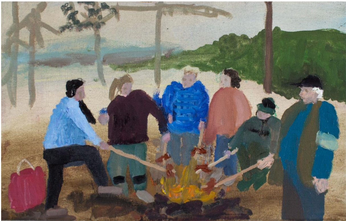
Lesní scény – přestávka, olej na plátně, 30 x 40 cm, 2019