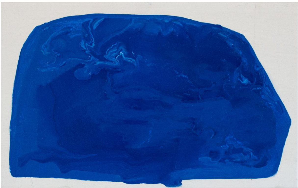
Horňák , balakryl na plátně, 40 x 25 cm, 2019