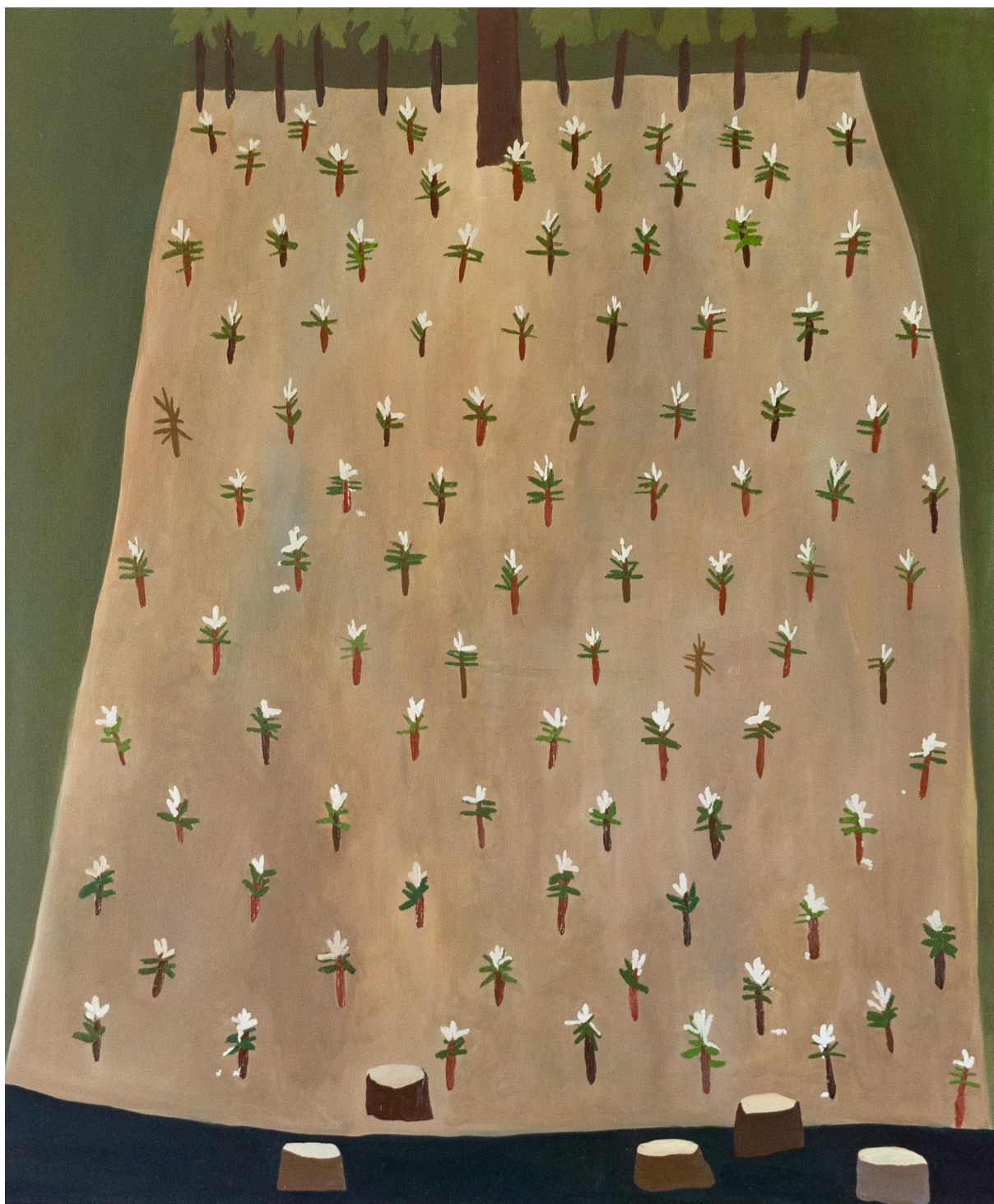
Náš les – natřené stromky, olej na plátně, 105 x 125 cm, 2019