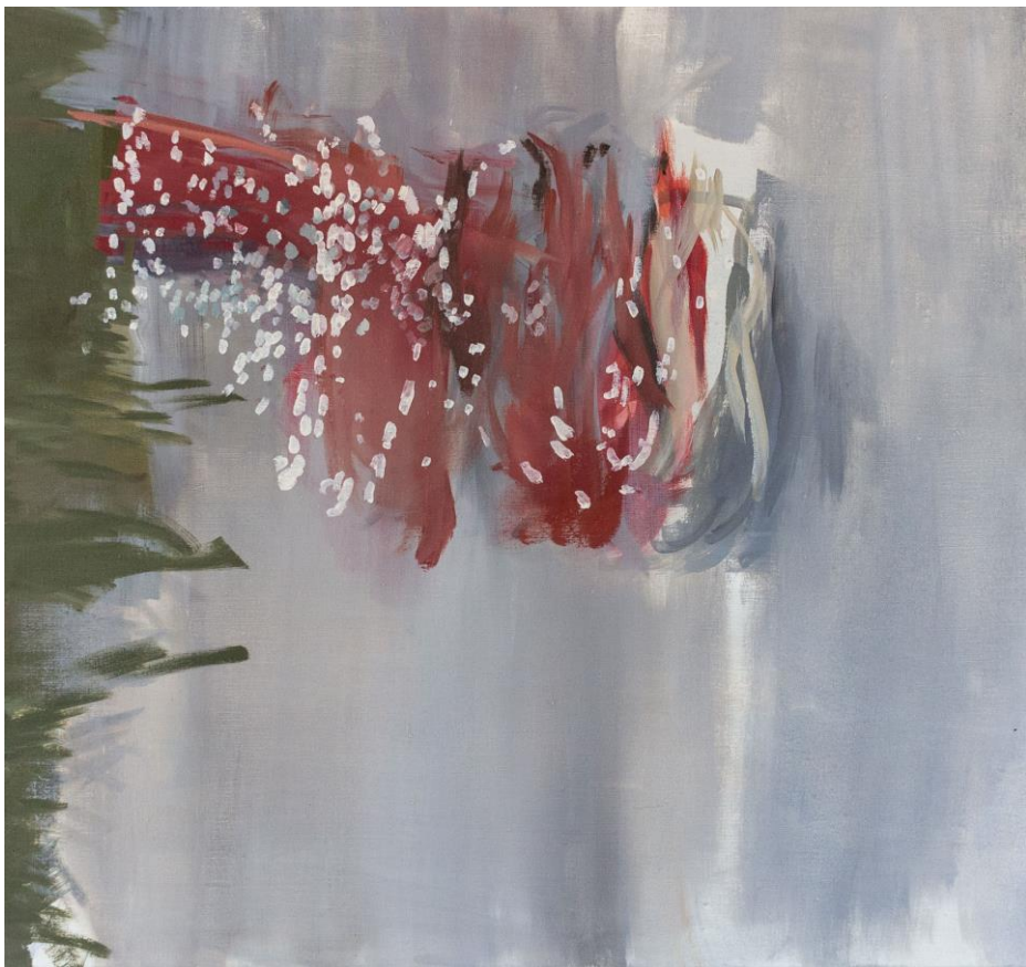
Holinky , olej na plátně, 90 x 85 cm, 2018