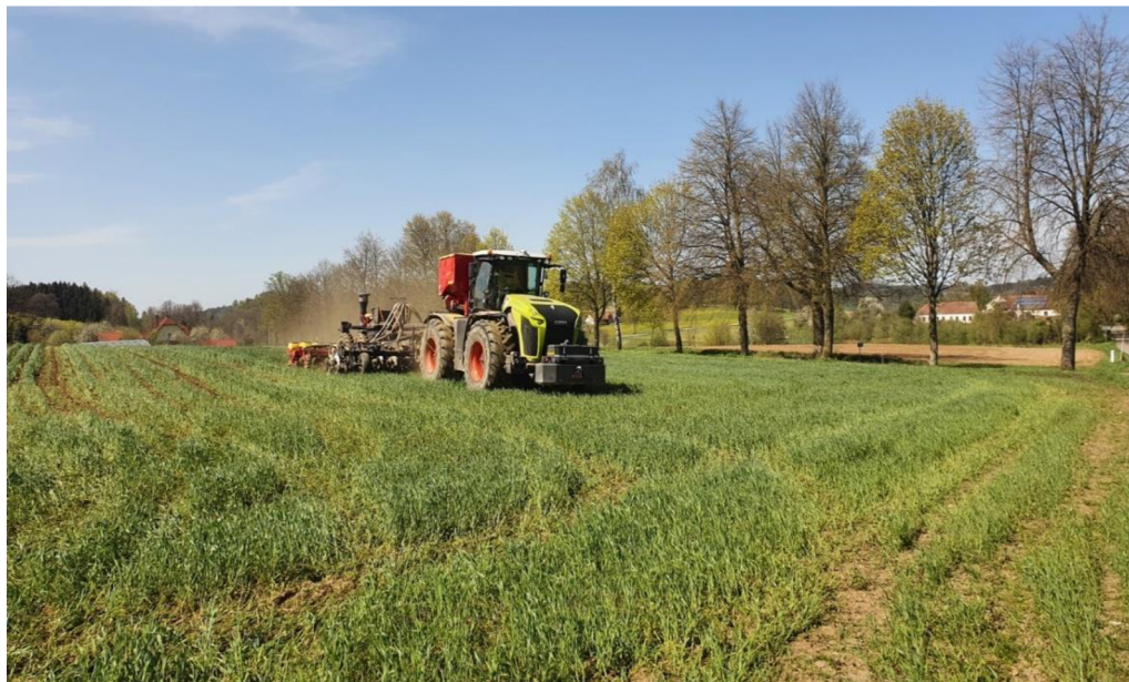
Obrázek 4.5: Založení porostu kukuřice pásovou technologií

Tak jako u konvenční technologie bude zjišťován výnos. Vážena musí být každá souprava předtím, než vjede do silážní jámy. Hmotnost prázdné bude odečítána od plné soupravy pro zjištění hmotnosti řezanky v návěsech. Poté se všechny váhy sečtou a následně vydělí výměrou pozemku pro zjištění výnosu na hektar.