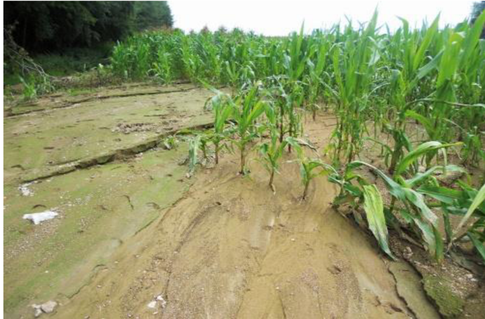
Obrázek 1.1: Vodní eroze