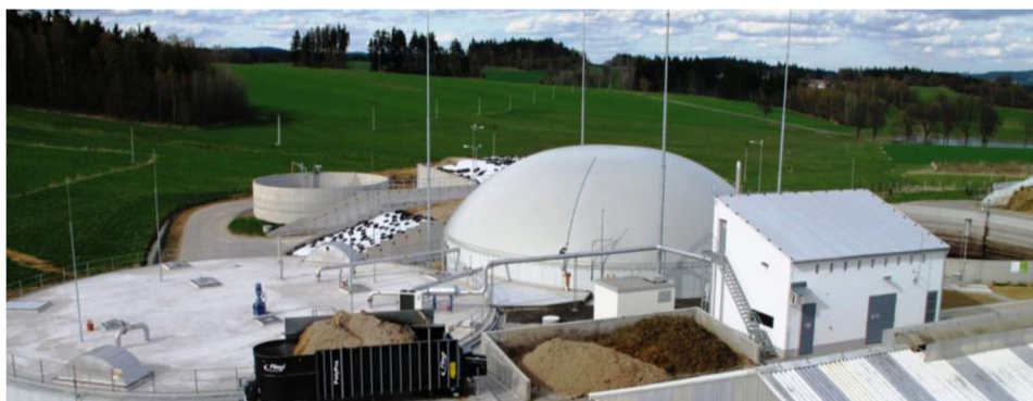
Obrázek 4.1: Rozvodí spol. s r.o. Černov (rozvodi.cz, 2018)

Při výběru pokusných pozemků bude kladen důraz na to, aby měly pozemky co nejpodobnější klimatické podmínky, svahovitost a složení půdy.