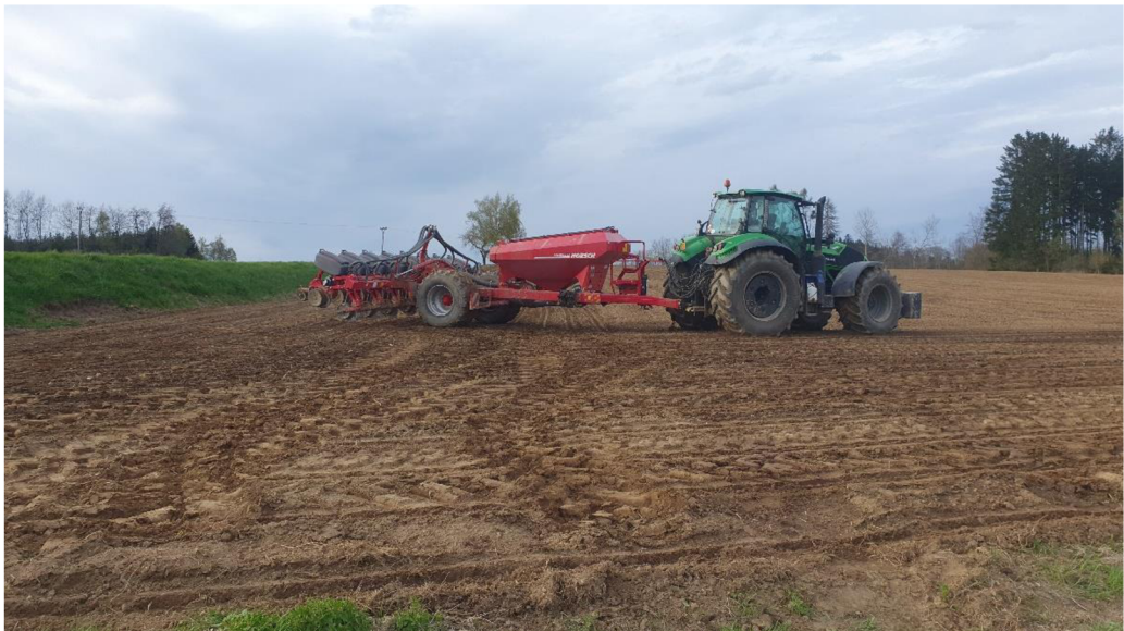
Obrázek 2.2: Přesný secí stroj Horsch