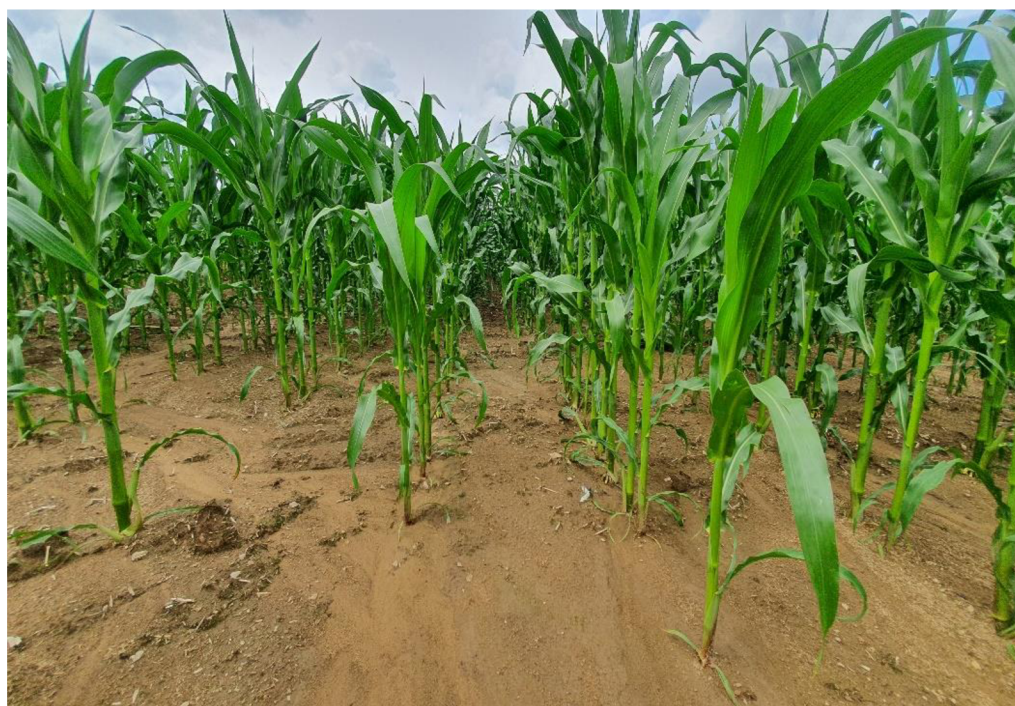
Obrázek 5.2: Erozně ohrožená půda zpracovávaná konvenční technologií