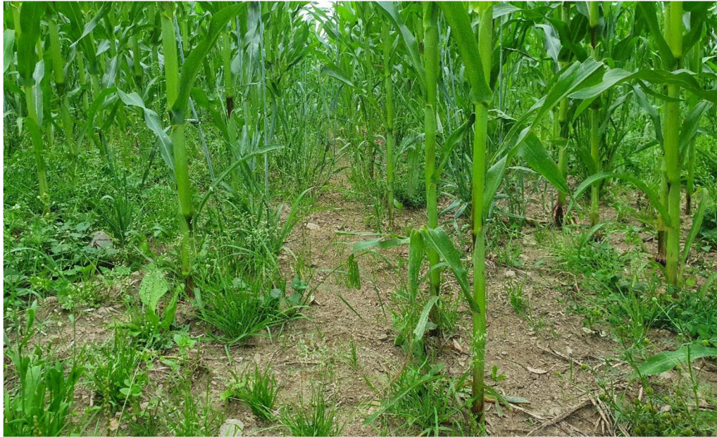
Obrázek 5.3: Půda zpracovávaná pásovou technologií