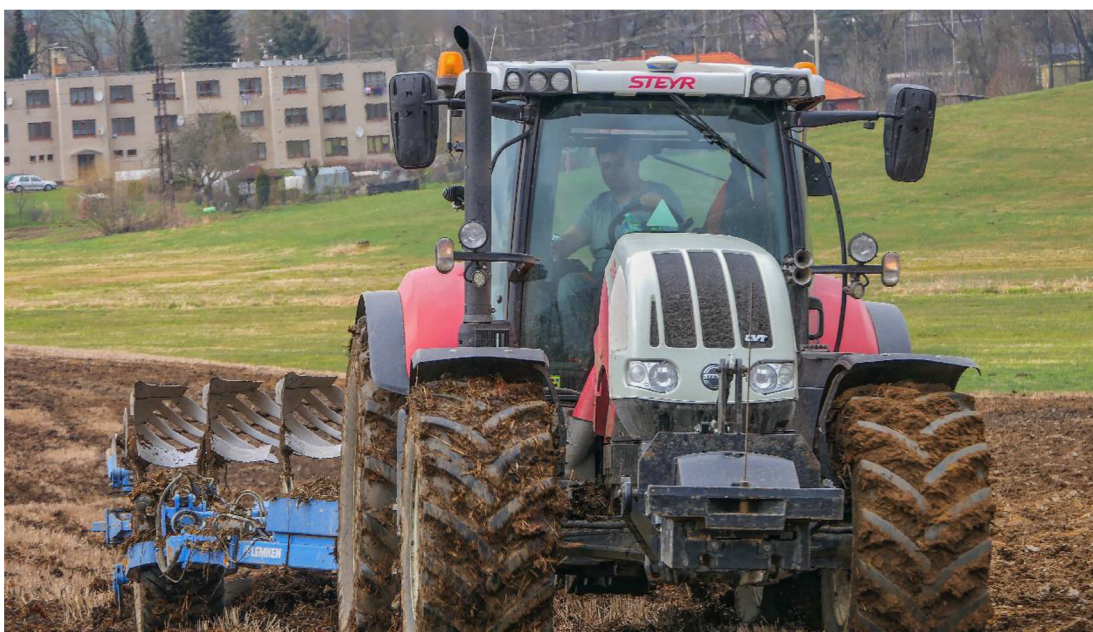
Obrázek 2.1: Orební souprava

se v různých částech světa velmi liší, bylo nutné vyvinout tvary vhodné pro dané podmínky. Pluhy měly původně jednu radlici, později jich přibilo více. Velké pluhy mají dnes obvykle dvanáct i více radliček. Existují dva základní principy konstrukce pluhu: jednostranný a oboustranný. První typ otáčí půdu pouze jedním směrem. Pokud je potřeba změnit směr a otočit se na okraji pole, je třeba použít oboustranný pluh složený ze dvou zrcadlových ploch. Zpočátku byl pluh obvykle namontován na závěs. S vývojem tříbodové hydrauliky se zrodil i nesený pluh, který je pevně sprážen s traktorem a tvoří s ním jeden funkční celek. S nárůstem velikosti pluhů bylo nutné vyvinout opěrný mechanismus, který nese váhu celého pluhu. Vznikl tak polonesený pluh vybavený vlastním mechanismem působení (Dörflinger, 2009).