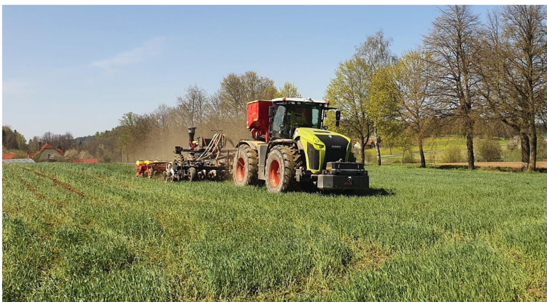
Obrázek 3.1: Secí souprava pásové technologie

Celosvětově jsou vyvíjeny a hledány nové technologie zpracování půdy, které by byly ekonomické, energetické a šetrné k půdě. Hlavně v evropských podmínkách bereme v úvahu eliminaci degradačních procesů půdy, eroze, omezení technologického zhutnění, zvýšení infiltrační schopnosti půdy a podpory půdní struktury. V tomto případě není dobré používat klasické konvenční zpracování půdy. Z tohoto důvodu bylo vymyšleno pásové zpracování půdy. Technologie pracuje na principu zpracování půdy v místě budoucího výsevu následující plodiny s eventuální aplikací cílených živin. Technologie se využívá u širokořádkových plodin jako je kukuřice, slunečnice, čirok, cukrová řepa, nebo řepka ozimá. U těchto vysévaných plodin se pohybuje vzdálenost řádků mezi 40 až 80 centimetry (Brant, 2016).