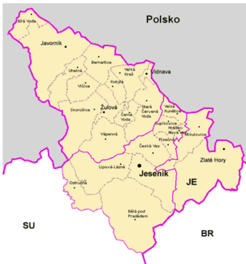
Obrázek č. 1: Mapa Olomouckého kraje