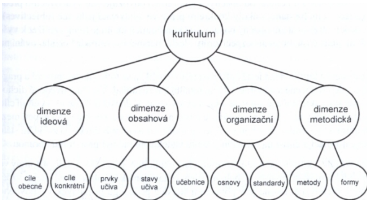
Obrázek č. 1: Dimenze současného kurikula (Maňák, 2008)

Státní úroveň vzdělávacích dokumentů v České republice dělíme na dvě úrovně, státní a školní. Do státní úrovně kurikulárních dokumentů spadá Národní vzdělávací program (dále jen „NVP“) a Rámcový vzdělávací program (dále jen „RVP“).