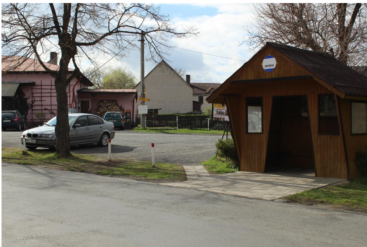
Obrázek č. 26 – Detailní pohled na autobusovou zastávku