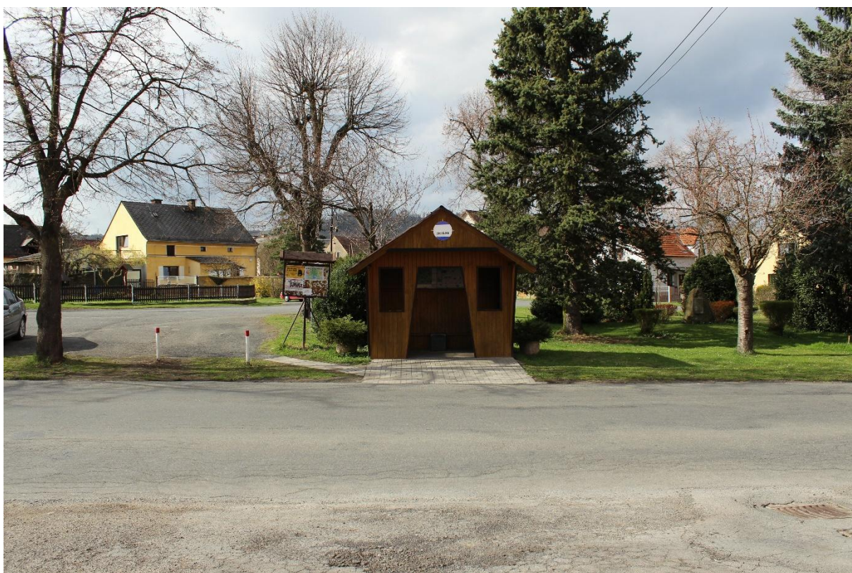
Obrázek č. 28 – Pohled na zastávku a narušený povrch před obecním úřadem