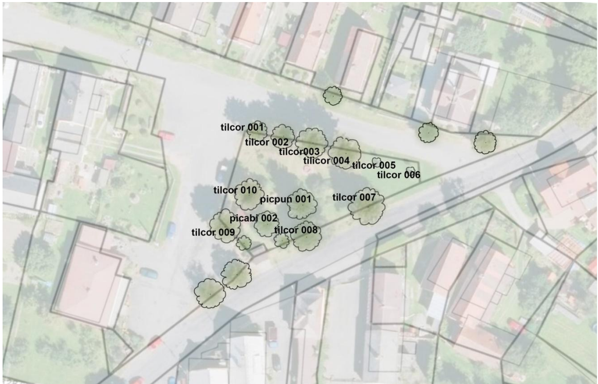
Obrázek č. 30 – Mapa inventarizace centrálního prostoru obce – stromy