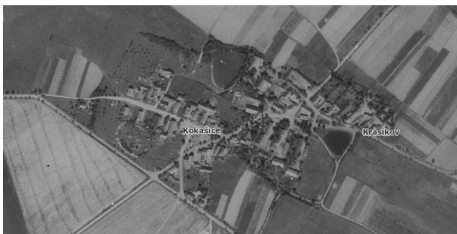
Obrázek č. 7 Historické ortofoto z 50. Let