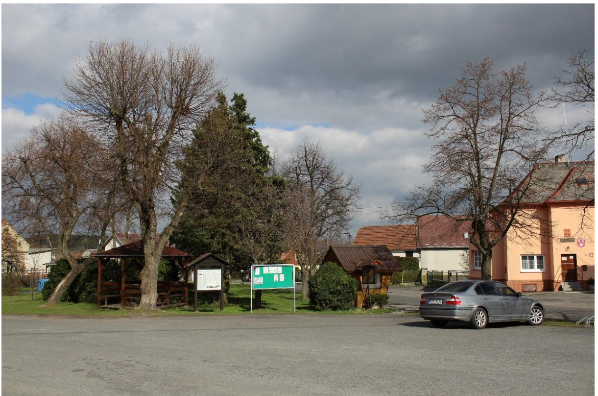
Obrázek č. 16 – Pohled na informační tabule obce a na asfaltové neznačené parkoviště