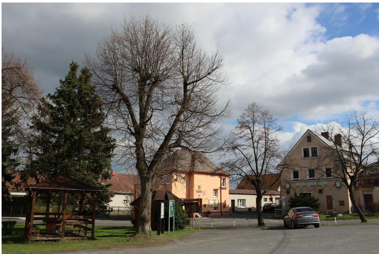
Obrázek č. 17 – Pohled na asfaltové neznačené parkoviště a na dřevěný altán