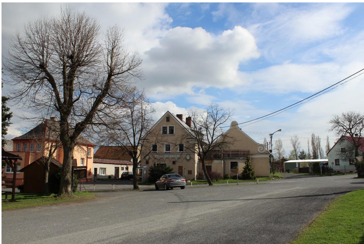
Obrázek č. 19 – Pohled na vyasfaltovanou část návsi