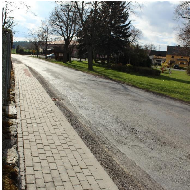
Obrázek č. 24 – Detailnější pohled na hlavní silnici s chodníkem