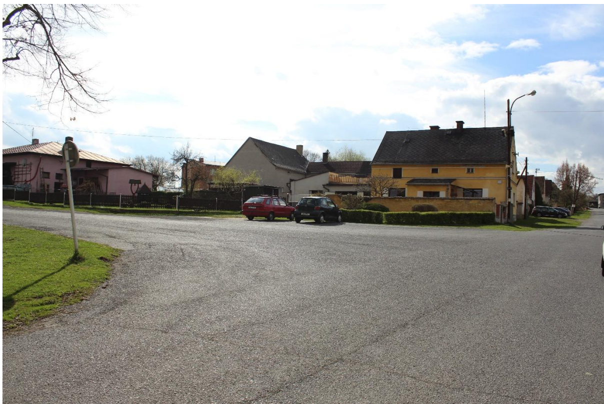
Obrázek č. 21 – Pohled na vyasfaltovanou část návsi a navazující obytnou komunikaci