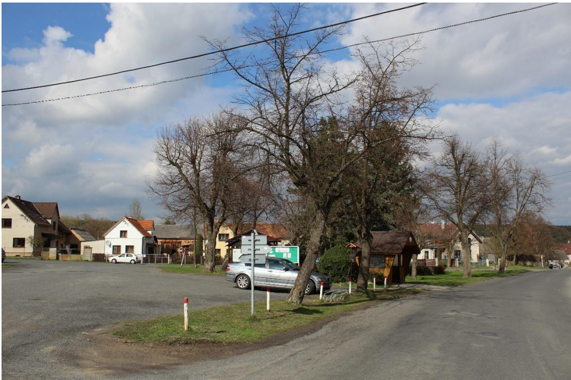
Obrázek č. 15 – Pohled na hlavní silnici, vyasfaltovanou část návsi, která je na několika místech znatelně narušená a prořídlý trávník zastoupený v nízkém procentu