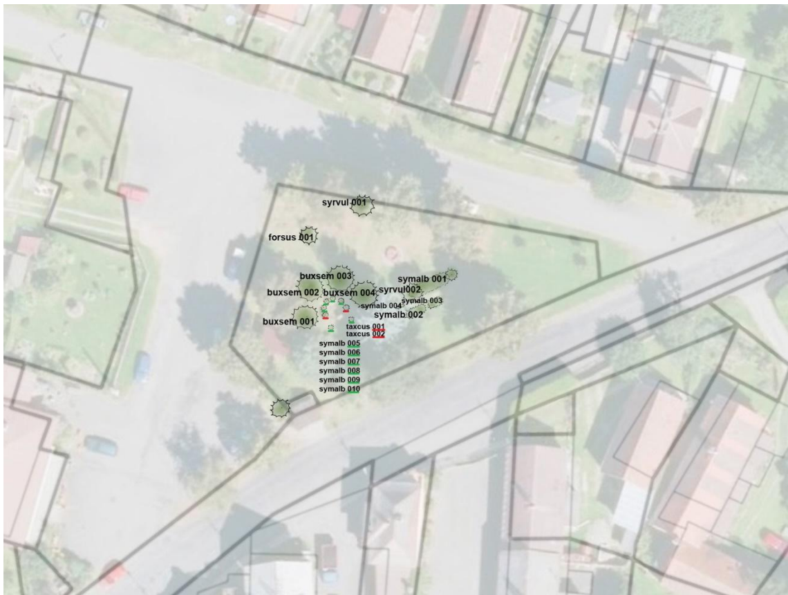
Obrázek č. 31 – Mapa inventarizace centrálního prostoru obce – keře