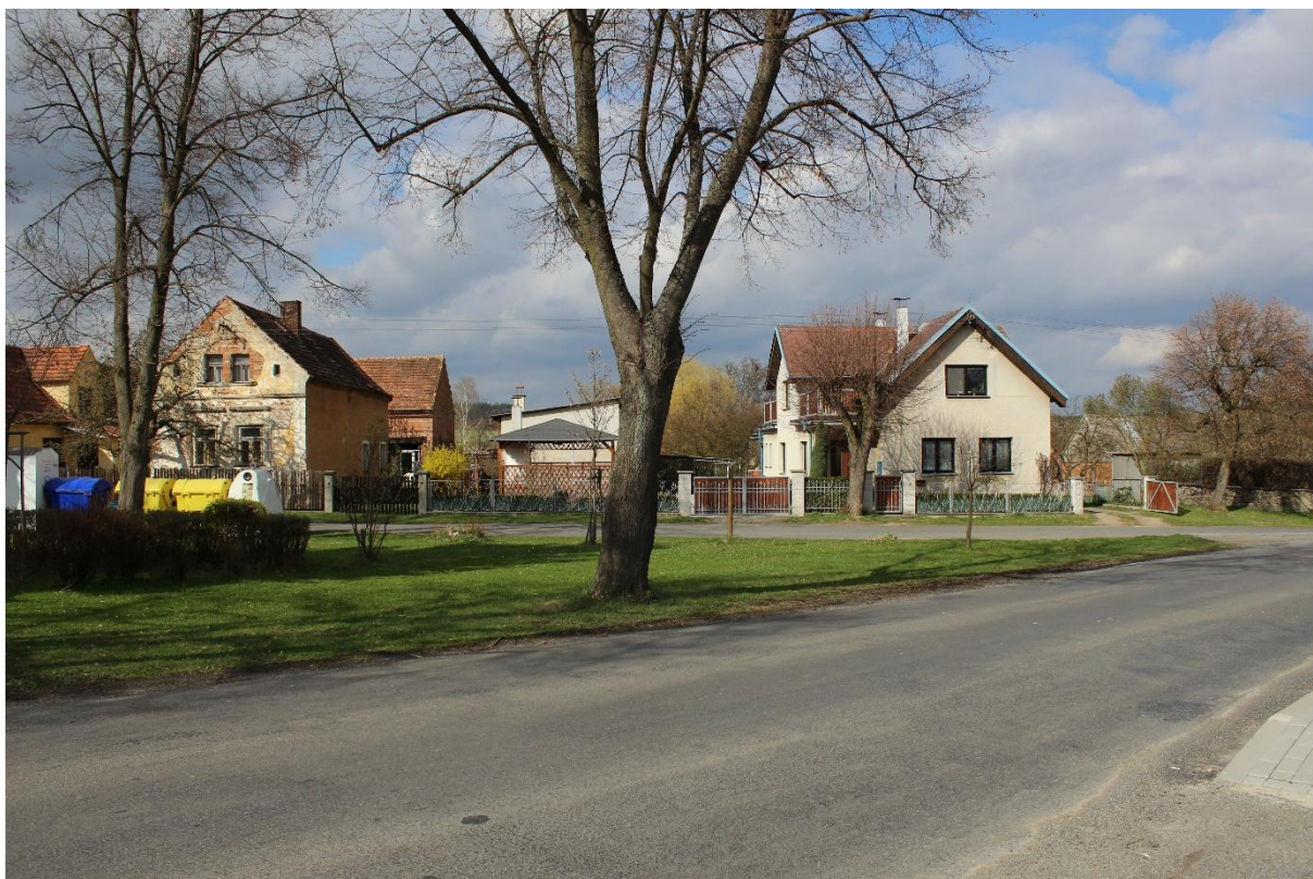
Obrázek č. 25 – Pohled na hlavní silnici a fasády rodinných domů a usedlostí