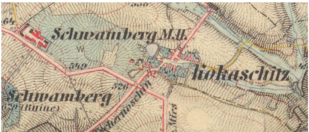
Obrázek č. 10 - Třetí vojenské mapování