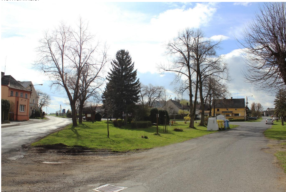
Obrázek č. 22 – Pohled hlavní silnici z druhého konce návsi. Narušenou asfaltovou komunikaci a mobiliář (dětské hřiště a kontejnery na odpad)