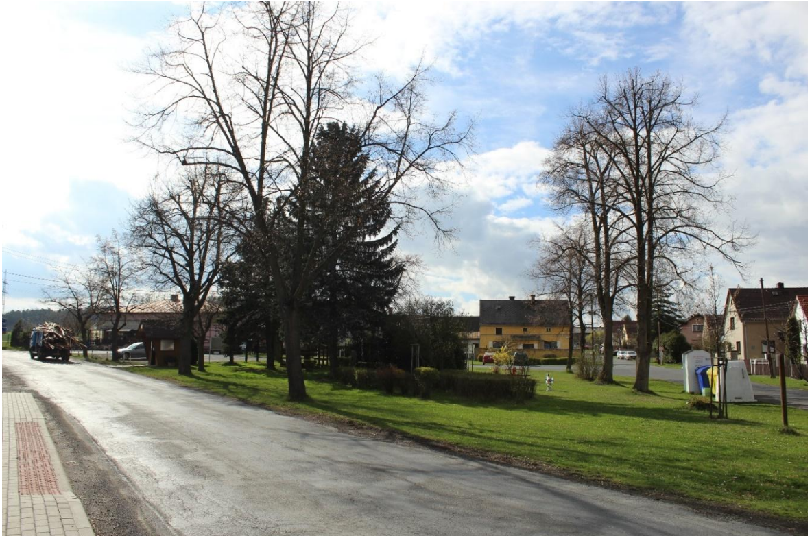
Obrázek č. 23 – Pohled na hlavní silnici s chodníkem