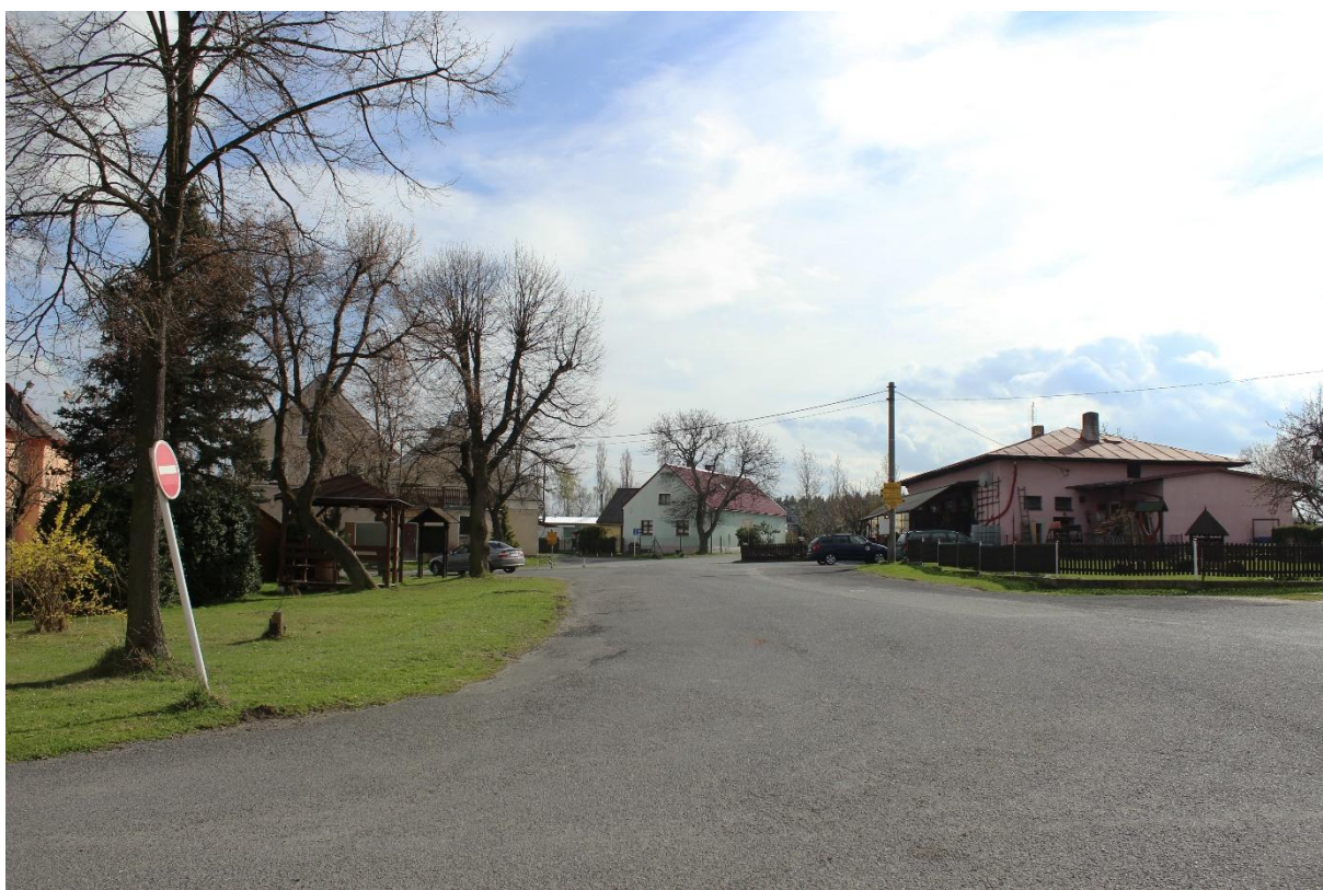
Obrázek č. 20 – Pohled na vyasfaltovanou část návsi