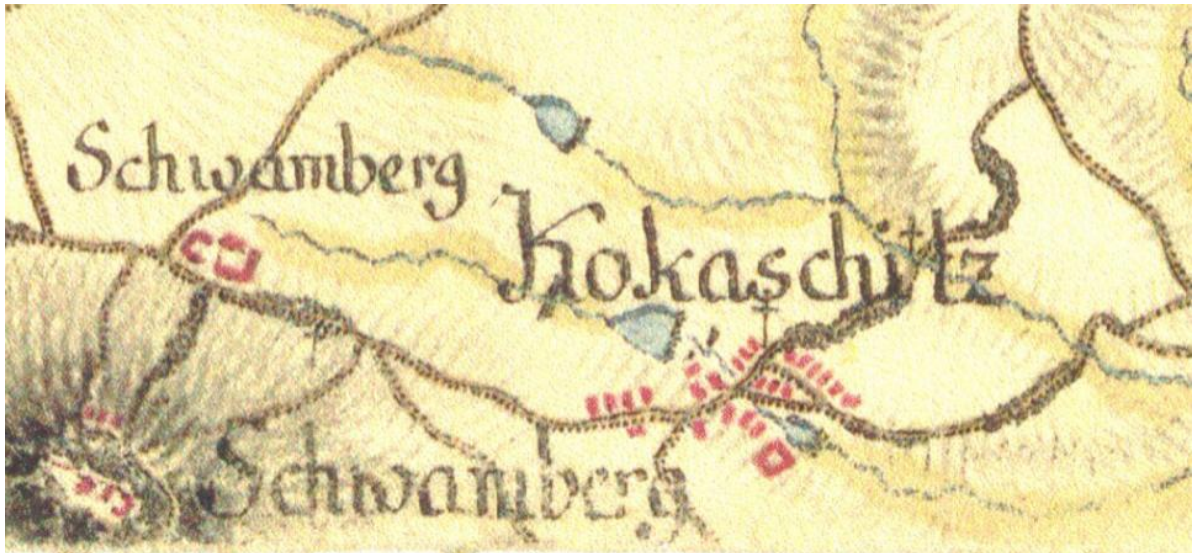
Obrázek č. 8 - První vojenské mapování