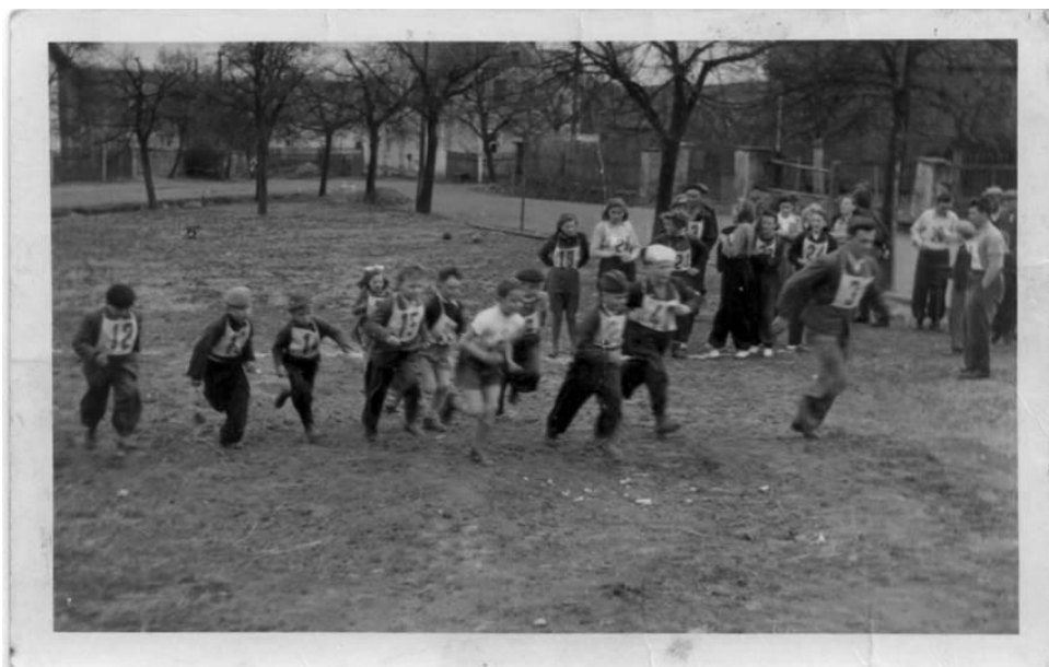
Obrázek č. 5 Návés se závodícími dětmi