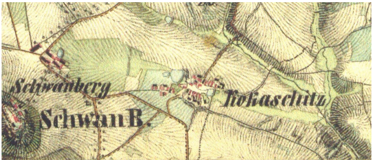
Obrázek č. 9 - Druhé vojenské mapování