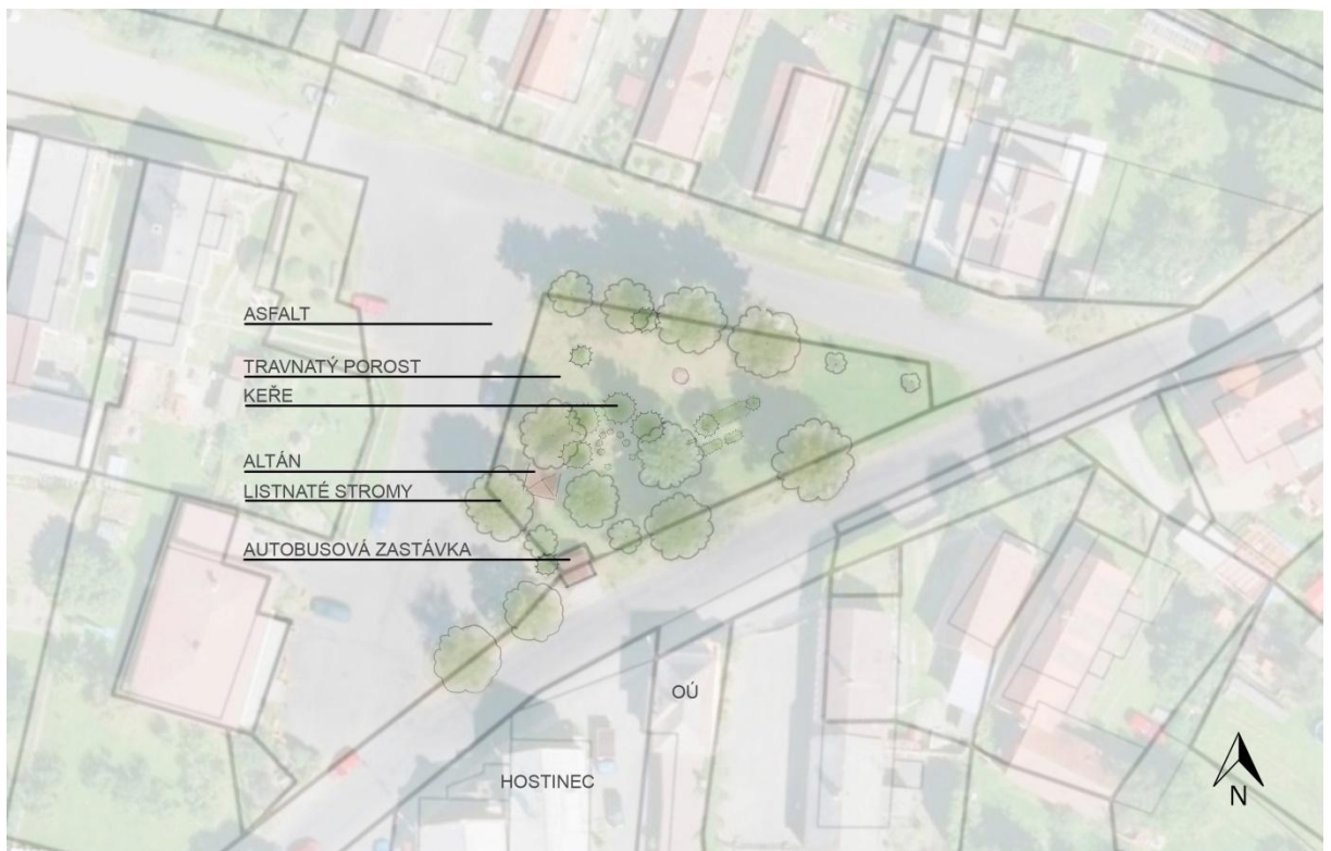
Obrázek č. 13 – Půdorys návěsného prostoru s legendou v měřítku 1:1000