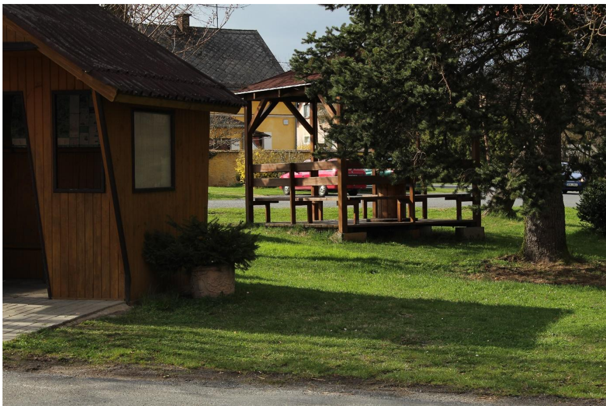
Obrázek č. 27 – Pohled na zadní stranu altánku