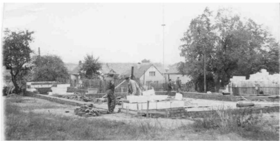
Obrázek č. 6 Stavba smíšeného zboží na návsi