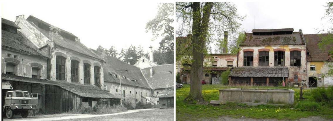
Obrázek č. 2 – Petrův dvůr, historická fotografie a současná fotografie

Typickým příkladem samoty je Petrův Dvůr v okolí Netolic.