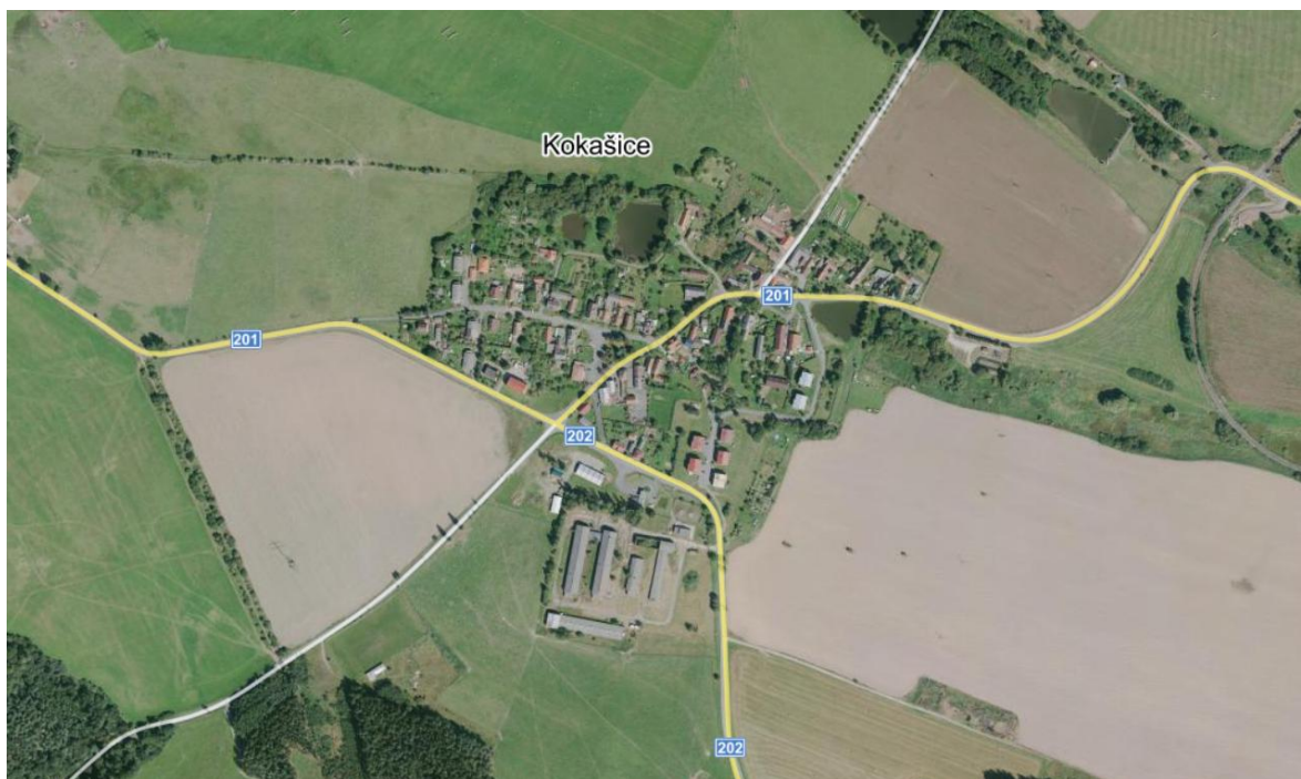
Obrázek č. 29 – Ortofoto s vyznačením hlavních silnic procházející obcí

V řešení dopravního stavu se nachází spíše větší množství záporů, nežli kladů. Aktuálně z jedné strany návěs lemuje jedna dvoupruhová průjezdná komunikace II. třídy č. 201, která spojuje Kokašice s okolními vesnicemi. Takovéto řešení je absolutně chybné z toho důvodu, že centrální prostorem vesnice by neměly procházet silnice prvních a druhých tříd. Tato silnice nemá jasně vymezené jízdní pruhy a má poměrně úzký chodník pro pěší, pouze po jedné straně. Chodník neodpovídá správně šíři na průchod dvou osob (1,5 m). Z druhých dvou stran návěs lemuje vyasfaltovaný prostor, který nevypadá esteticky dobře. Na tento prostor navazují silnice obytné, které spojují návěs s obydlení obyvatelů. Na průjezdné komunikaci č. 201 je umístěna krytá, dřevěná, autobusová zastávka. Na návsi se nevyskytuje vyznačené parkoviště, je zde pouze rozsáhlá asfaltová plocha, na které se lidé naučili svá vozidla parkovat. Ani na jedné straně průjezdné komunikace není jasně vyznačený prostor pro zastavení autobusu.