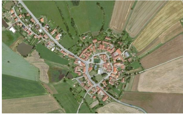
Obrázek č. 3 - Typický příklad okrouhlice