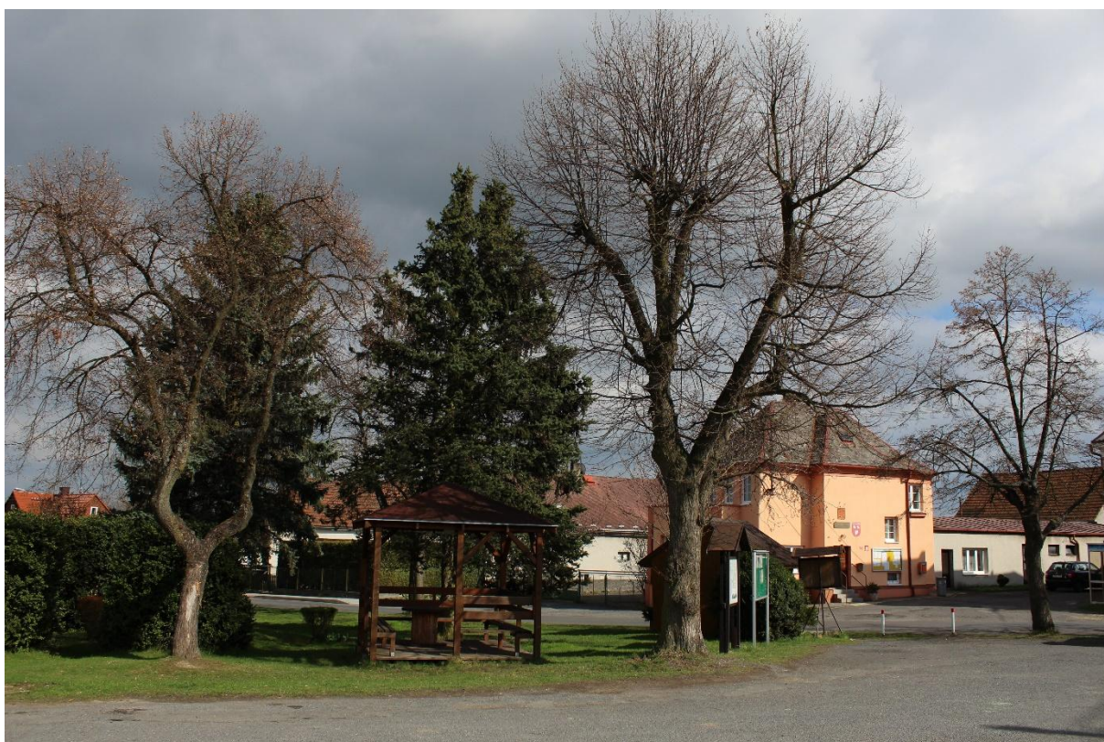
Obrázek č. 18 – Pohled na dřevěný altán a vegetaci okolo něj