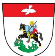
Obrázek 1 Znak obce Dolní Čermná

Obec Dolní Čermná se nachází v Pardubickém kraji, v podhůří Orlických hor. Spadá pod správní obvod Lanškroun, který je vzdálený necelých 10 km od obce. Dolní Čermná také leží 12 km od města Ústí nad Orlicí a 2,5 km od obce se nachází její místní část Jakubovice. Obcí protéká potok Čermenka, který je dlouhý asi 3 km a který se vlévá do Tiché Orlice. Tento potok dělí obec Dolní Čermnou na dvě části. Název obce je odvozen od staročeského slova čern, neboli červeň, podle červené půdy, která se nalézá v jižní části obce a ze které pramení potůčky s červeným dnem (Jansa, 2004). Obec je sídlo pro Dobrovolný svazek obcí Mikroregion Severo-Lanškrounsko 2 , jehož je také členem. Svazek je založený za účelem koordinace, ochrany a prosazování společných zájmů obcí a rozvoje regionu ( www.dolni-cermna.cz ).