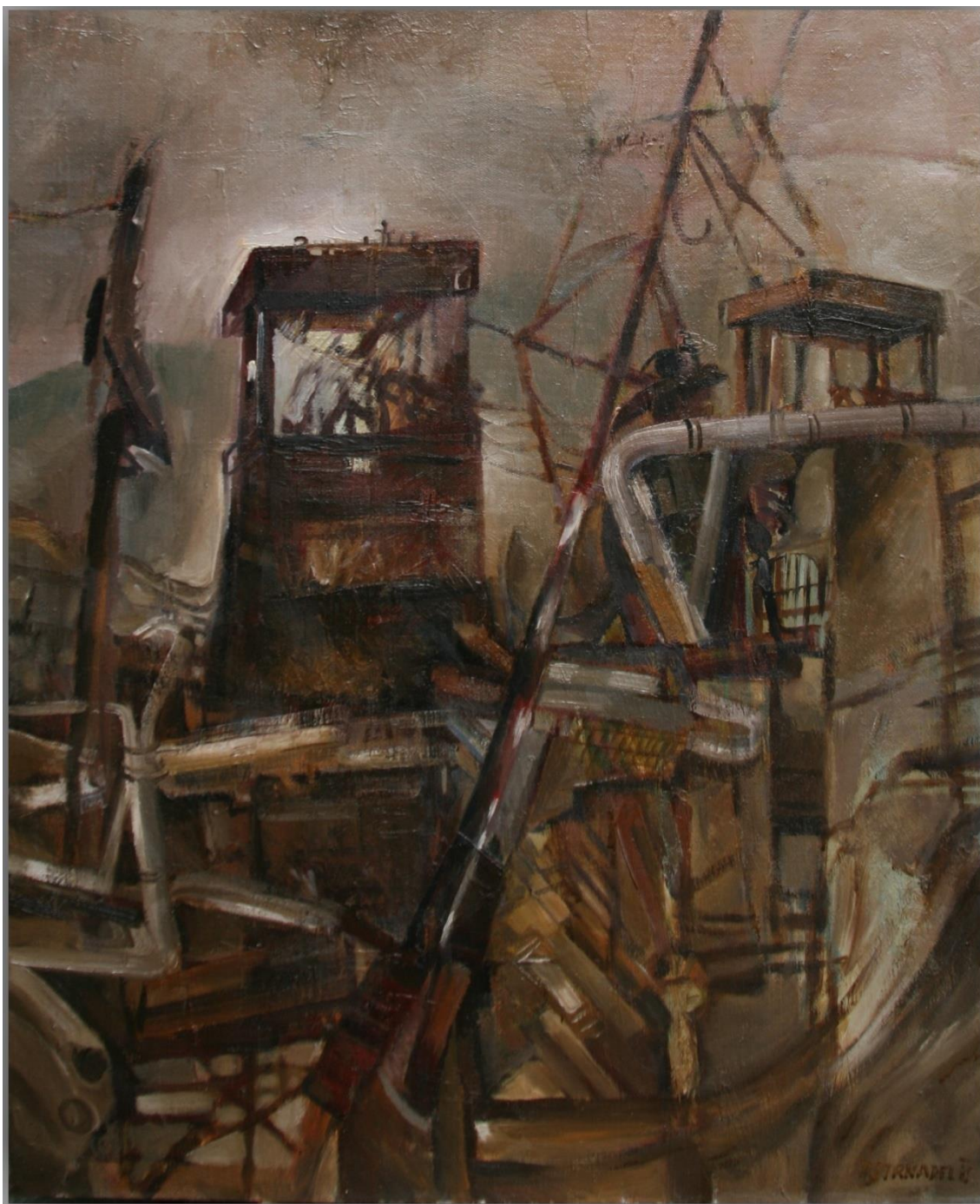
30. Pavel Strnadel, Výstavba Dolu Frenštát II, 1985, olej, plátno, 85 x 65.