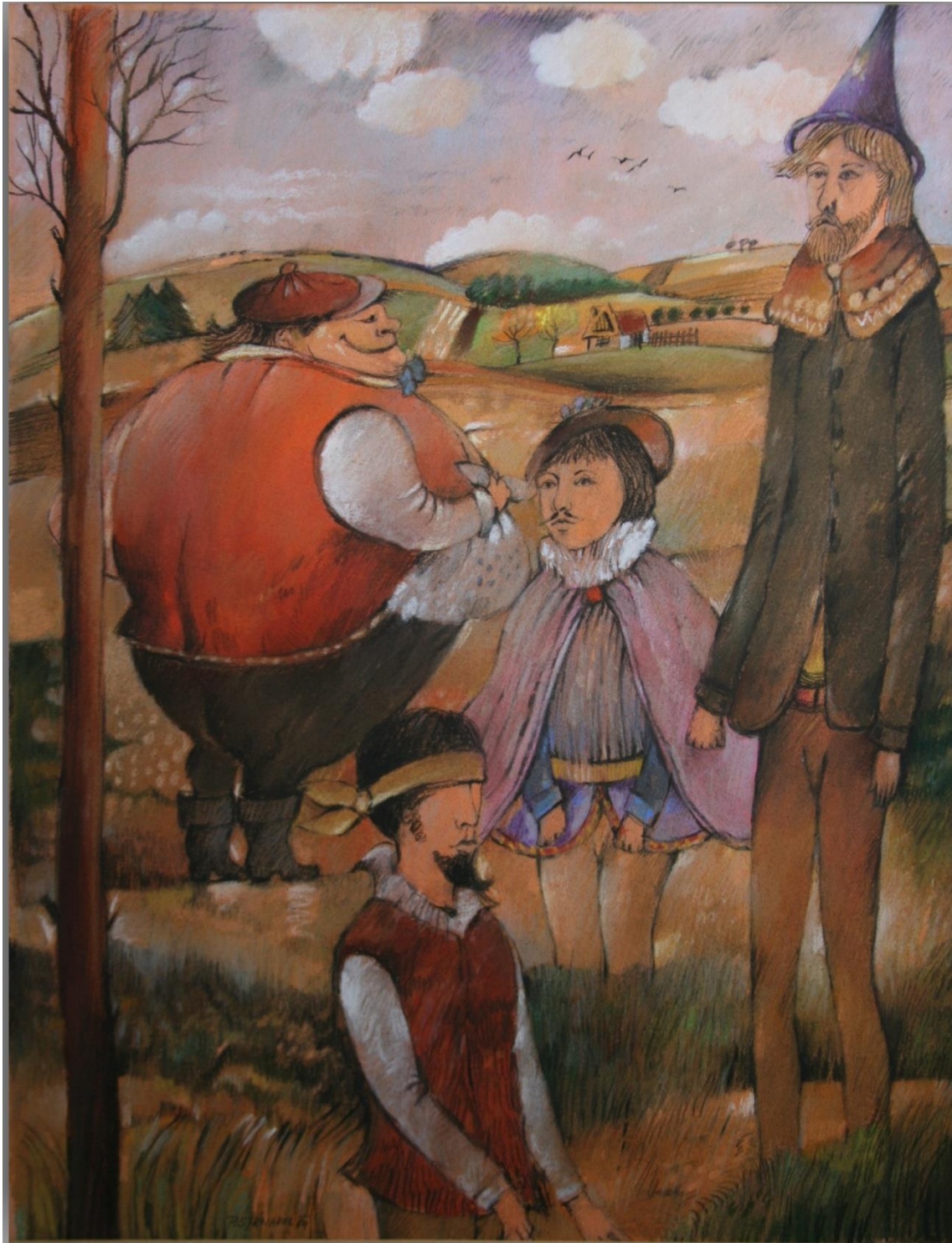
15. Pavel Strnadel, Ilustrace – K. J. Erben – Dlouhý, Široký a bystrozraký, 1989, pastel, 50 x 39 cm.