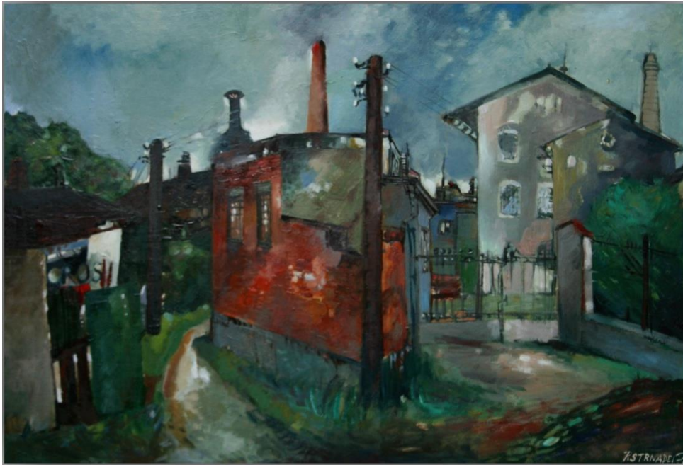
35. Pavel Strnadel, Slezan II, 1979, olej, sololit, 48 x 70 cm.