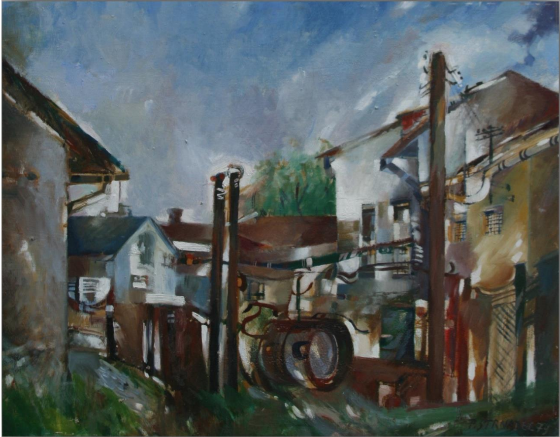
29. Pavel Strnadel, Slezan, 1979, olej, sololit, 50 x 62 cm.