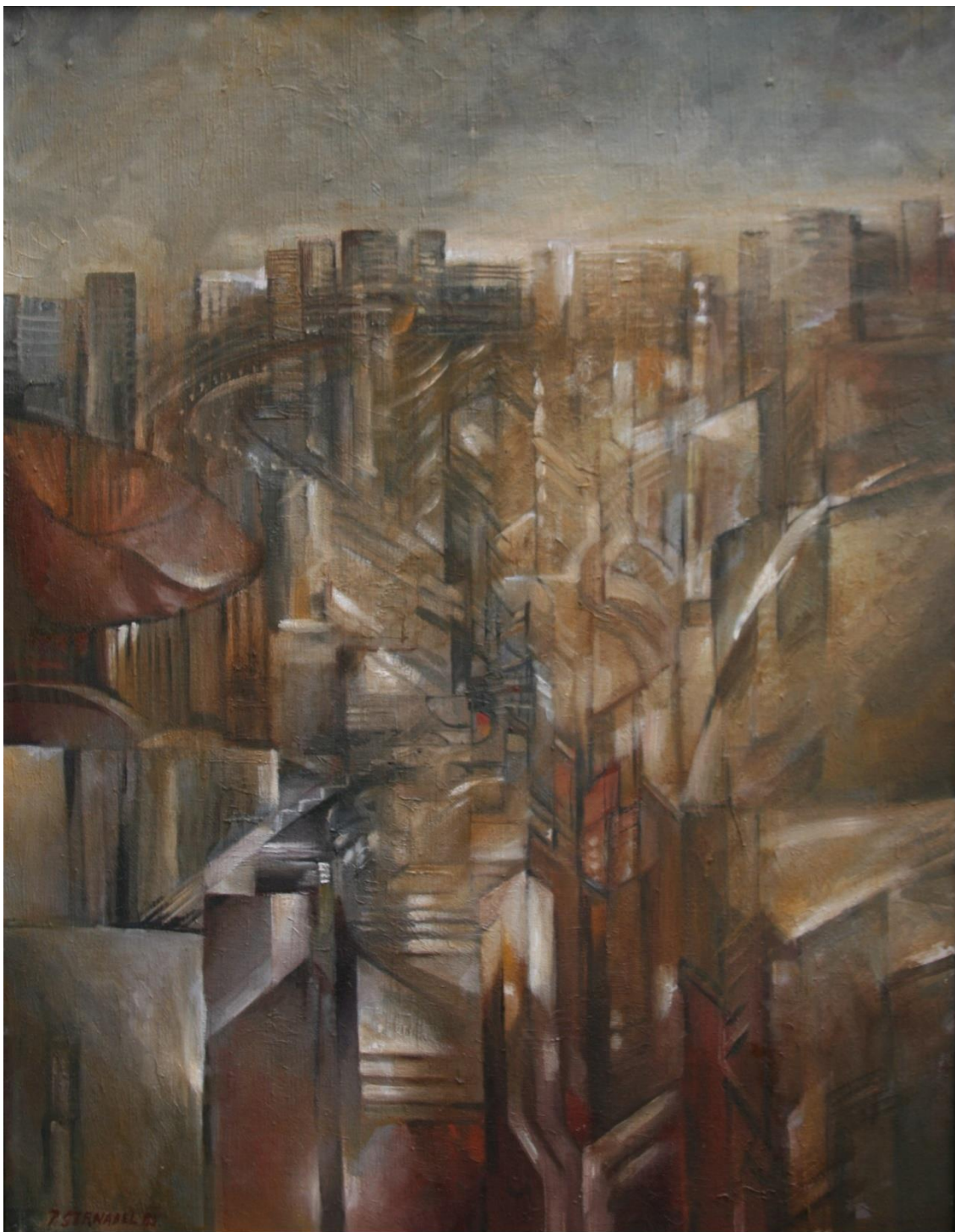
20. Pavel Strnadel, Město, 1985, olej, plátno, 85 x 65 cm.