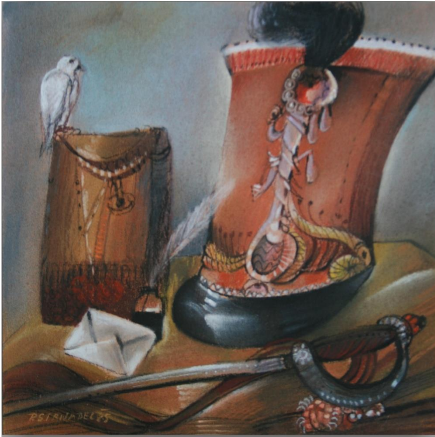
24. Pavel Strnadel, Zátiší z vojenského ležení, 1985, pastel, 35 x 31 cm.