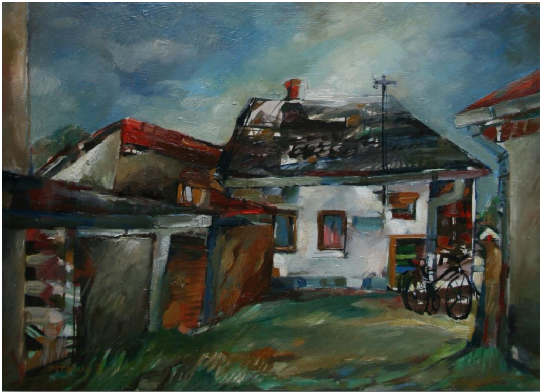
4. Pavel Strnadel, Na dvorku, 1986, olej, sololit, 40 x 55 cm.