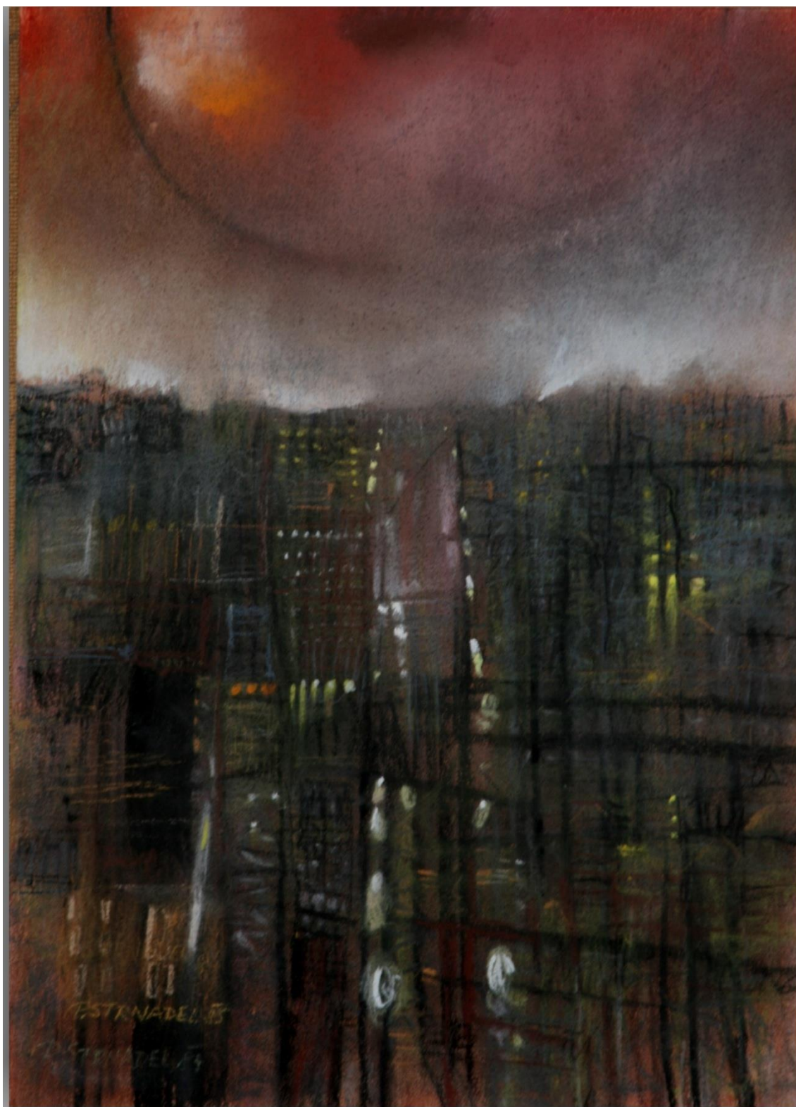
21. Pavel Strnadel, Město, 1985, pastel, 45 x 32 cm.