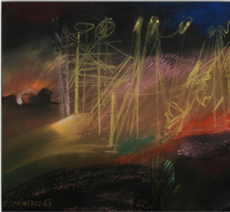
22. Pavel Strnadel, Z výstavby dolu, 1985, pastel, 31 x 28 cm.