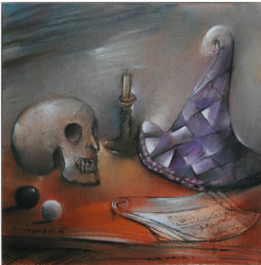
23. Pavel Strnadel, Noc s Hamletem, 1984, pastel, 31 x 30 cm.