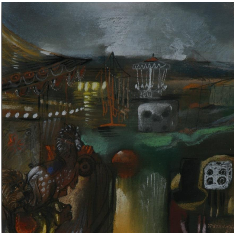
25. Pavel Strnadel, U kolotočů, 1985, pastel, 29 x 30 cm.