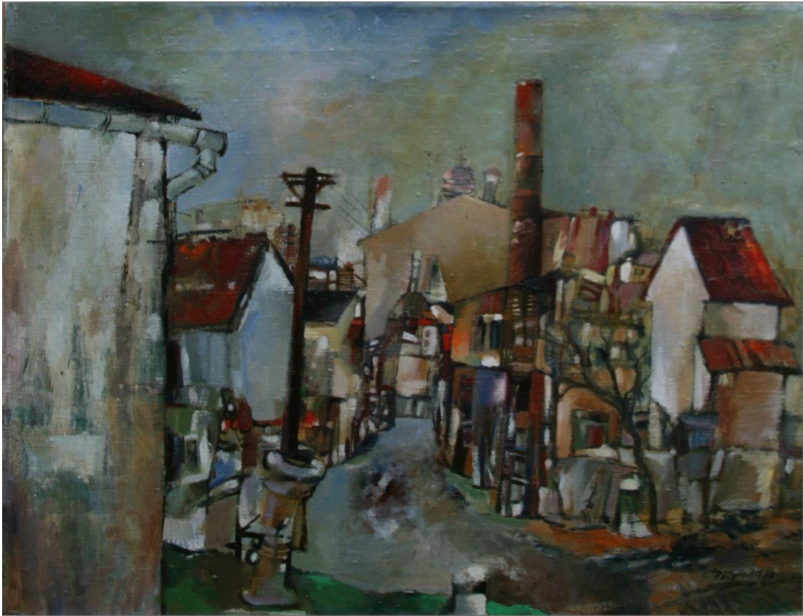
19. Pavel Strnadel, Ve městě, 1978, olej, plátno, 50 x 65 cm.