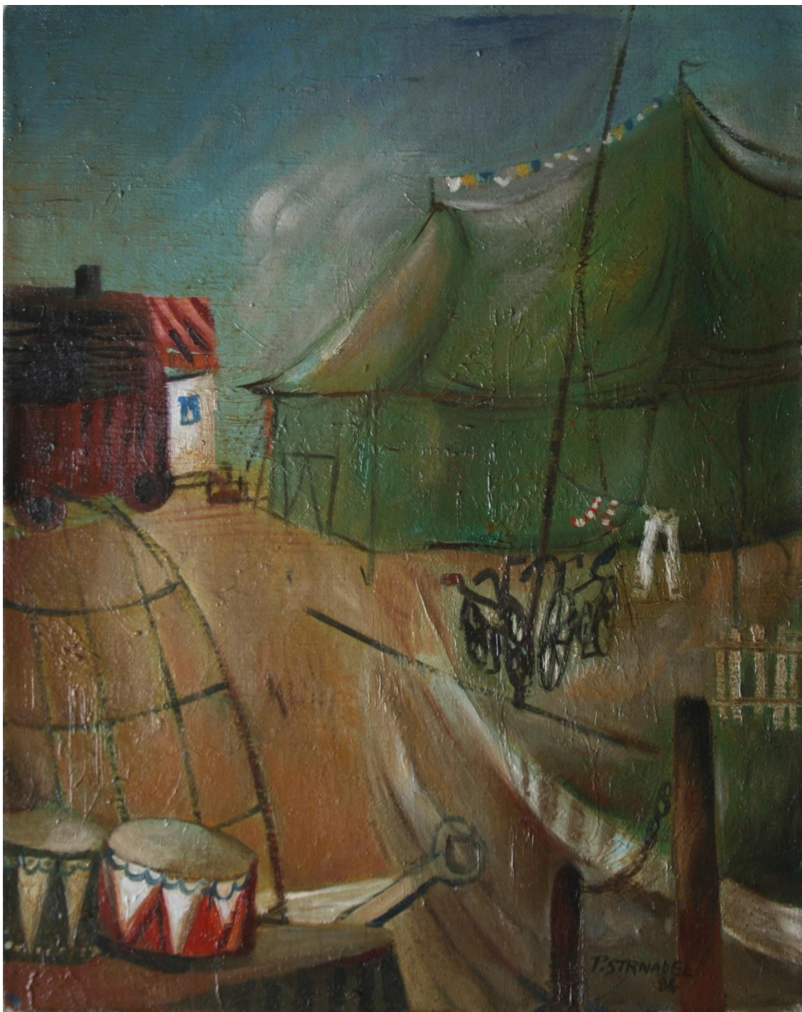
10. Pavel Strnadel, Cirkus, 1984, olej, plátno, 50 x 40 cm.