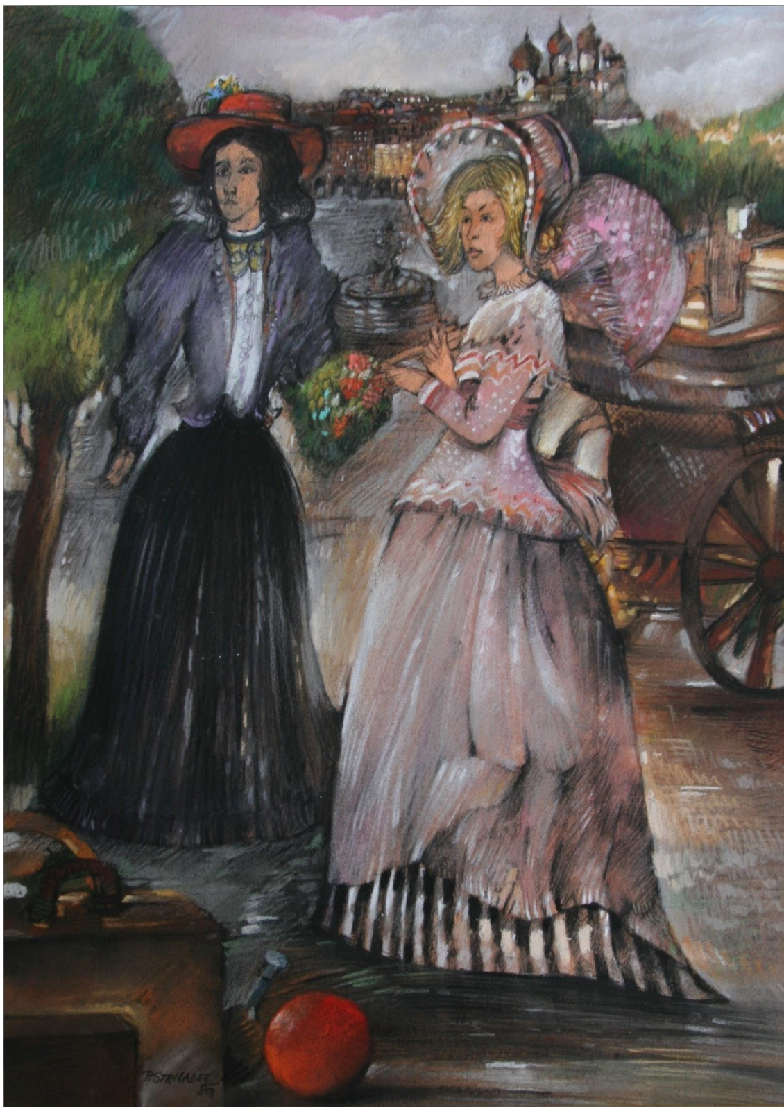
39. Pavel Strnadel, Ilustrace – I. S. Turgeněv – První láska, 1989, pastel, 50 x 39 cm.