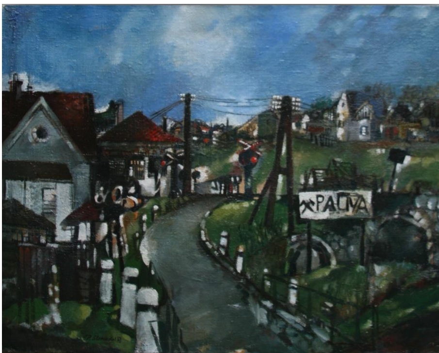
38. Pavel Strnadel, U přejezdu, 1978, olej, plátno, 50 x 65 cm.