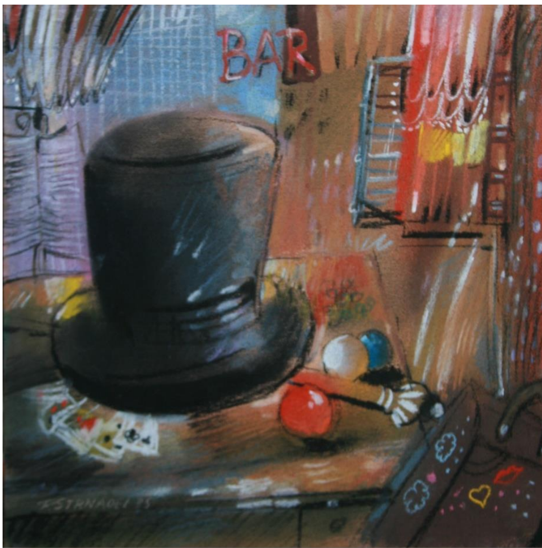
11. Pavel Strnadel, Kouzelnické zátiší I, 1985, pastel, 31 x 31 cm.