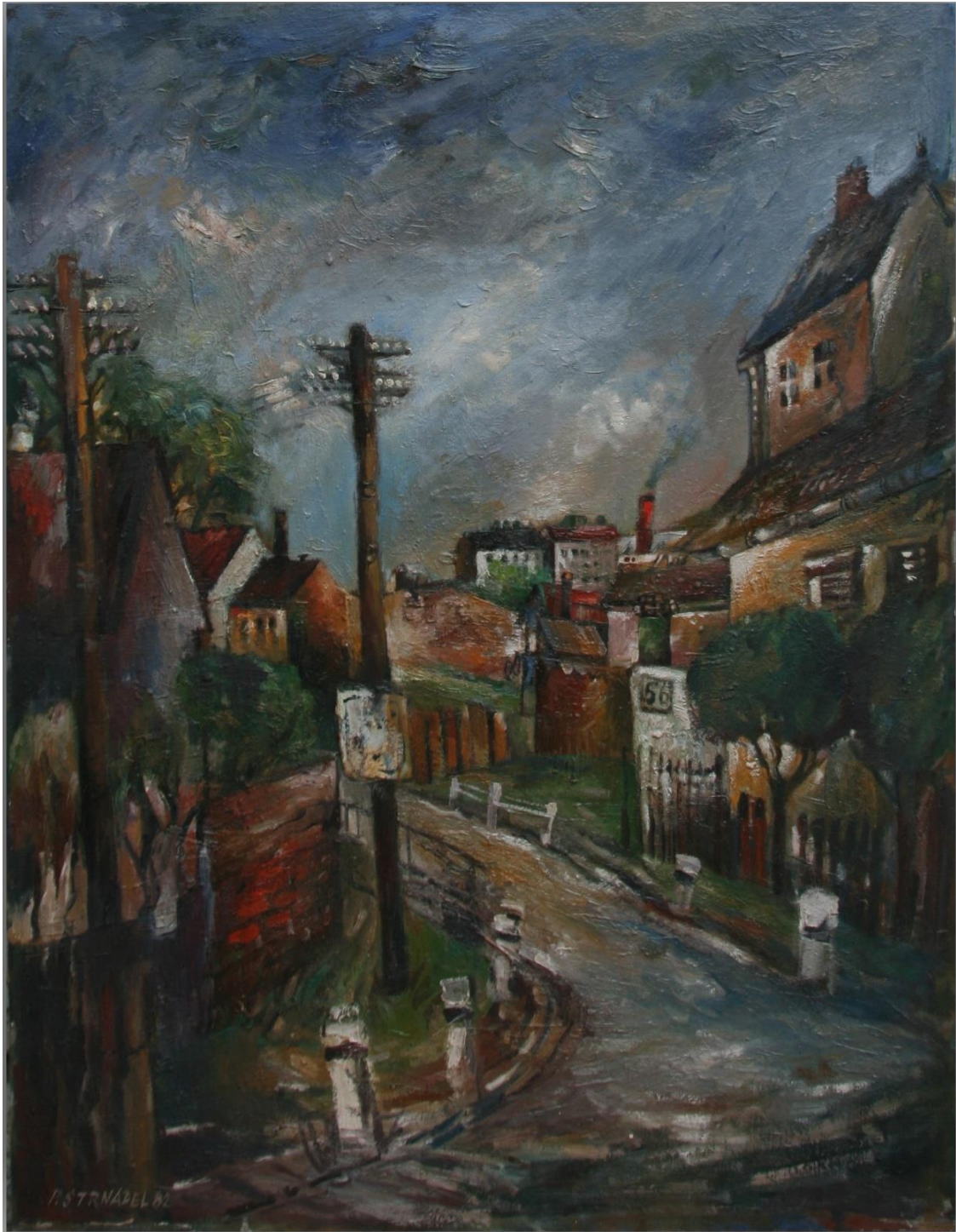
3. Pavel Strnadel, Periferie, 1982, olej, sololit, 75 x 58 cm.