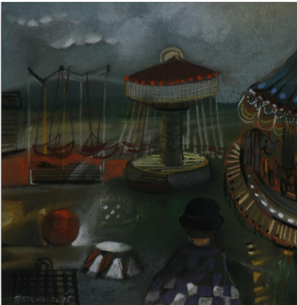
12. Pavel Strnadel, Na pouti, 1985, pastel, 30 x 29 cm.