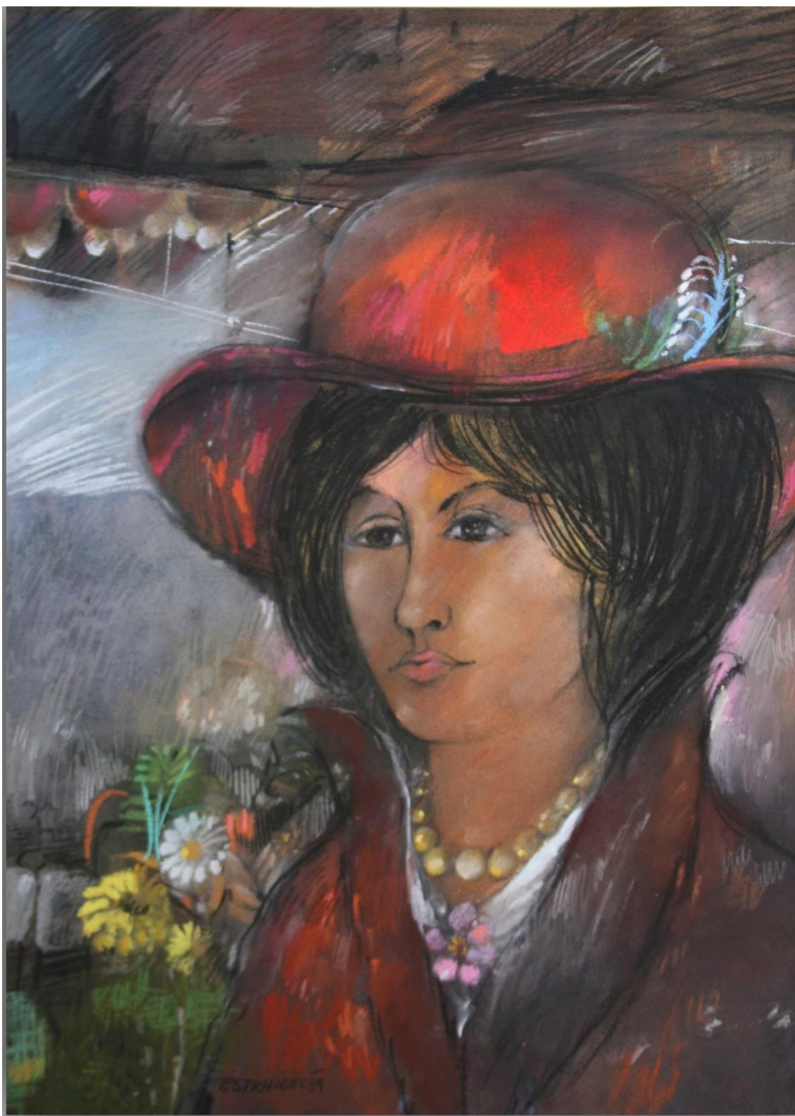
27. Pavel Strnadel, Ilustrace – Představy, 1989, pastel, 50 x 39 cm.