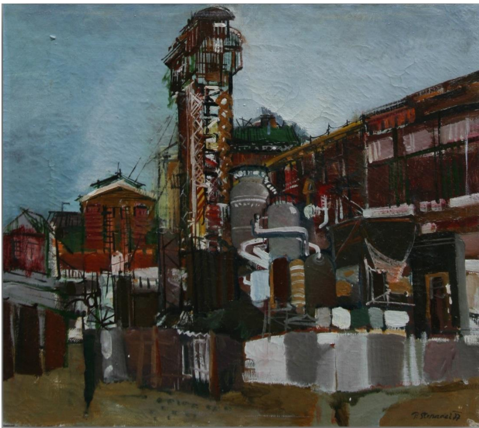
1. Pavel Strnadel, Továrna , 1977, olej, plátno, 40 x 45 cm.