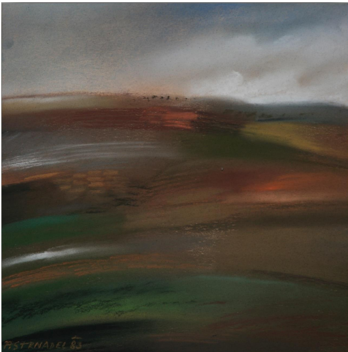
18. Pavel Strnadel, Krajina II, 1983, pastel, 30 x 29,5 cm.