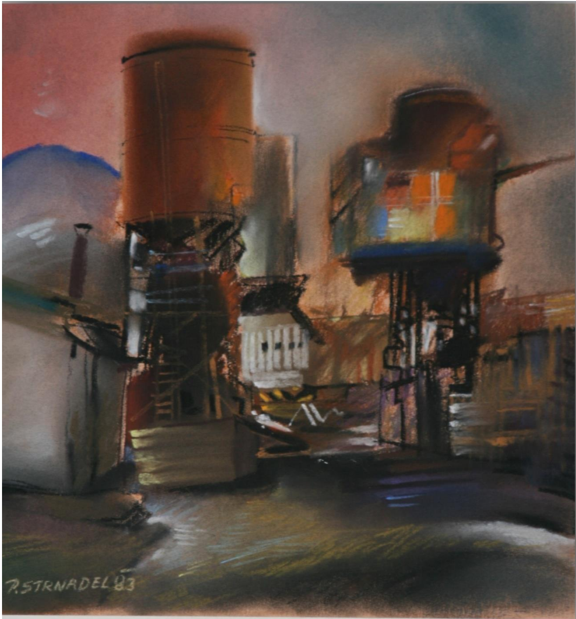
6. Pavel Strnadel, Výstavba Dolu Frenštát V, 1983, pastel, 32 x 30 cm.