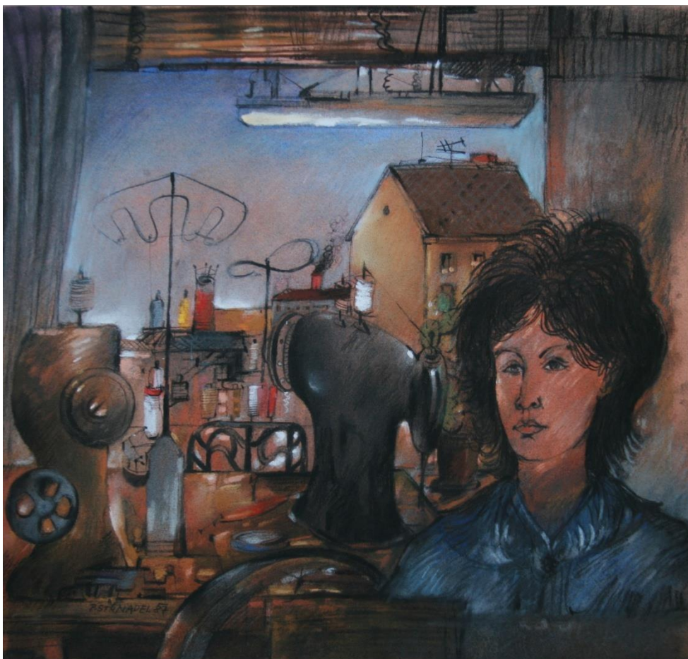
37. Pavel Strnadel, U švadleny, 1987, pastel, 37 x 38 cm.