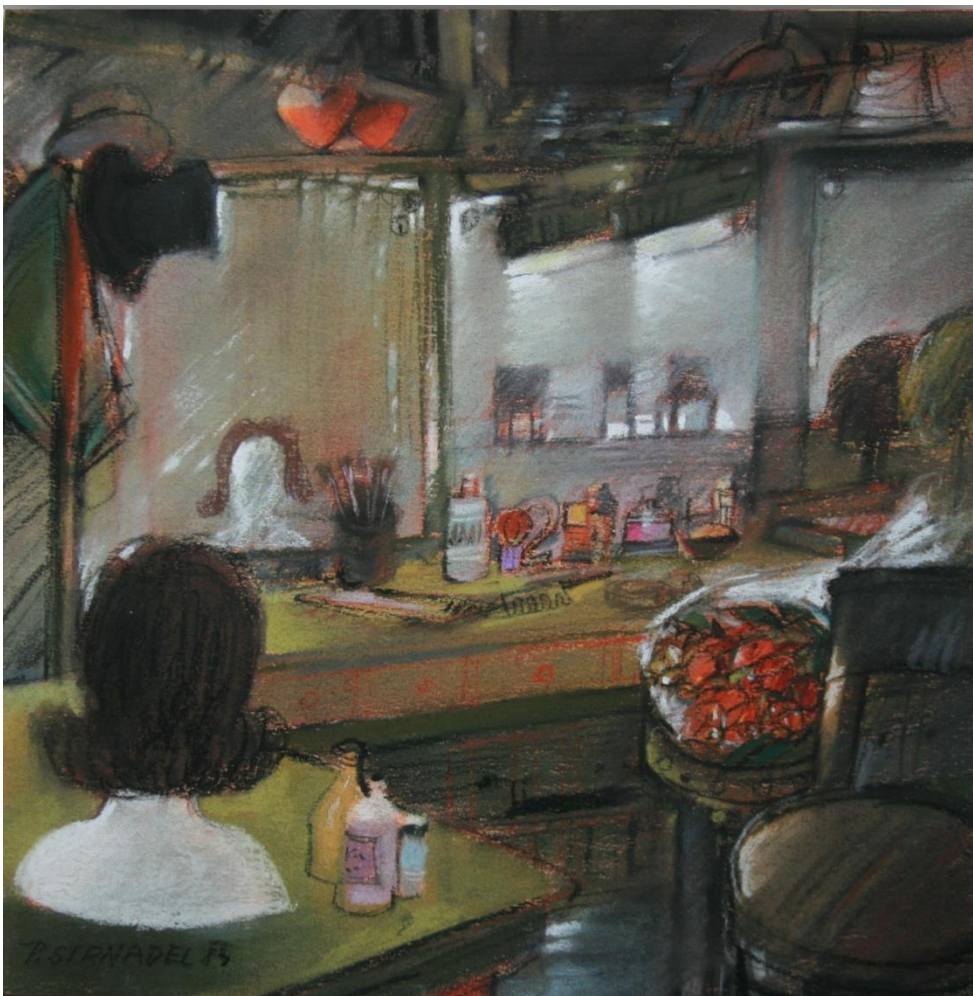
36. Pavel Strnadel, V kadeřnictví, 1985, pastel, 31 x 31 cm.