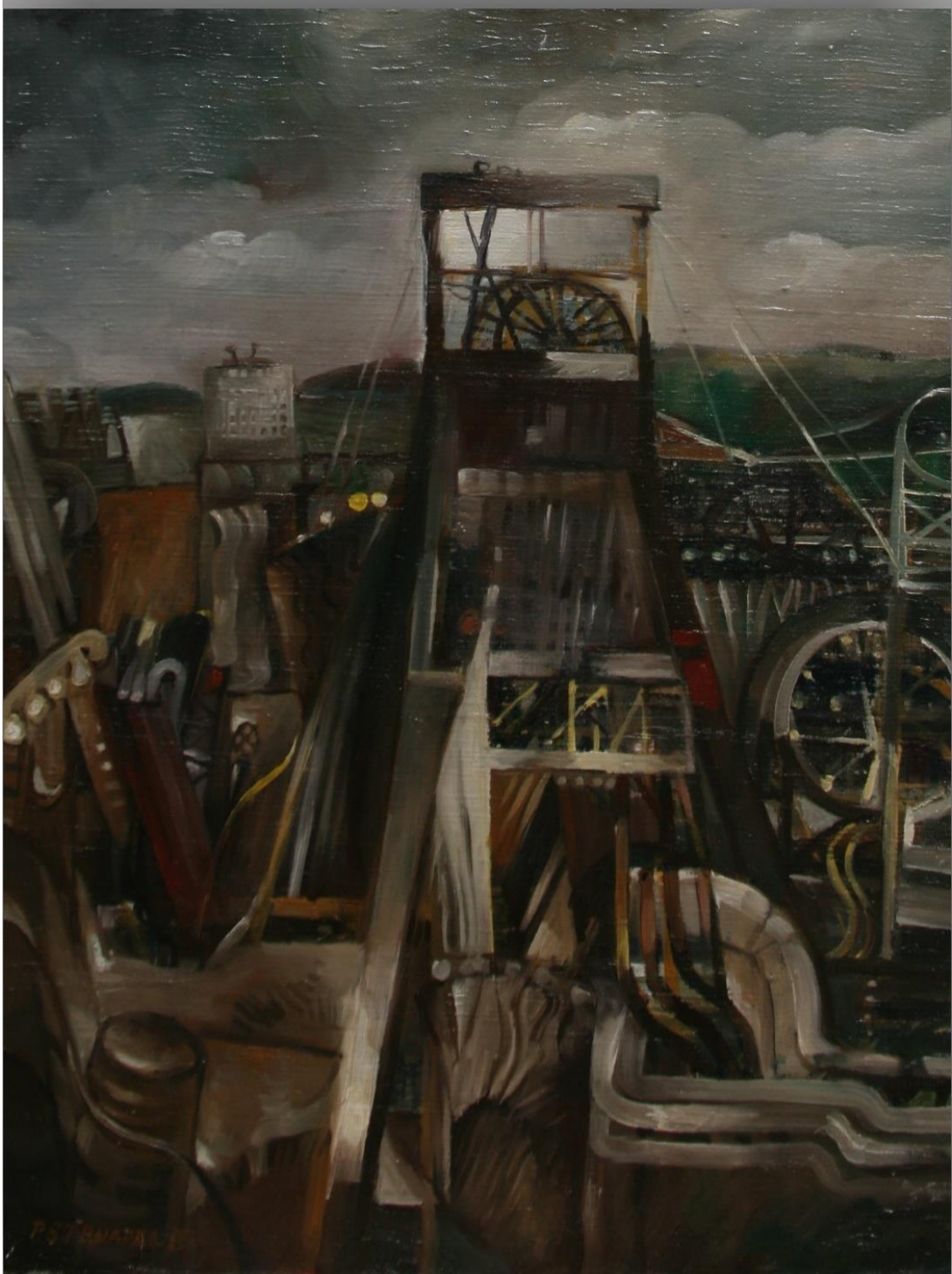
8. Pavel Strnadel, Výstavba Dolu Frenštát I, 1985, olej, plátno, 65 x 50 cm.