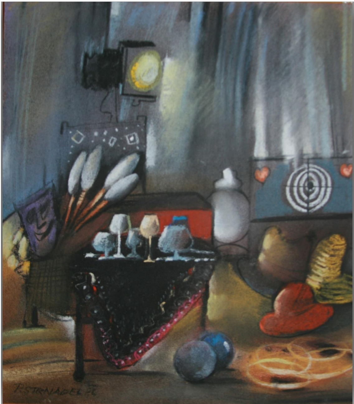
9. Pavel Strnadel, Rekvizity I, 1980, pastel, 31 x 27 cm.