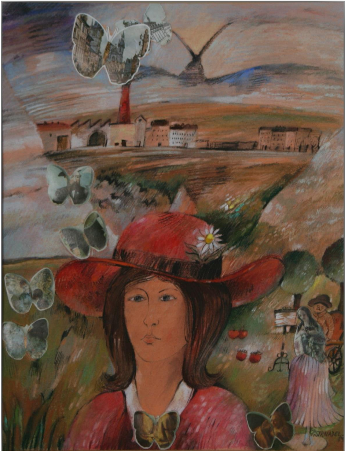
28. Pavel Strnadel, Vzpomínka, 1989, pastel a koláž, 50 x 39 cm.