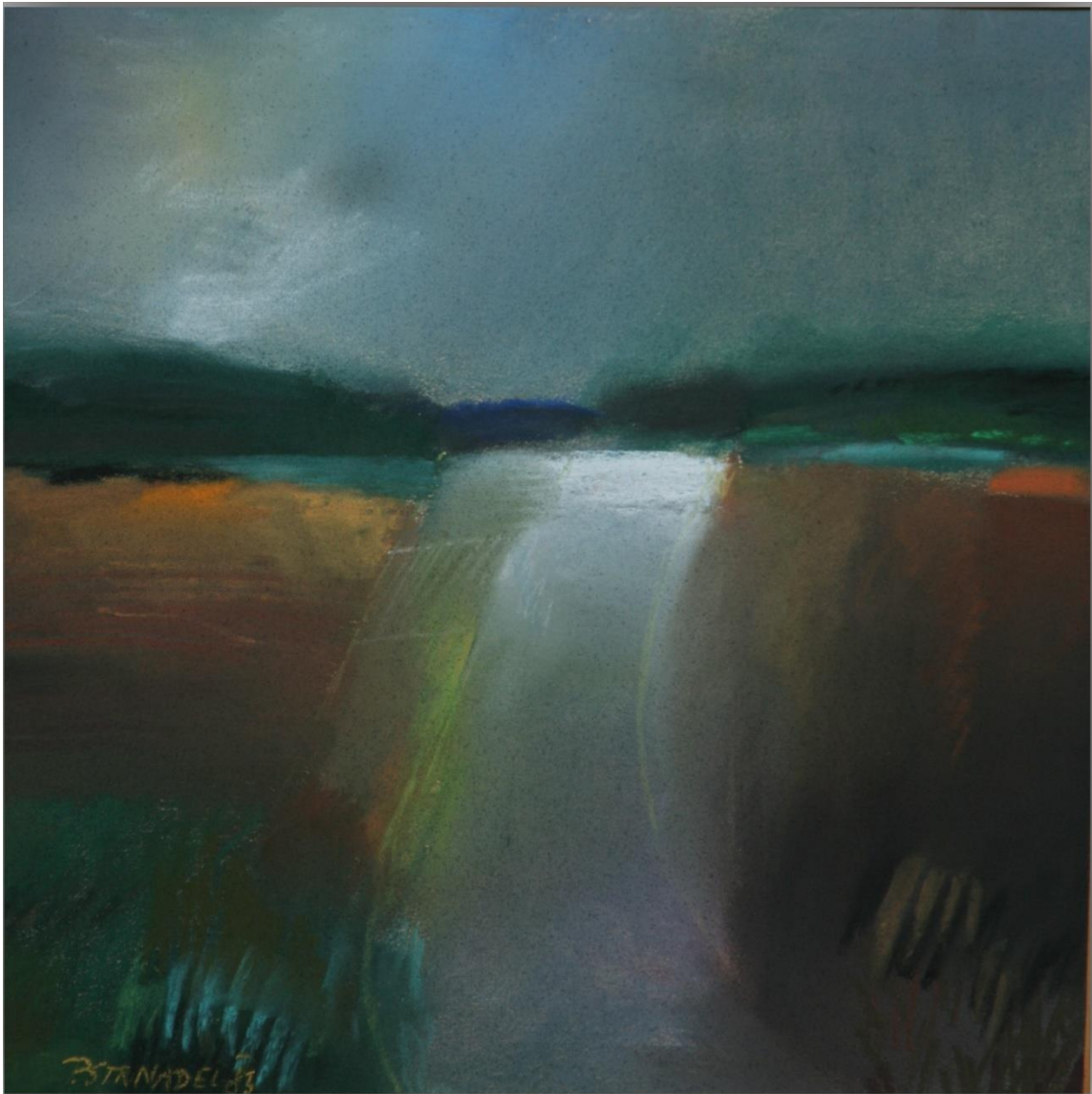
17. Pavel Strnadel, Krajina I, 1983, pastel, 30 x 29,5 cm.