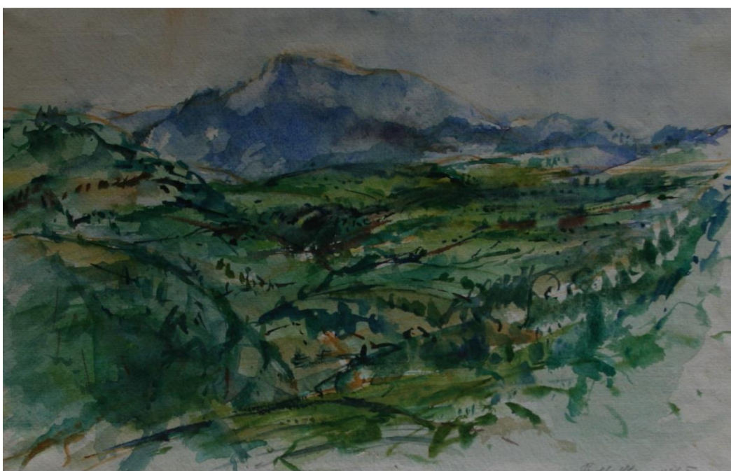
33. Pavel Strnadel, Krajina, 1973, akvarel, 24,5 x 38 cm.