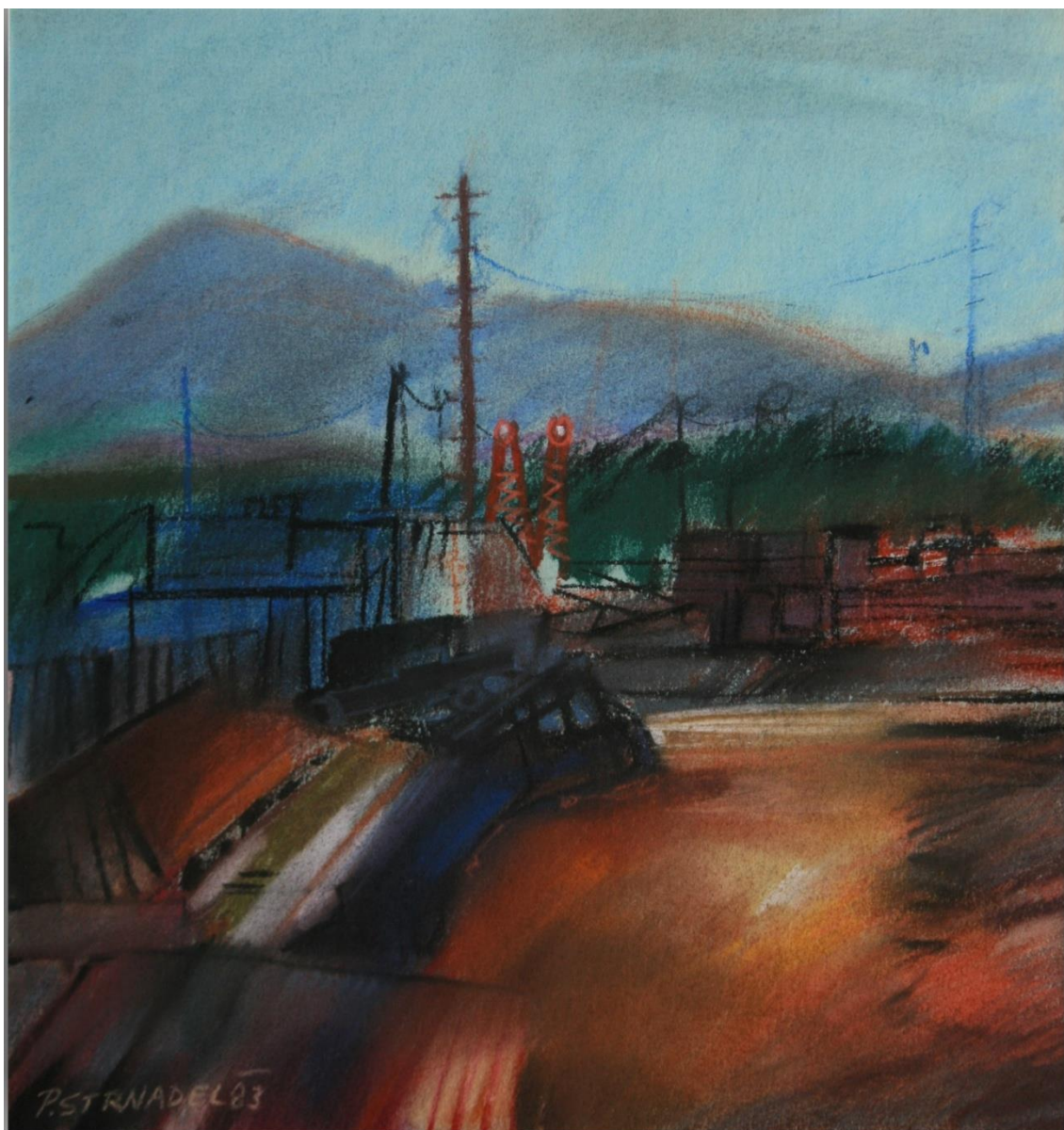
7. Pavel Strnadel, Z výstavby dolu, 1983, pastel, 32 x 29,5 cm.