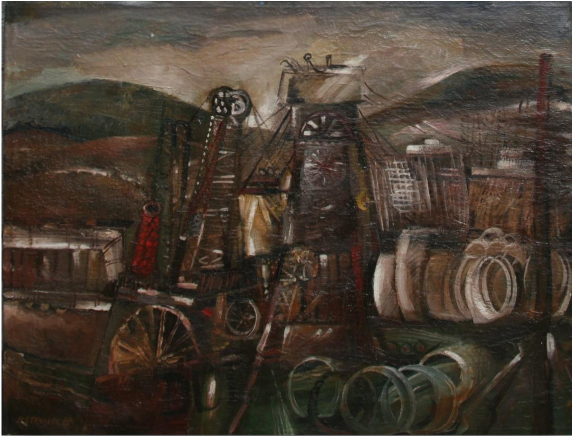
31. Pavel Strnadel, Výstavba Dolu Frenštát III, 1985, olej, plátno, 65 x 85 cm.