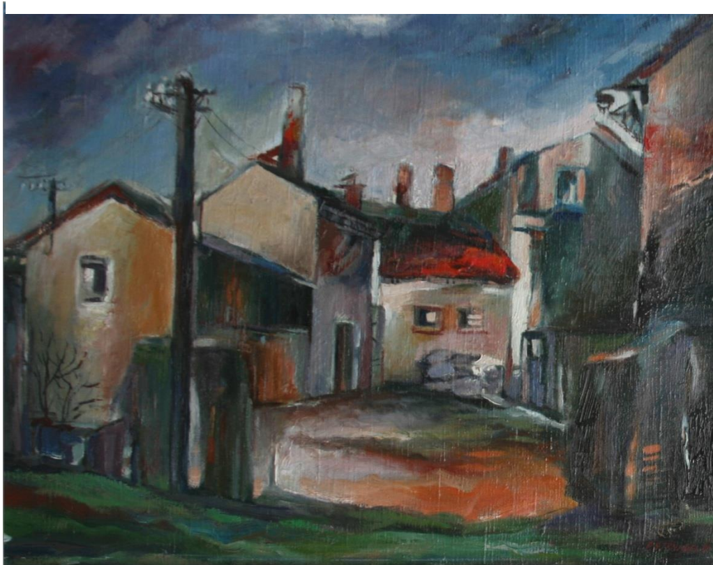
2. Pavel Strnadel, U čistírny , 1980, olej, plátno, 55 x 70 cm.