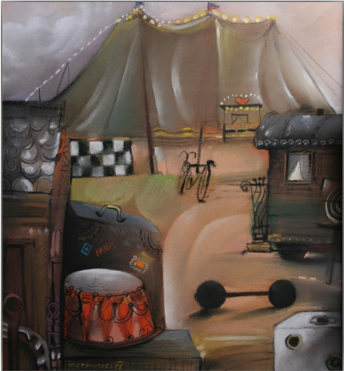
26. Pavel Strnadel, Cirkus, 1985, pastel, 37 x 34 cm.