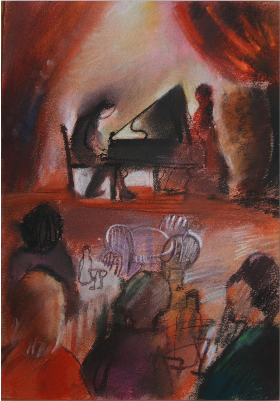
34. Pavel Strnadel, Koncert, 1989, pastel, 31 x 22 cm.