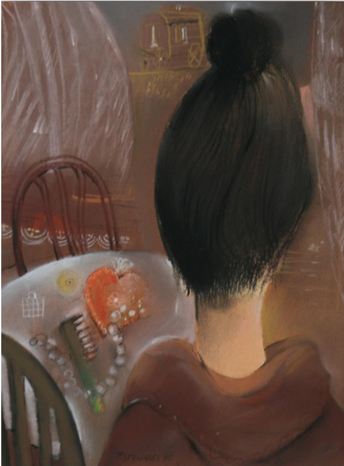
16. Pavel Strnadel, Loučení, 1985, pastel, 39 x 30 cm.