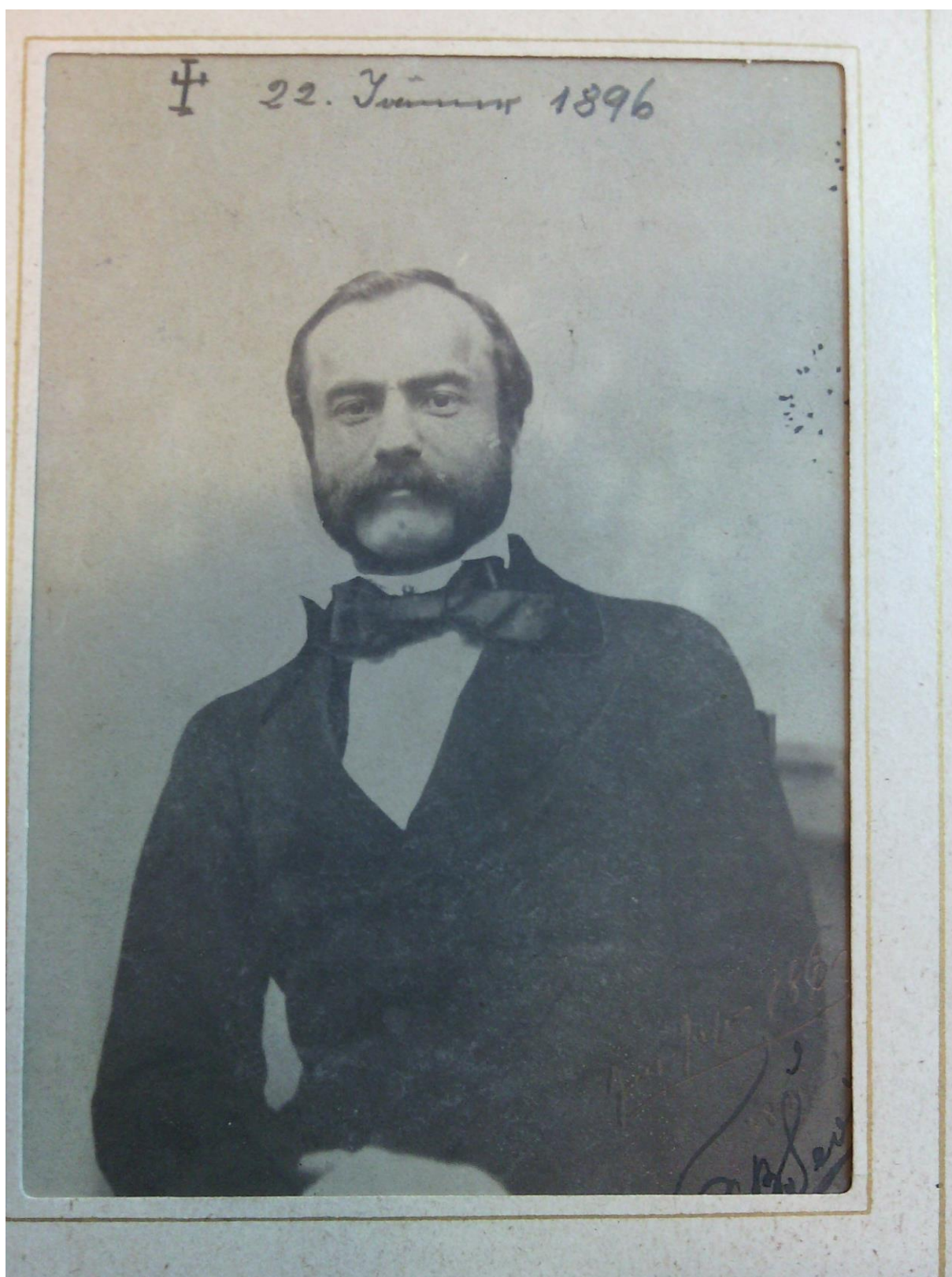
František Ševčík v 80. rokoch 19. storočia (fotografia z fondu, inv. č. 347)