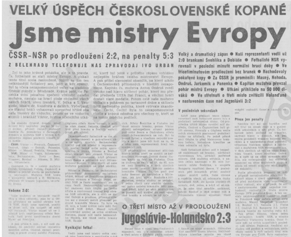
Zdroj: Velký úspěch československé kopané: Jsme mistry Evropy [online]. 21. 6. 1976 [cit. 2012-03-05]. ISSN 0032-6569. Dostupné z: http://archiv.ucl.cas.cz/index.php?path=RudePravo/1976/6/21/8.png