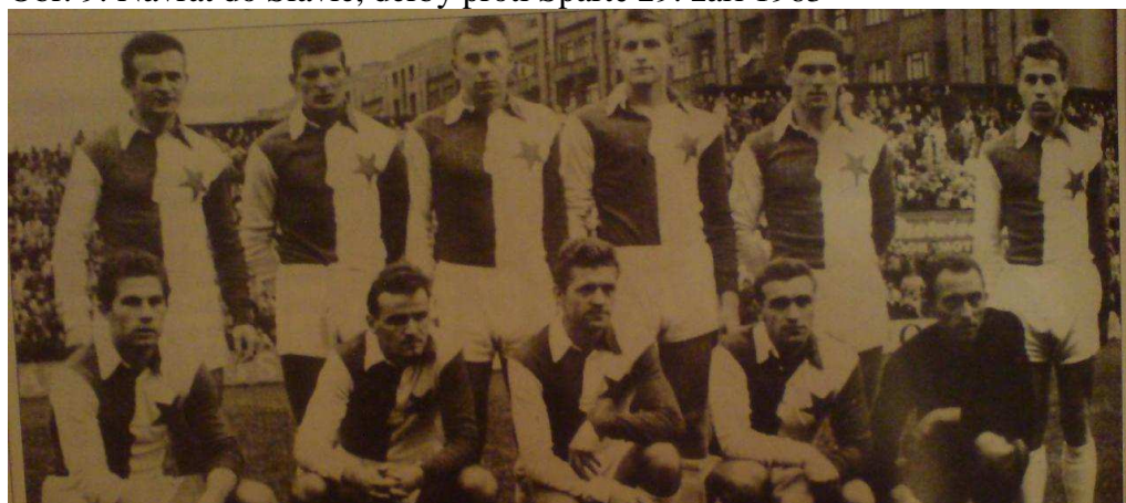
Obr. 9: Návrat do Slavie, derby proti Spartě 29. září 1963

Zdroj: BARTŮNĚK, O. 250 zápasů Sparta – Slavie ve faktech a fotografiích 1896-2001 . Praha: Riopress, 2002. ISBN 80-86221-53-9.