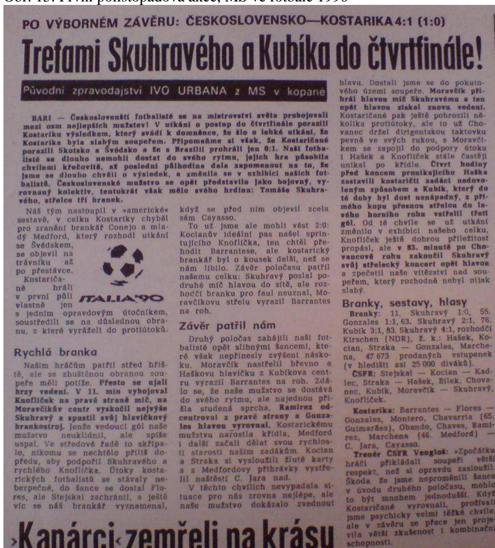
Obr. 15: První polistopadová akce, MS ve fotbale 1990

Zdroj: URBAN, Ivo. Trefami Skuhravého a Kubíka do čtvrtfinále!. Rudé právo . 25. 6. 1990. ISSN 0032-6569.