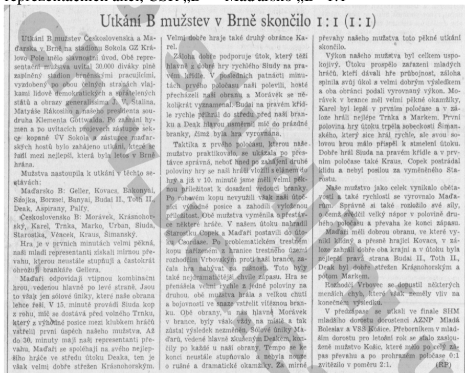
Obr. 3: Reportáž v Rudém právu z jedné z prvních Urbanových reprezentačních akcí, ČSR „B“ – Maďarsko „B“ 1:1