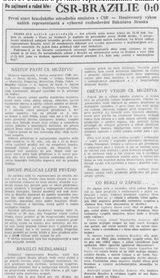
Zdroj: Po zajímavé a rušné hře: ČSR-Brazílie 0:0[online]. 22. 4. 1956 [cit. 2012-03-04]. ISSN 0032-6569. Dostupné z:

http://archiv.ucl.cas.cz/index.php?path=RudePravo/1956/4/22/6.png