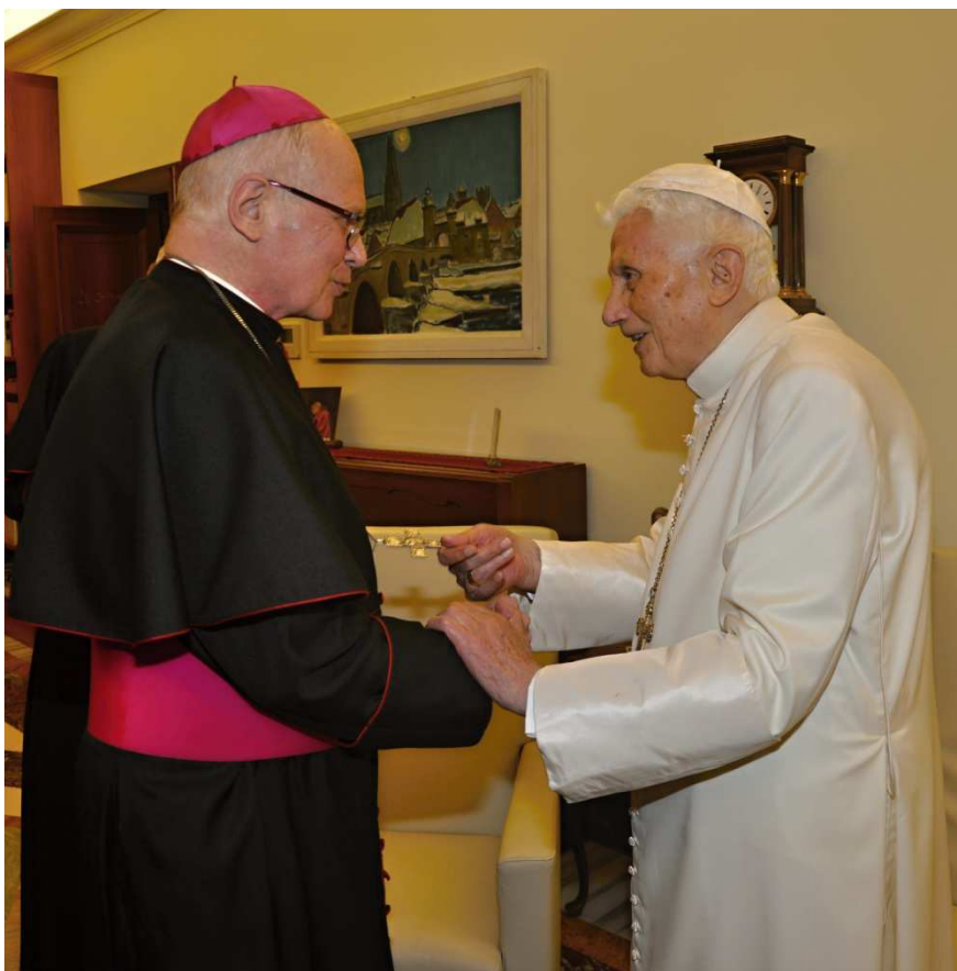
Obrázek 31 Pektorál emeritního papeže