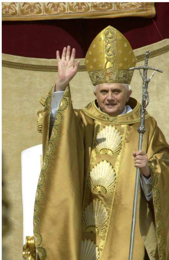
Obrázek 16 Kasule a mitra Jana Pavla II. (1987)