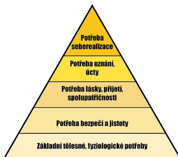
Obrázek 1: Maslowova pyramida

Každá organizace chce a potřebuje, aby zaměstnanci byli vzdělaní, samostatní, iniciativní, produktivní, spokojení atd. Už v roce 1943 Abraham Harold Maslow definoval „Maslowovu pyramidu potřeb“, kde seřadil pět základních lidských potřeb dle priority. Aby byly uspokojeny nejvyšší potřeby, je zapotřebí uspokojit nejdříve potřeby nižších řádů (Kolman a kol., 2008).