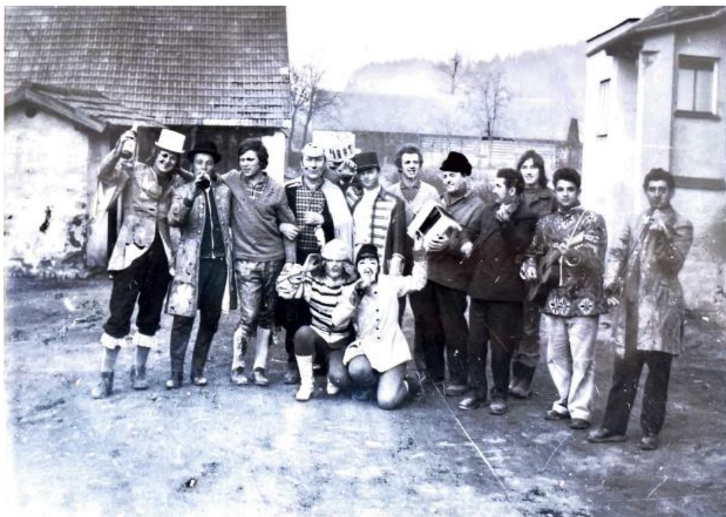
Obrázek 5 – Masopustní průvod 1973