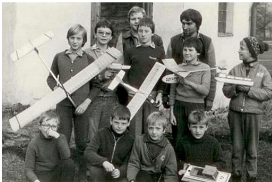
Obrázek 3 – Modelářský kroužek 1981