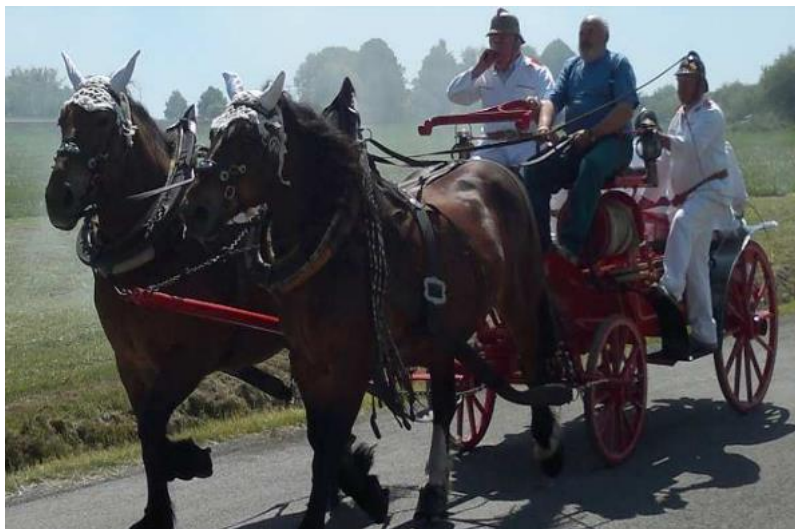
Obrázek 8 – Výročí 110 let od založení SDH