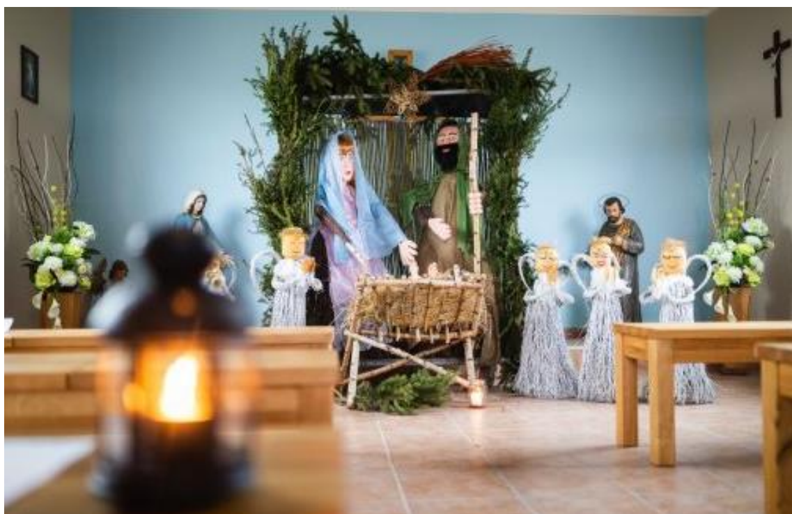
Obrázek 12 – Vánoční výzdoba hřbitovní kaple