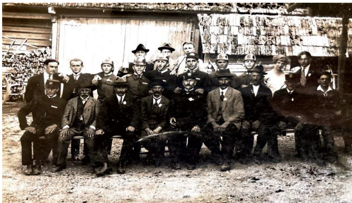
Obrázek 4 – Sbor dobrovolných hasičů Příkosice 1932