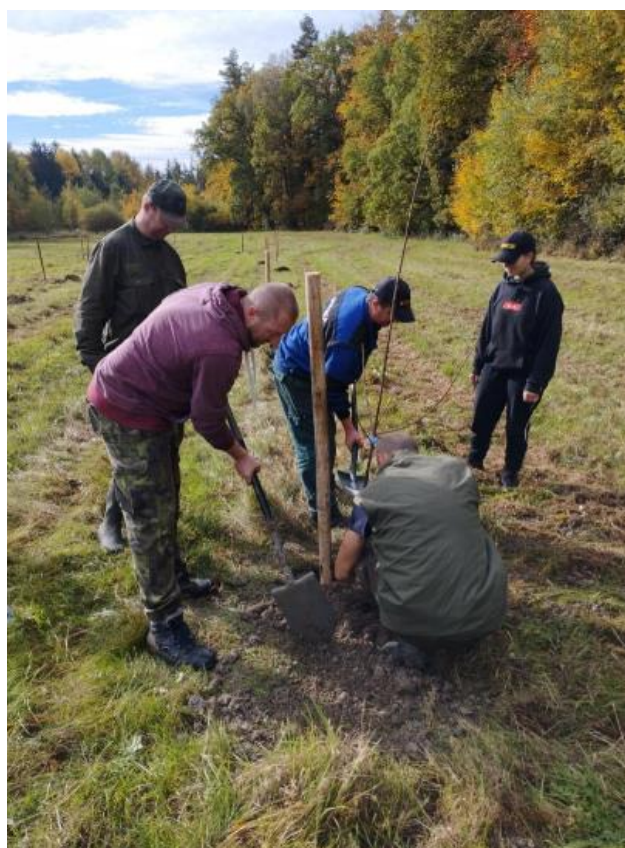
Obrázek 14 – Vysazování ovocného sadu zahrádkáři a myslivci 2022