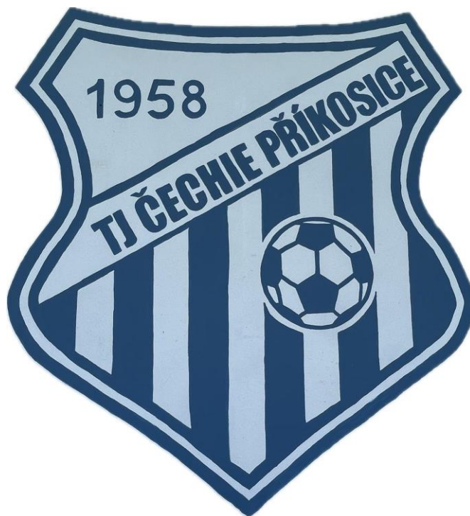
Obrázek 15 - Znak TJ Čechie Příkosice