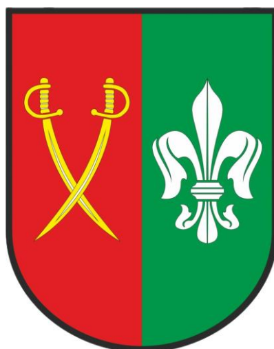
Obrázek 1 – Znak obce Příkosice