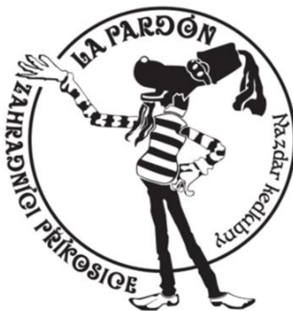
Obrázek 16 - Logo příkosických zahrádkářů