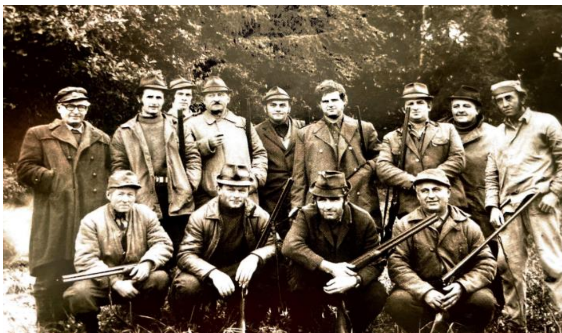
Obrázek 11 – Myslivecké sdružení Hubert, 70. léta 20. století