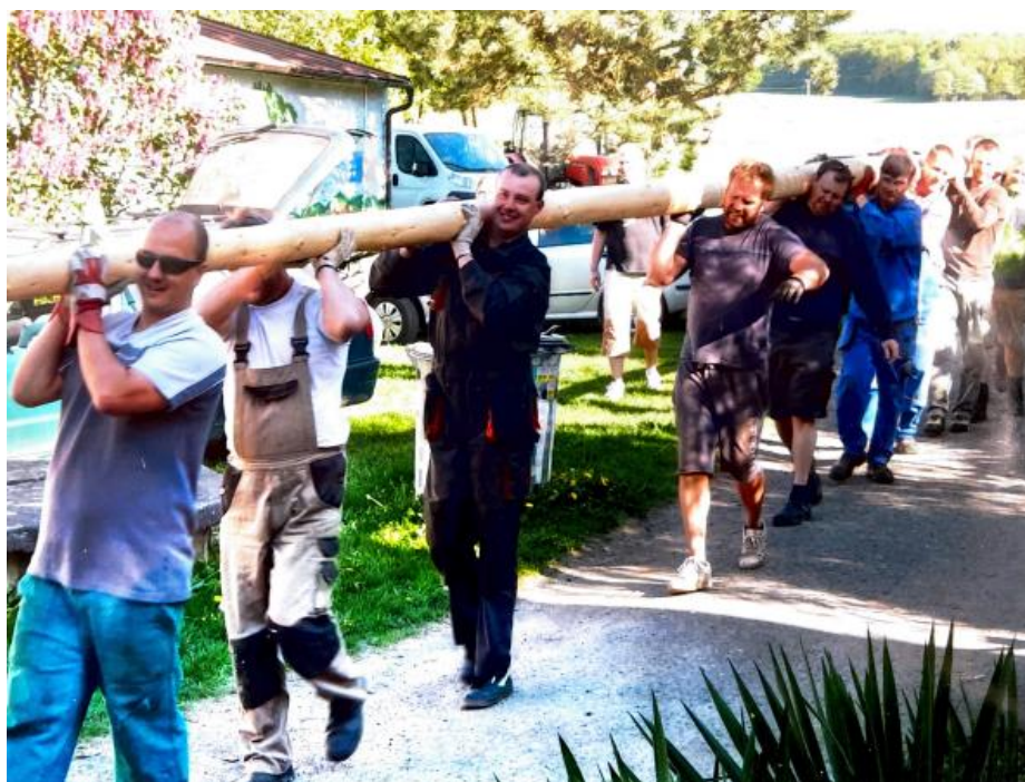
Obrázek 10 – Příprava májky