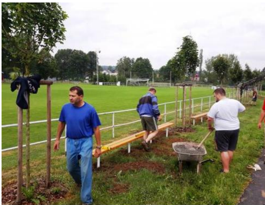
Obrázek 13 – Osazování laviček místními zahrádkáři, 2022