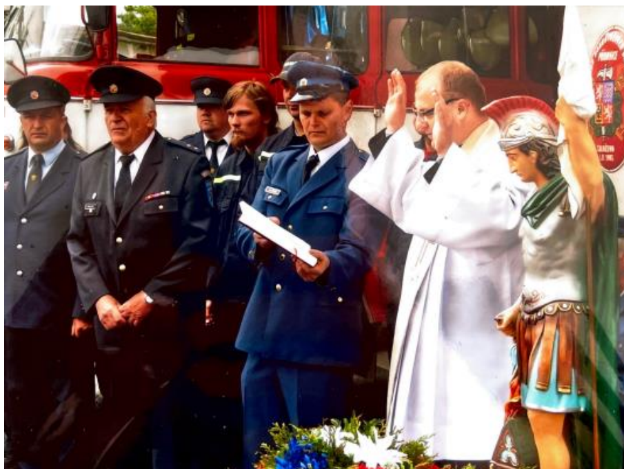
Obrázek 9 – Svěcení nové budovy hasičské zbrojnice 2017