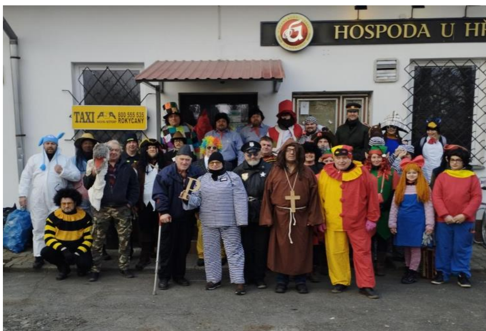
Obrázek 6 – Masopust 2023