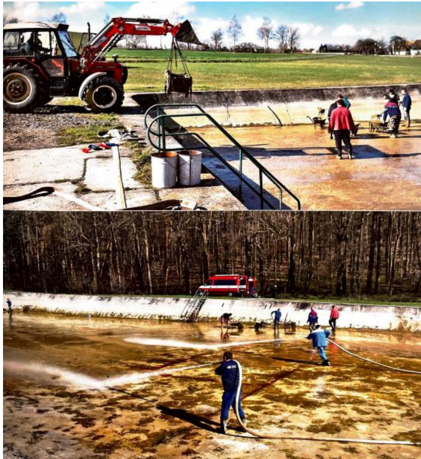
Obrázek 7 – Každoroční čištění koupaliště členy SDH