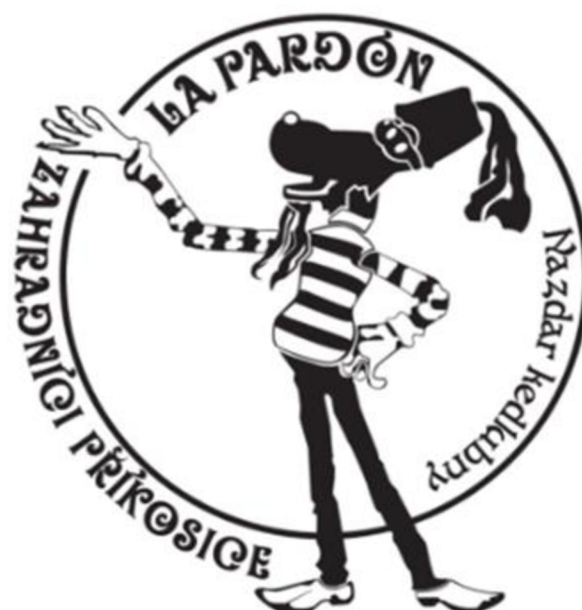
Obrázek 16 - Logo příkosických zahrádkářů