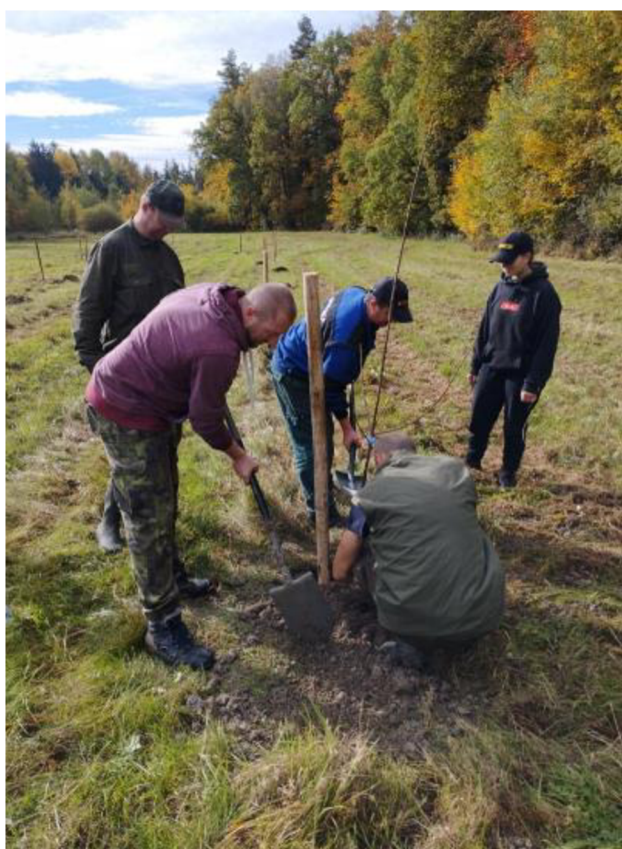
Obrázek 14 – Vysazování ovocného sadu zahrádkáři a myslivci 2022