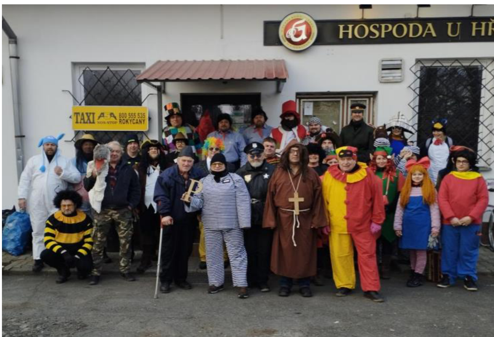
Obrázek 6 – Masopust 2023