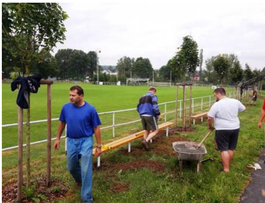
Obrázek 13 – Osazování laviček místními zahrádkáři, 2022