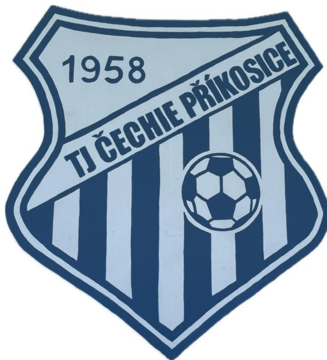
Obrázek 15 - Znak TJ Čechie Příkosice