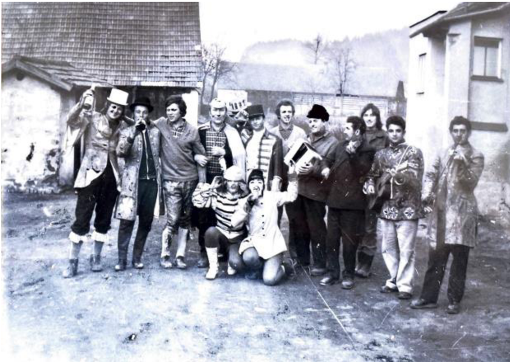
Obrázek 5 – Masopustní průvod 1973