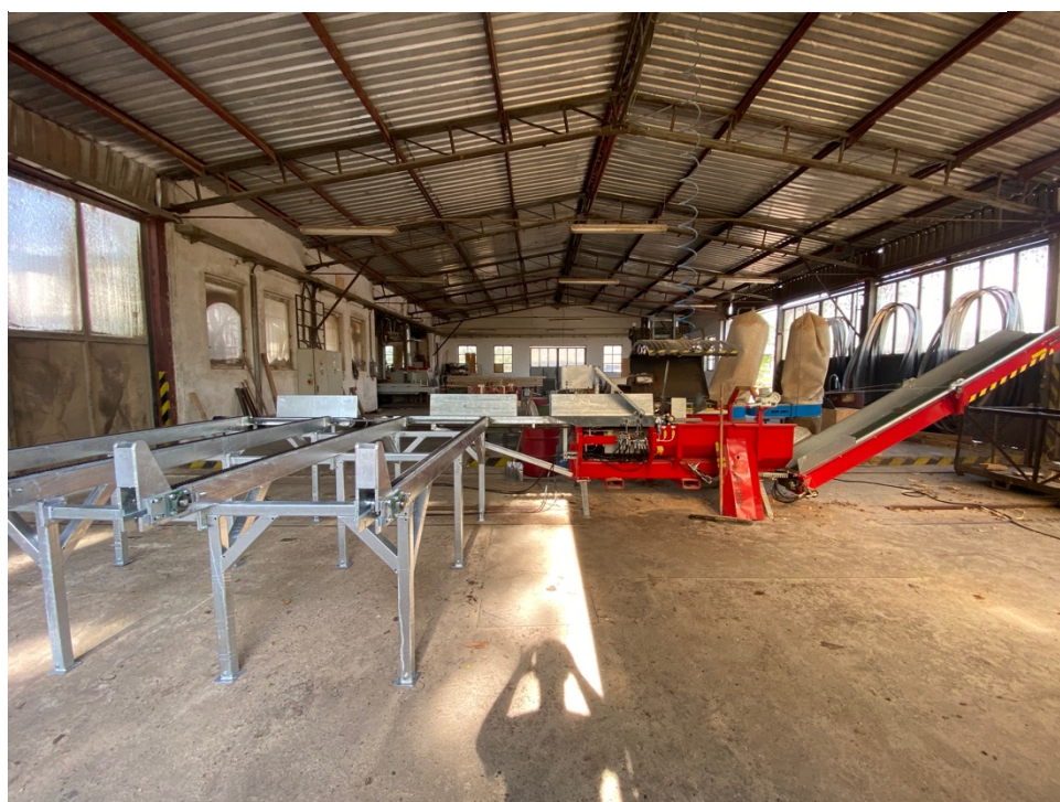
Obrázek 6 Štípací automat 2