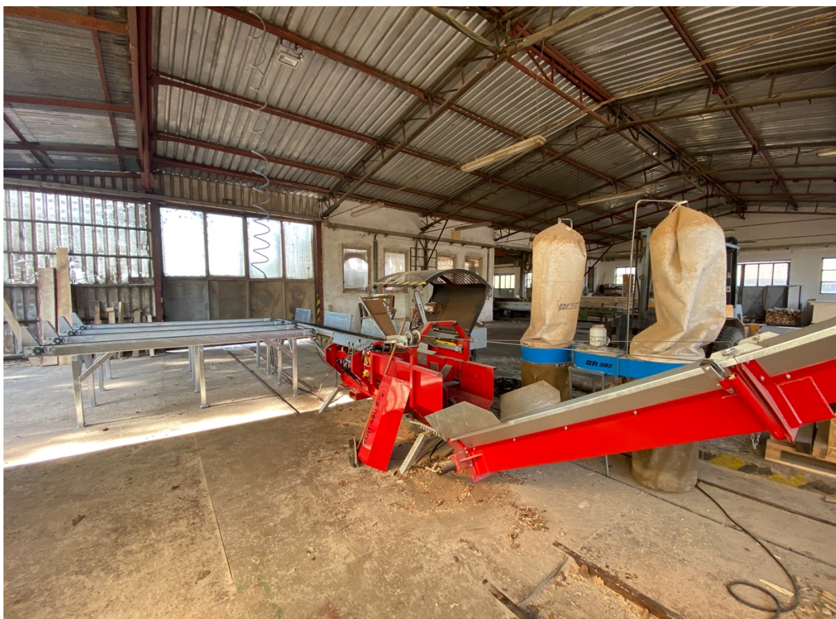
Obrázek 4 Štípací automat