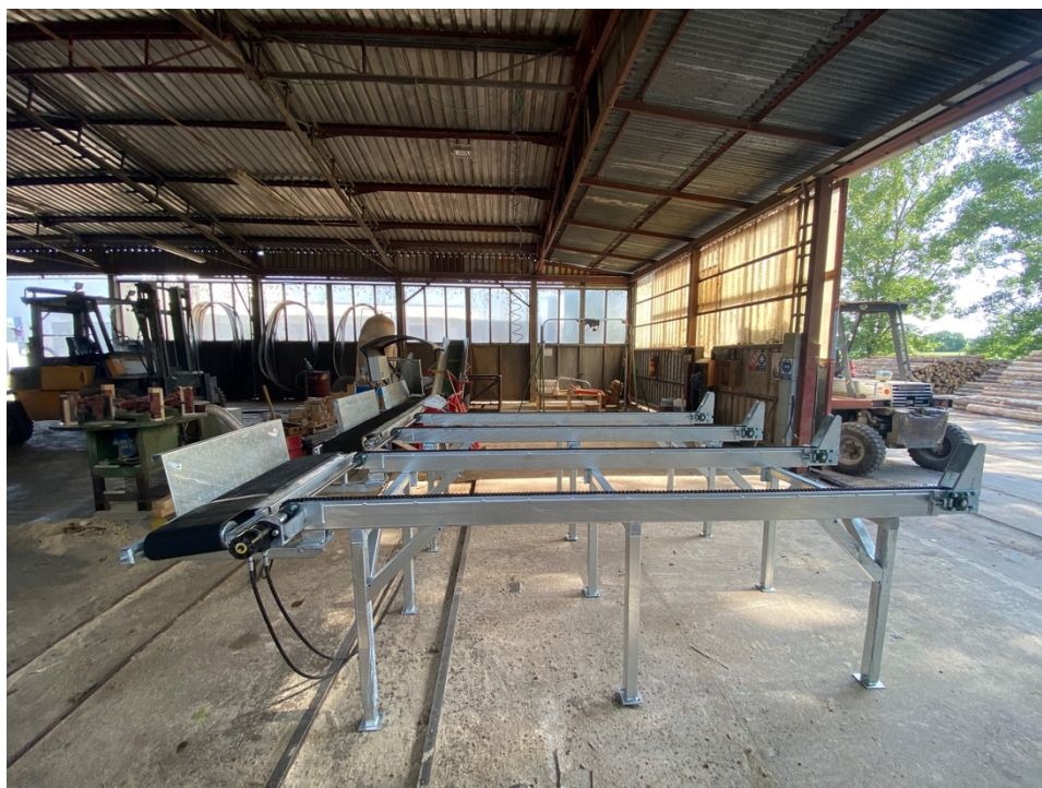
Obrázek 5 Podavací a vstupní dopravník