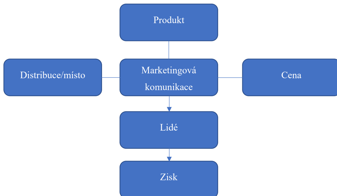
Obrázek 3 Prvky marketingového mixu