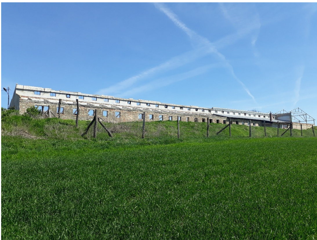
Hostinec (, 20. 4. 2018)