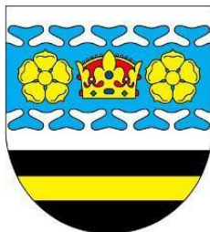
Obrázek 3.1: Znak obce Keblov