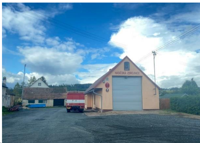
Obrázek 3.3: Hasičská zbrojnice v Keblově