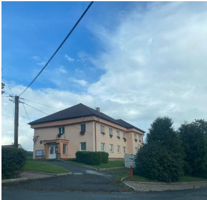
Obrázek 3.4: Obecní úřad v Keblově