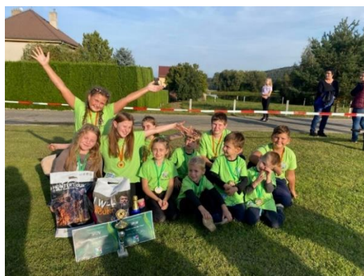
Obrázek 5.1: Děti SDH Keblov na soutěži

Okruh činností v kroužku je velice různorodý a pestrý, kombinuje jak sportovní činnost, tak znalostní a dovednostní. Hlavní činností kroužku je určitě požární sport, kdy se děti učí jemnou motoriku, zručnost a samozřejmě fyzickou připravenost. Pravidelně se účastní soutěží v požárním útoku, kde se umísťují na předních příčkách. Z mého pohledu je tato aktivita u dětí také nejoblíbenější. Učí se spoléhat na druhého, respektovat druhého, pracovat v týmu a vytváří si nová přátelství. O požárním sportu bude také celá následující kapitola.