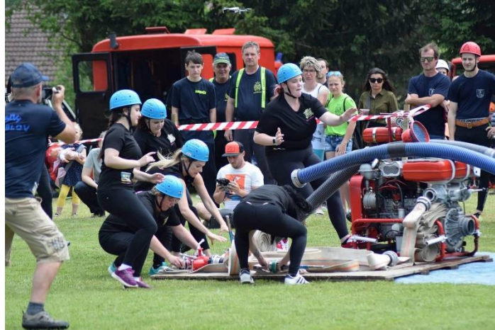
Obrázek 5.4: Družstvo žen při požárním útoku na soutěži v Keblově

i poražené. Díky požárnímu sportu také získáváme přátelské vazby a kontakty na celý život. Výše uvedené aspekty a hodnoty shledávám důležitými pro celý život a o to více je potřeba vést k těmto hodnotám již od malička.