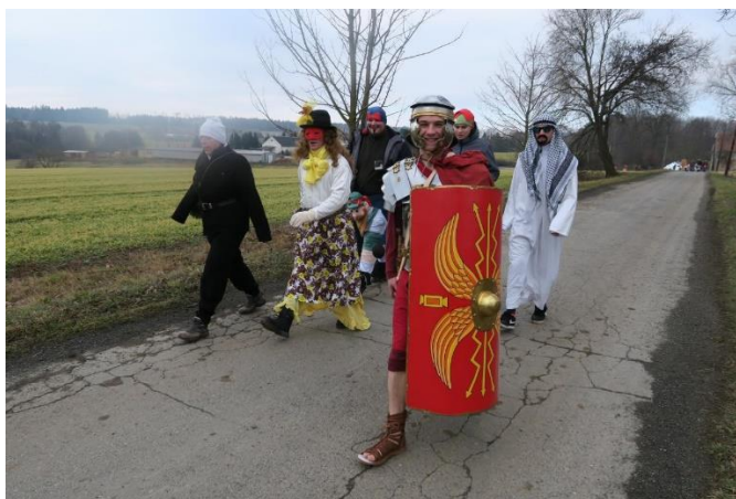
Obrázek 5.6: Masopustní průvod v maskách