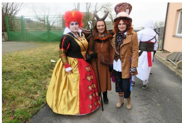
Obrázek 5.8: Masopustní průvod v maskách