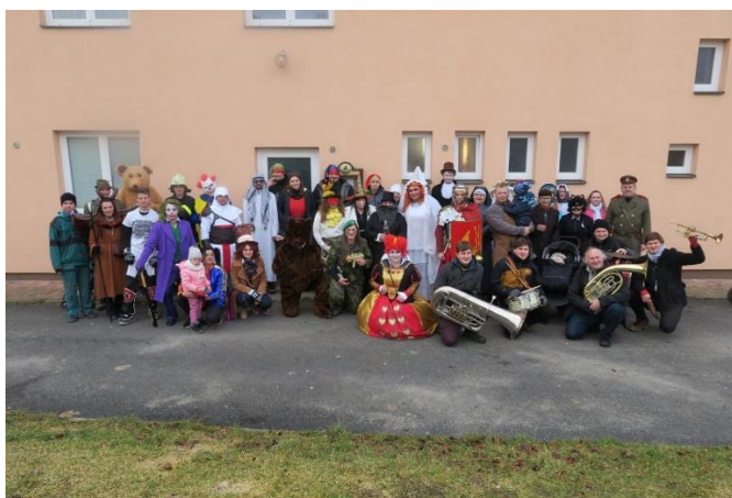
Obrázek 5.7: Masopustní průvod v maskách