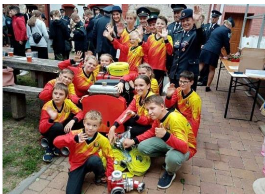
Obrázek 5.9: Děti z SDH Moravská Nová Ves s novým hasičským vybavením