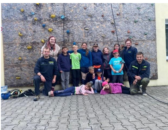
Obrázek 5.2: Děti SDH Keblov na víkendovém soustředění

Nedílnou součástí kroužku jsou různé hry a akce pro děti. Jedná se například o karnevaly, drakiády, besídky, tábory, výlety do přírody apod. Dle mého názoru je důležité, aby děti ve svém volném čase nemusely jen poslouchat nějaké příkazy, ale aby to pro ně byla hra.