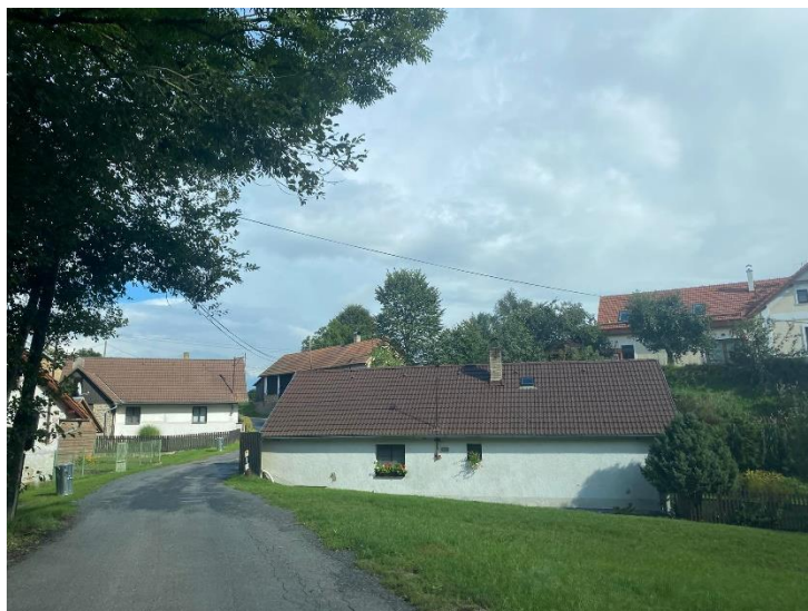
Obrázek 3.5: Část obce Keblov – Sedlice