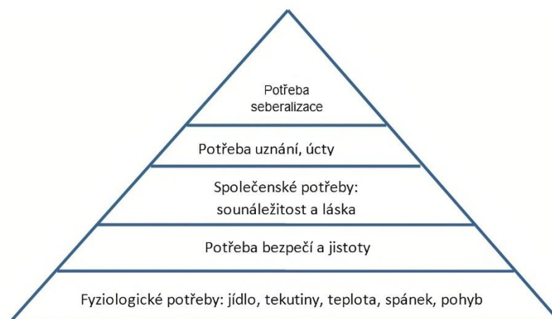
Obrázek 5.5: Maslowa pyramida potřeb