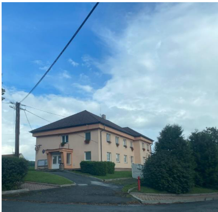
Obrázek 3.4: Obecní úřad v Keblově