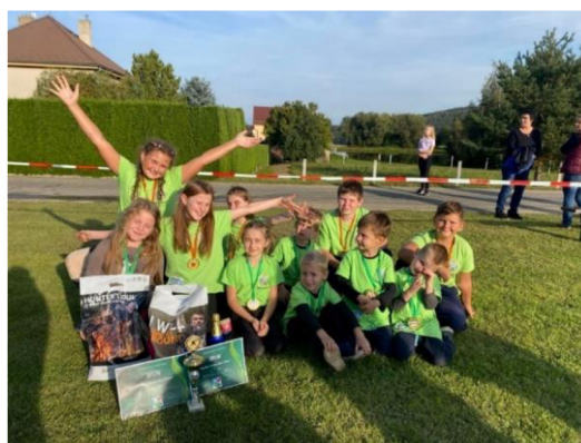
Obrázek 5.1: Děti SDH Keblov na soutěži

Okruh činností v kroužku je velice různorodý a pestrý, kombinuje jak sportovní činnost, tak znalostní a dovednostní. Hlavní činností kroužku je určitě požární sport, kdy se děti učí jemnou motoriku, zručnost a samozřejmě fyzickou připravenost. Pravidelně se účastní soutěží v požárním útoku, kde se umísťují na předních příčkách. Z mého pohledu je tato aktivita u dětí také nejoblíbenější. Učí se spoléhat na druhého, respektovat druhého, pracovat v týmu a vytváří si nová přátelství. O požárním sportu bude také celá následující kapitola.