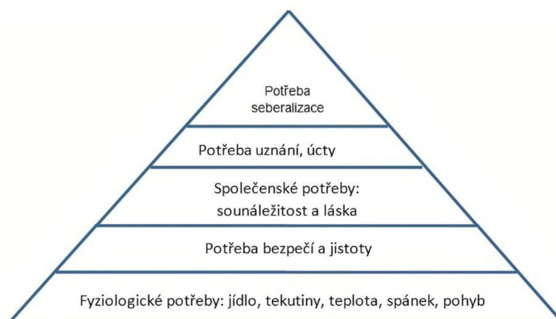
Obrázek 5.5: Maslowa pyramida potřeb