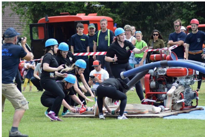
Obrázek 5.4: Družstvo žen při požárním útoku na soutěži v Keblově

i poražené. Díky požárnímu sportu také získáváme přátelské vazby a kontakty na celý život. Výše uvedené aspekty a hodnoty shledávám důležitými pro celý život a o to více je potřeba vést k těmto hodnotám již od malička.