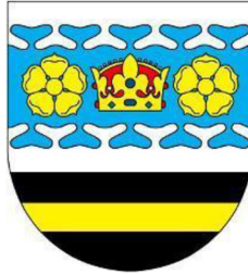
Obrázek 3.1: Znak obce Keblov