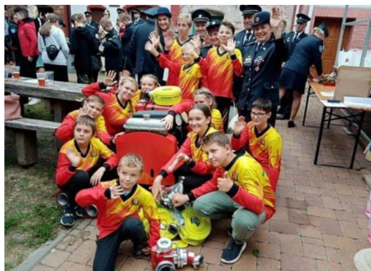
Obrázek 5.9: Děti z SDH Moravská Nová Ves s novým hasičským vybavením