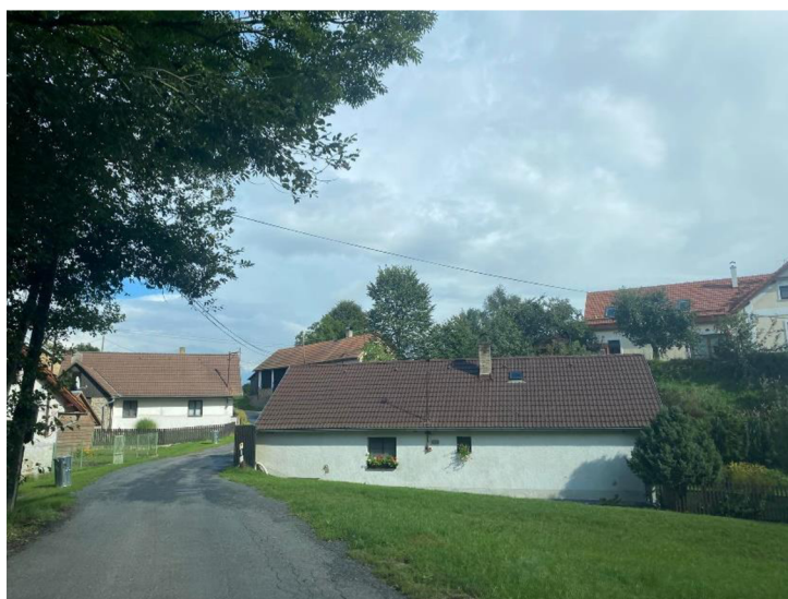
Obrázek 3.5: Část obce Keblov – Sedlice