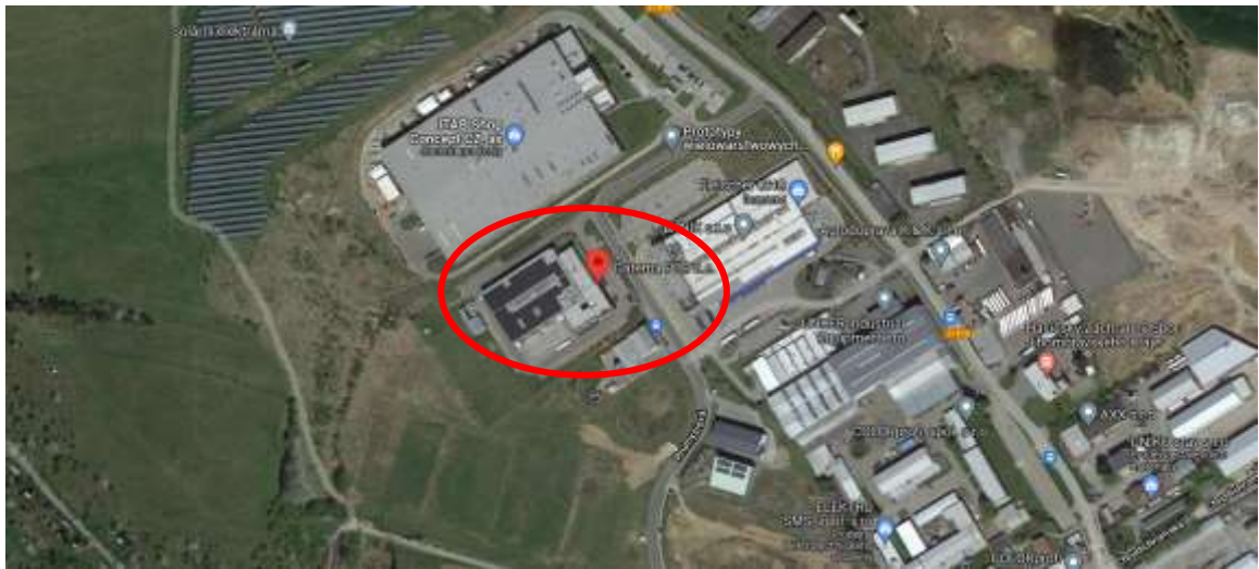
Obrázek 2: Poloha společnosti 60

Tato práce je zaměřena přímo na společnost Gatema PCB, a. s., která sídlí ve městě Boskovice. Nachází se na adrese Průmyslová 2503/2, 680 01.