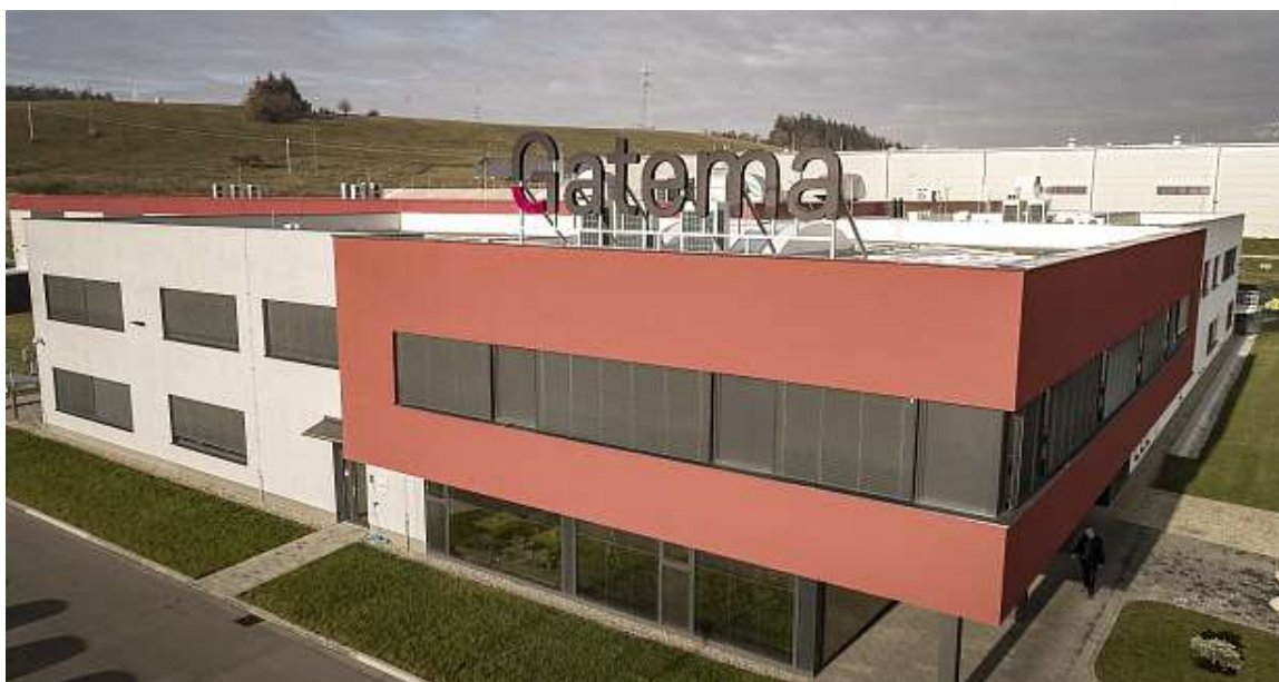
Obrázek 3: Budova společnosti 63

Firma Gatema byla založena v roce 1992 pod názvem CEA Product, s. r. o. v podkroví rodinného domu v Kunštátě. Gatema se prvně soustředovala na prodej a vývoj informačních ERP systémů. V roce 1994 firma koupila technologii na výrobu desek plošných spojů a stala se jednou z významnějších firem na úseku informačních technologií a výrobcem desek plošných spojů. V roce 1997 přesunula své sídlo do Boskovic. V roce 2002 byla společnost poprvé certifikována. V následujících letech se do produktového portfolia dostaly i vícevrstvé desky plošných spojů a začala výroba HDI desek plošných spojů. V roce 2013 se dokončila stavba nové haly a proběhl přesun s kompletní výrobou desek plošných spojů do nových výrobních prostor. Firma má také od roku 2016 zřízenou a nadále provozovanou vlastní školku s názvem Gatemáček. V roce 2020 vznikla Gatema PCB, a. s. a započala výroba flexibilních a rigid-flex desek. V roce 2021 proběhla automatizace řízení vybraných výrobních procesů a spuštění online konfigurátoru PCB. 62