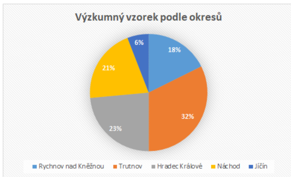
Graf 01: Rozložení školních klubů dle okresů v Královéhradeckém kraji

Výzkumný vzorek i metody práce byly v původním záměru práce značně širší a rozsáhlejší, ovšem v nastalé situaci s globální pandemií viru SARS-CoV-2 jsem se rozhodl na zúžení výzkumného vzorku i využitých metod tak, aby výsledky stále byly relevantní bez nutnosti osobních kontaktů a návštěv. Výzkumným vzorek byl tedy zvolen ve školních klubech škol působících v Královéhradeckém kraji. Hlavním prostředkem pro hledání školních klubů se v prvních fázích stal rejstřík škol poskytovaný ministerstvem školství, mládeže a tělovýchovy. Ve vyhledávání bylo dále specifikováno vyhledávané zařízení (G22, Školní klub) a Královéhradecký kraj (CZ050, Královéhradecký kraj). Nebyl brán ohled na zřizovatele škol, které školní kluby provozuje, ani jejich ředitele. Výsledkem byl výsledek, kde zadaným podmínkám vyhovuje 34 škol/zařízení v 34 právnických osobách. Největší koncentrace školních klubů v kraji připadá na okres Trutnov, který zastává 32 % celkového počtu klubů v kraji s jedenácti školními kluby. Následující graf ukazuje celkové rozdělení koncentrace školních klubů dle okresu místa působnosti v Královéhradeckém kraji.