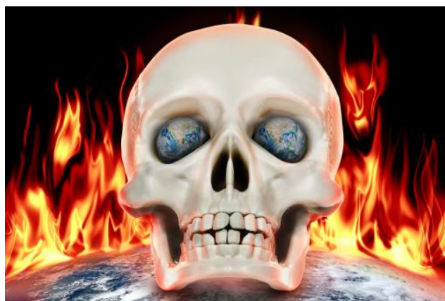
Obrázek 3 Fotomontáž lebky v plamenech

Fotomontáž amerického prezidenta Joe Bidena a ruského prezidenta Vladimira Putina před výbuchem v pozadí má pravděpodobně za cíl ukázat střet těchto dvou velmocí a zastrašit před jadernou válkou. Fotografie obou prezidentů jsou upraveny základními vodítky, tedy přesněji kontrastem, který dodává fotografiím větší dramatičnost. Článek z 8. července 2022 Všichni by měli vědět, že jsme ještě nic vážného nezačali.