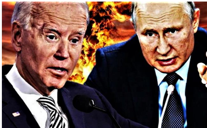
Obrázek 2 Fotomontáž amerického a ruského prezidenta

Nejhojněji (65.8 %) se v článcích vyskytují manipulované obrázky ve formě různých fotomontáží.