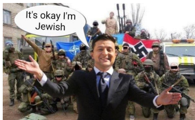
Obrázek 4 Fotomontáž Zelenského a pluku Azov