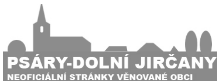
Obr. 2 Logo neoficiálních stránek obce

Při přípravě návrhu loga byl kladen důraz na jednoduchost a podprahovost. Již logo neoficiálního webu obce bylo velmi jednoduché a zapamatovatelné. Tvořila ho jednoduchá černobílá silueta dolnojirčanského kostela, dominantního prvku a zároveň nejznámější dochované místní památky. Funkce loga byla lehká zapamatovatelnost a podprahově probuzení pocitu identity, jednoty a obecního cítění.