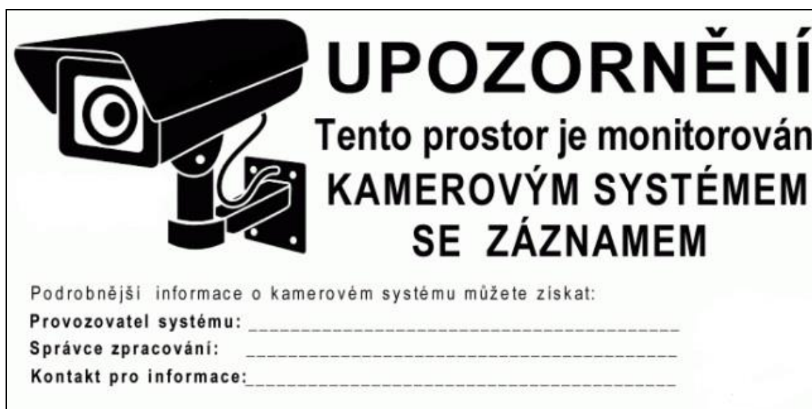
Obrázek 2 – Vzor informační tabulky při provozu kamerového systému

Níže je uvedený vzor informační tabulky při provozu kamerového systému.