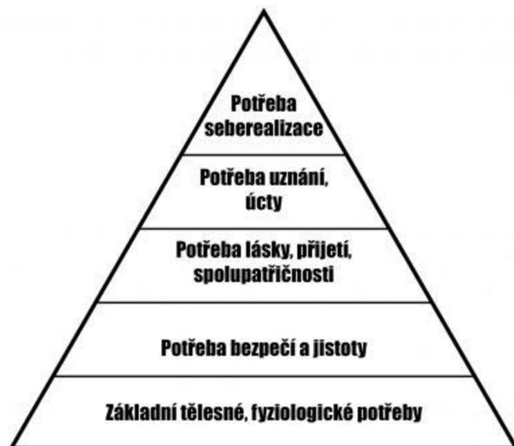
Obrázek 1: Maslowova pyramida potřeb

Základním stavebním kamenem pyramidy jsou fyziologické potřeby. Jde o základní potřeby, jako je jídlo, voda, odpočinek, oblečení a teplý prostor k životu. Osoby bez přístřeší často bojují se zajištěním těchto základních potřeb. Následují potřeby bezpečí. Bezdomovci potřebují pocit bezpečí, stability a ochrany před nebezpečím či násilím. Stálé přístřeší, ošacení a zdravotní péče jsou zde klíčové aspekty. Třetí jsou potřeby lásky a sounáležitosti. Osoby bez přístřeší často čelí sociálnímu vyloučení a izolaci. Mají potřebu navázat a udržovat mezilidské vztahy, jako je přátelství, rodina a společenská soudržnost. Další jsou potřeby uznání. Bezdomovci potřebují pocit hrdosti, sebeúcty a uznání svých schopností. To zahrnuje možnosti k seberealizaci, jako je zaměstnání, vzdělání a možnosti osobního rozvoje. A poslední jsou potřeby seberealizace. Jde o nejvyšší úroveň v Maslowově hierarchii, kde jedinec usiluje o naplnění svého potenciálu a hledání smyslu života (Hradecký, Hradecká, 1996, s. 38-39).